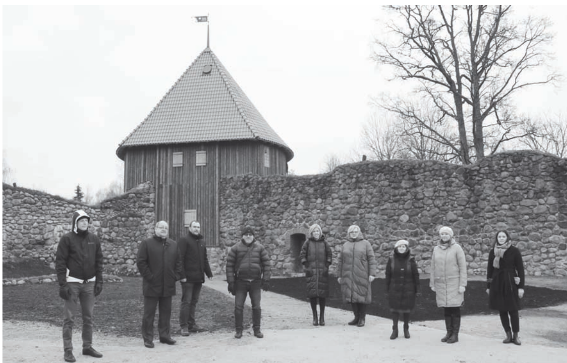
Objekta pieņemšanā piedalījās visu iesaistīto pušu pārstāvji

16. gs. 2. pusē celtā un priekšpils dienvidu stūrī izvietotā, ugunsieroči piemērotā torņa apjoms un jumts rekonstruēts pēc 17. gs. zīmējuma. Torņa un tā apkārtnes arheoloģiskās izpētes laikā, ko vadīja SIA "ARCHEO" arheologs Uldis Kalējs, paveikti ievērojami darbi - attīrīta pagalma puses siena, atsegta logaile,