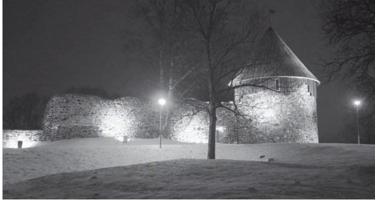
Dienvidu tornis tumšajā diennakts laikā ir izgaismots

Projektu "Gaismas ceļš cauri gadsimtiem" Alūksnes novada pašvaldība īsteno sadarbībā ar Gulbenes un Cēsaines novadu pašvaldībām un Smiltenes evaņģēliski luterisko draudzi Kultūras ministrijas Eiropas Savienības fondu līdzekļu Darbības programmas "Izaugsme un nodarbinātība" prioritārā vir-