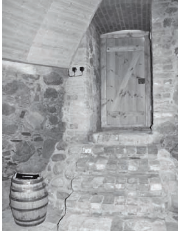
Kāpnes, kas ved iekšā Dienvidu tornī