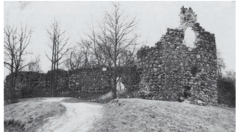
Skats uz Dienvidu torni 20. gadsimta sākumā