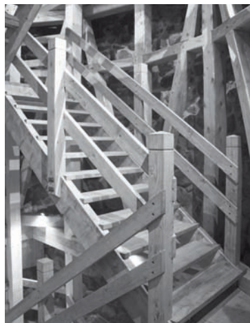
Dienvidu torņa iekšējās kāpnes

zienu "Vides aizsardzības resursu izmantošanas efektivitāte" 5.5.1. specifiskā atbalsta mērķa "Saglabāt, aizsargāt un attīstīt nozīmīgu kultūras un dabas mantojumu, kā arī ar to saistītos pakalpojumus" ietvaros. Projekta mērķis ir atjaunot un attīstīt septiņus valsts nozīmes kultūras mantojuma objektus – Alūksnes pilsdrupu Dienvidu torni, Pavilonu-rotundu ieb Slavās