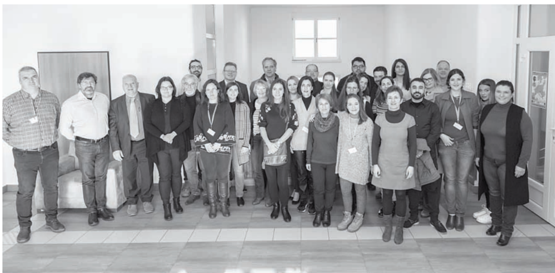
Visi iesaistītie projekta partneri kopā ar ekspertiem

Uz tikšanos bija ieradušies visi projekta partneri, lai iepazītos ar tā gaitu katrā no partnerpilsētām. Tā kā šis projekts ir sadalīts divos virzienos, tikšanās ļāva labāk izprast gan nevalstiskā sektora darbību, gan POP – UP kustības attīstību. Tikšanās laikā no ekspertu puses tika saņemts projekta vidus termiņa izvērtējums, pārrunājot projekta progresu, līdz šim paveikto un turpmākās ieceres. Apspriedi organizatoriskie jautājumi par projekta rezultātu demonstrēšanas pasākumu 2020. gada jūnijā. Sanāksmes noslēgumā Ungārijas URBACT eksperts pastāstīja par vietas izveides (Placemaking)