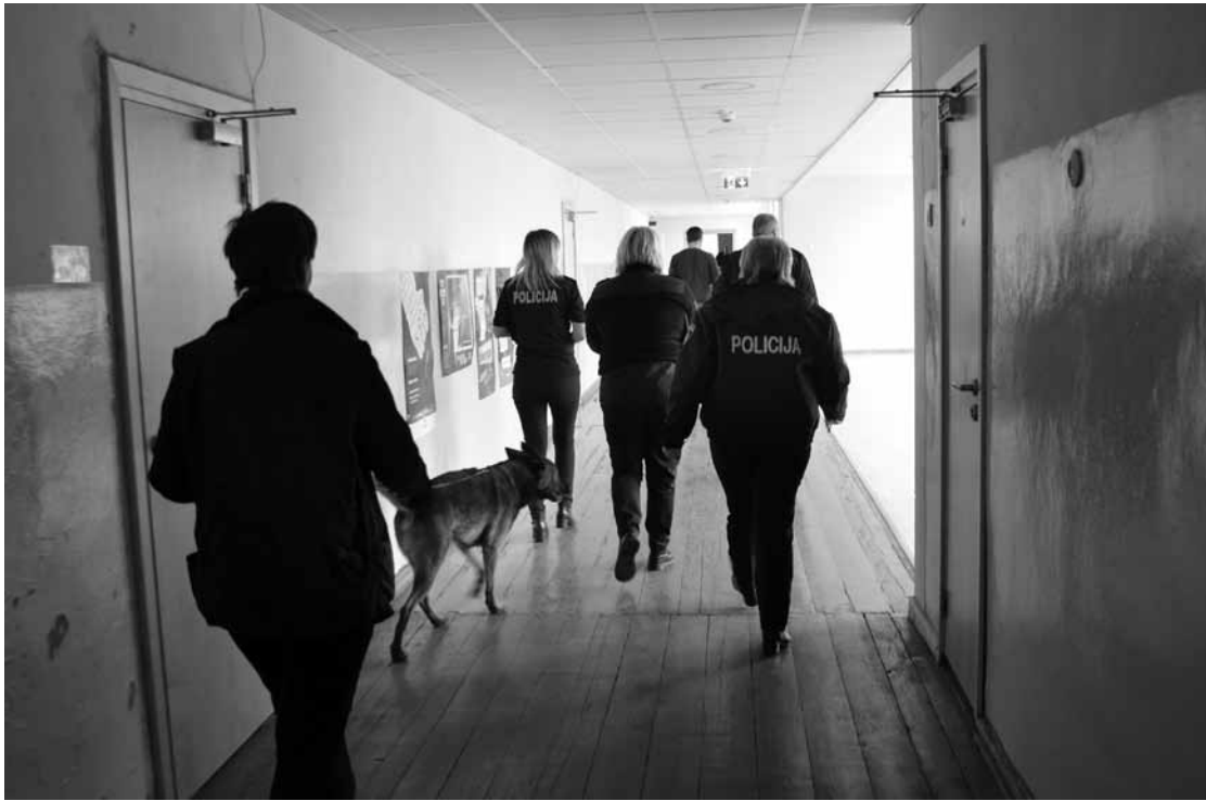
Valsts policija reidā meklē narkotikas Kuldīgas 2. vidusskolā.

Trešdien Valsts policija (VP) kopā ar Valsts ieņēmumu dienesta (VID) muitas krimināl-pārvaldi Kuldīgas 2. vidusskolā reida laikā pārbaudīja, vai skolēniem nav narkotisko vielu, un uz vairākiem pusaudžiem suns reagēja.