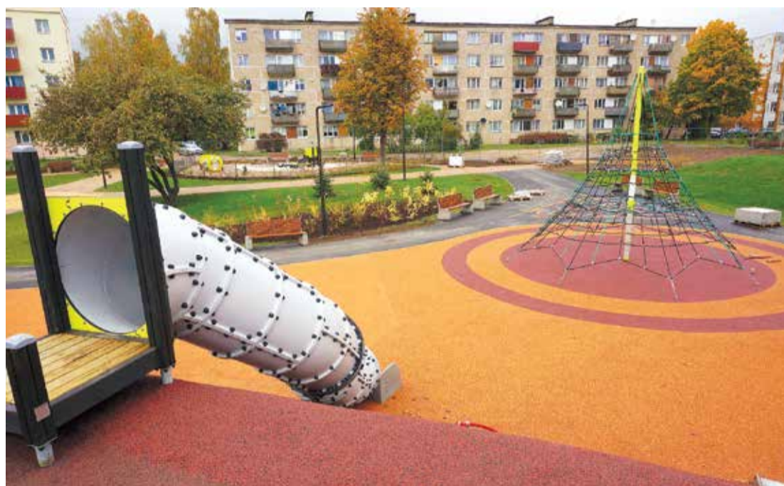
Aktīvās atpūtas laukums Saulkalnē.

Gar sporta un rotaļu laukumiem ir mākslīgi izveidoti dažādi paguri, kas aizsargā laukumu no Daugavas vējiem un brauktuves tuvuma. Tie ne tikai uzlabo ainavu, bet arī, piemēram, var tikt izmantoti kā slidkalniņi.