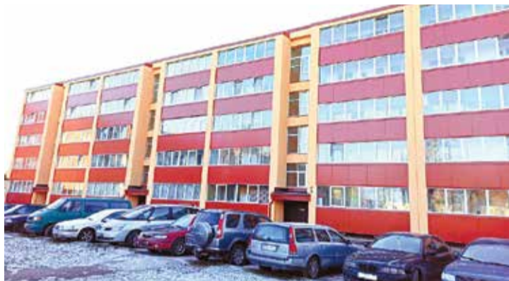
Pēc renovācijas. Rezultāts ir acīmredzams.

ciklu, uzlabo ēkas ārējo izskatu un mikroklīmu telpās, kā arī sakārto apkārtējo vidi. Atjaunotas mājas jaunā dzīve rezultējās arī īpašuma vērtības pieaugumā. Diemžēl būvniecības darbu procesā cieš dzīvokļu remontā. Iedzīvotāju daļai, kas neatbalsta renovāciju, emocionāli grūti pārdzīvot nepieciešamību šķirties no iecienītām tapetēm un flīzēm. Maskavas 1 iedzīvotāju vidū arī ir īpašnieki, kas līdz pēdējām būvniecības darbu piekļūvi dzīvokļos. Protams, to var saprast. Sveši cilvēki dzīvoklī, neērtības, nekārtība, nepieciešamība atjaunot remontu, kas prasa papildu finanšu līdzek-