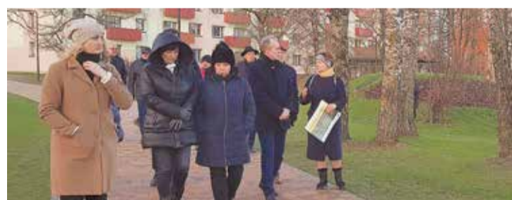
Konkursa komisija atzinīgi novērtēja pašvaldības ieguldīto darbu.

Savukārt 2. vidusskolas teritorijā izbūvēts pilnīgi jauns apgaismojums, izveidojot modernas laternas gar gājēju celiņiem un speciālu apgaismojumu sporta laukumos. Izbūvēta drenāža un papildināti lietusūdeņu kanalizācijas tīkli, nodro-