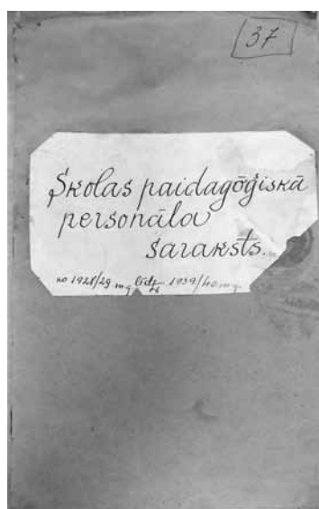
Skolas pārdarītāja personālo saraksts no 1928. līdz 1940. gadam.