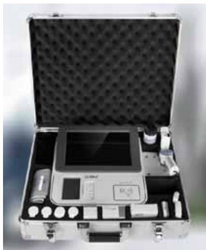
Pārnēsājamo daudzparametru aparāturu var ielikt ķemodānā un aizvest uz pacienta mājām, lai tur mērītu veselības rādītājus.