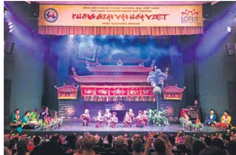
Vjetnamas leļļu teātris uz ūdens. Hanoja.

Ceļā devāmies oktobra sākumā, izmantojot aviokompānijas Qatar Airways pakalpojumus. Bija ļoti ērti, ka ilgais lidojums tika sadalīts divās daļās. Dažu stundu paurtē pasaulē bagātākās valsts Kataras lidostā ļāva izlūcīt kājas, nobaudīt austrumu saldumus un papriciēties par baltojais paltarakos tērtajiem arābu vīriešiem. Nogaršojām arī īpašo arābu kafiju ar kardamonu, ko