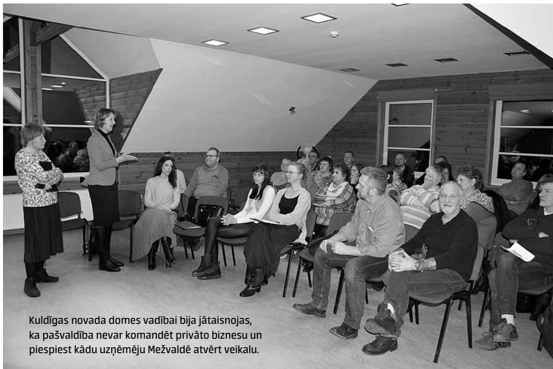
Kuldīgas novada domes vadībai bija jātaisojas, ka pašvaldība nevar komandēt privāto biznesu un piespiest kādu uzņēmēju Mežvaldē atvērt veikalu.

Autoceļiem speciālajā budžetā pērn bijuši 43 400 eiro, un izdevies ietaupīt, jo tikpat kā nebija sniega. Divas reizes tīrītājs gan izbraucis, un tas izmaksājis vairāk nekā 3500 eiro, planēšana – nepilnus 10 000 eiro, apauguma noņemšana – gandrīz 3000 eiro, ceļmalu pļaušana – ap 2400 eiro, asfalta bedru lāpīšana (Ēdās, Novadniekos, Lāsēs un Mežvaldē) – 2720 eiro, divkārtšā virsmas apstrāde Klusajā un Rudupes ielā – 5660 eiro, ceļa zīmes, seguma un caurteku remonts kopā izmaksājis