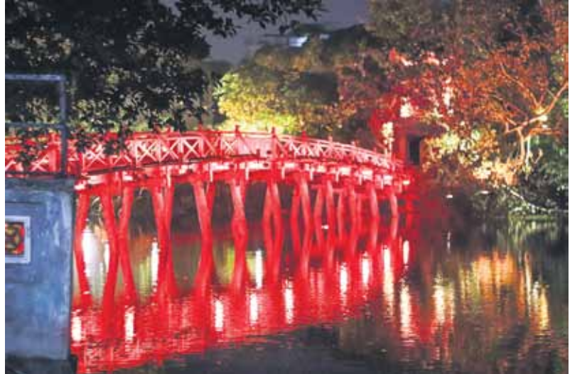
Atdotā zobena ezers vakara gaismās. Hanoja.