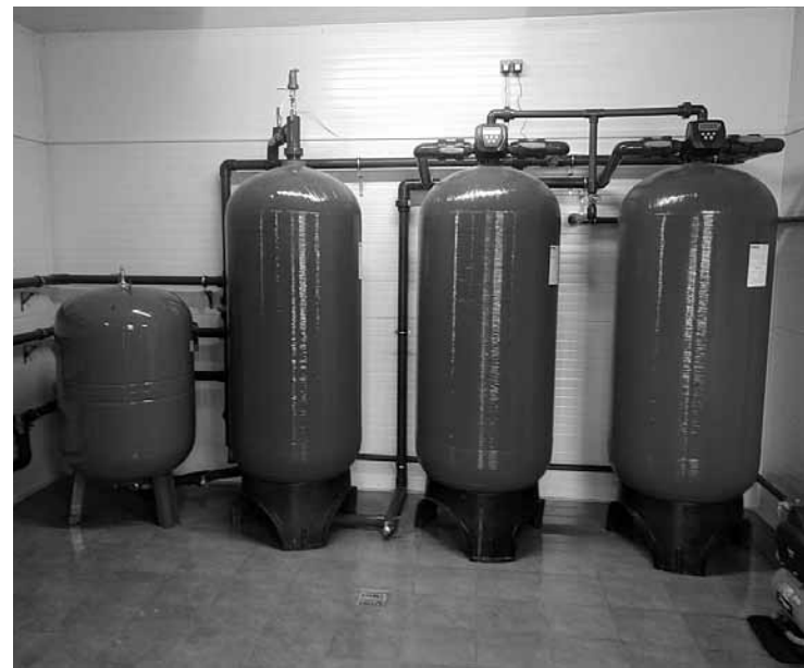
Atjaunotā atdzelzošanas stacija Mežvaldes iedzīvotājiem piegādā labu dzeramo ūdeni.

Ierastā ritmā darbu atsākusi atdzelzošanas stacija Rumbas pagasta Mežvaldē, kur trīs mēnešus to atjaunoja Kuldīgas ūdens .