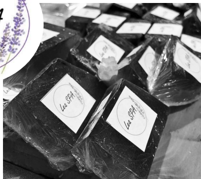
Uzņēmuma Lea SPA pārdotākās preces ir ziepes.