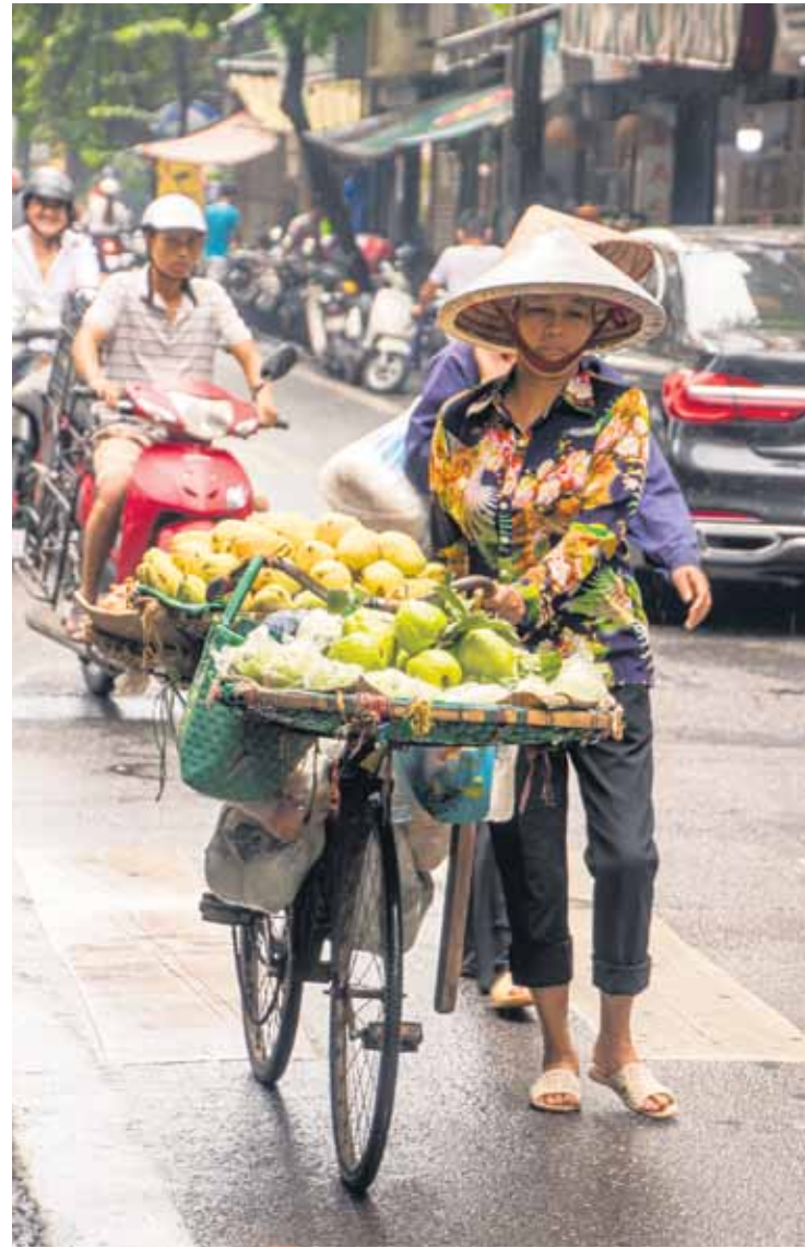
Augļu pārdevēja tradicionālajā konusveida cepurītē. Hanoja.

Noteikti jāpiemin Hanojas vājprātīgā satiksme. Nepārtrauktā plūsmā cieši viens pie otra traucas motorolleru jūra. Pagrieziena rādītājus šeit neviens nelieto, arī bežsarga paziņojums, kas ar nepareiziem datiem vīzu izsniegt nevarēs, ir gandrīz kā nāves spriedums. Caur prātu izskrien doma par filmu Lidosta , kurā galvenais varonis bija spiests savu atlikušo dzīvi pavadīt lidostā. Izrādās, ka robežsardzes priekšnieks par 25 dolāriem ir gatavs dokumentus pārskatīt, un burtiski piecu minūšu laikā mūsu pasēs ir vīza! Čeku par šo pakalpojumu, protams, neraucemam.