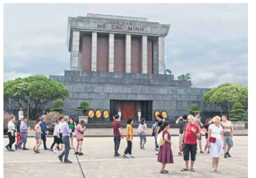
Hošimina mauzolejs. Hanoja.