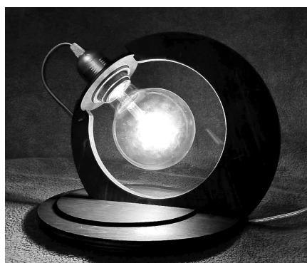
Grāmatarga jaunais ražojums – dizaina galda lampa.