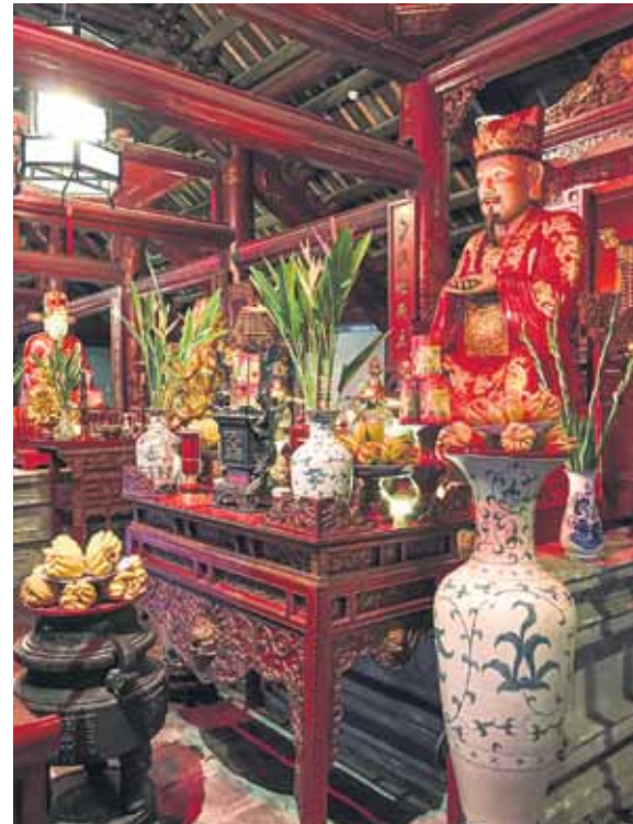
Pie Konfūcija Literatūras templī. Hanoja.