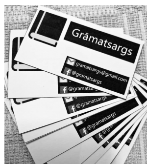
Skolēnu veidotās vizītkartes.