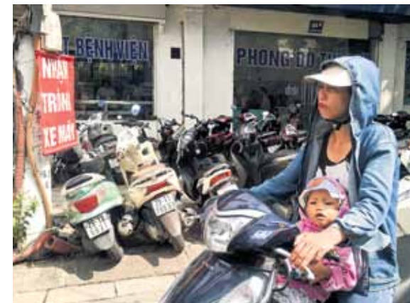
Ģimenes transporta līdzeklis. Hanoja.