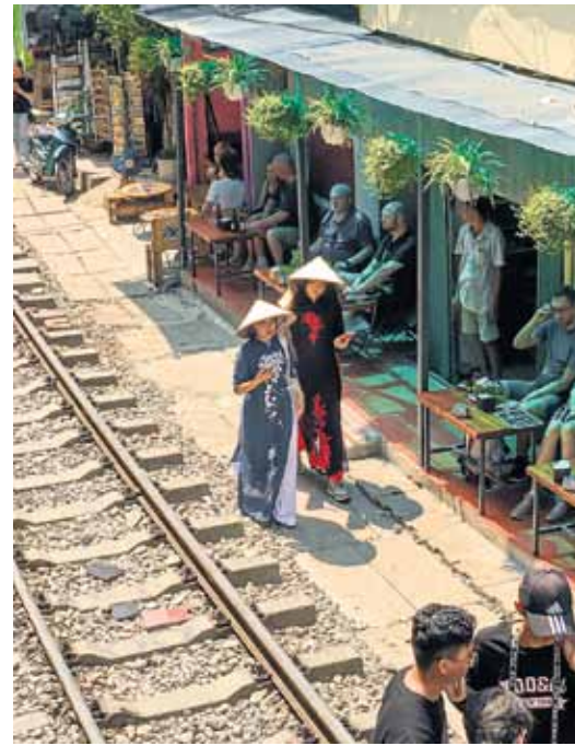
Tran Phu jeb vilciena iela. Hanoja.