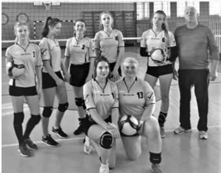
U-17 meiteņu volejbola komanda Rēzeknē.

18. - 19. janvārī Rīgā U-15 vecuma grupas zēni Latvijas Jaunatnes čempionāta ietvaros aizvadīja 2. līgas 1. grupas spēles. Divās dienās izspēlētās trīs spēles. Spēlē ar Mārupes sporta centra komandu izcīnīta uzvara četros setos (3:1). Četros setos puīši diemžēl piekāpās Rīgas VS komandai (1:3). Zaudējums arī spēlē ar Minus VS komandu (0:3).