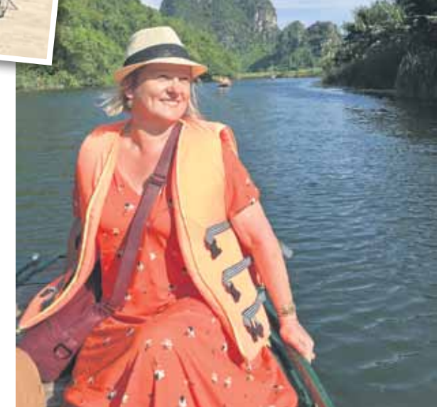
Antra braucienā ar laivu dabas parkā Trang An.