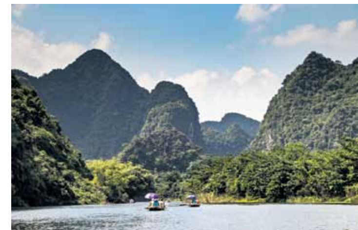
Pa Kingkonga pēdām. Dabas parks Trang An.

paši par sevi, jo viesu mājas saimnieks parāda, ka rīteņiem taču varēja ieslēgt lukstus. Pēc kārtīgām vakariņām relaksējamijs baseinā, kas ir skaisti izgaismots un atvēlēts mums vienīgajiem.