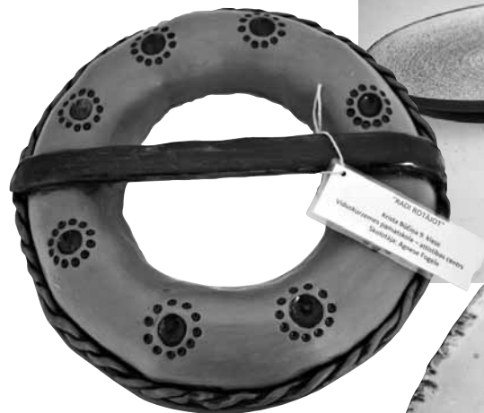
9. klases audzēknes Kristas Būčiņas darbs Radi rotājot .