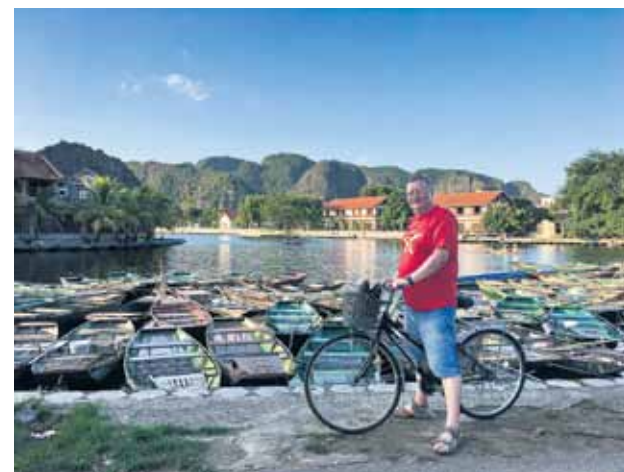
Aldis gatavs izbraukumam pa Tamkukas dabas parku.