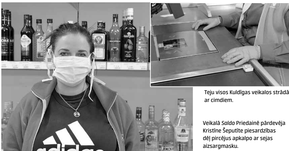
Teju visos Kuldīgas veikalos strādā ar cimdkiem.

Kurzemnieks 16. un 17. aprīlī apskatīja tirdzniecības vietas un degvielas uzpildes stacijas Kuldīgā un pārliecinājās, ka teju visos veikalos jau ir brīdinošie plakāti, lai pircēji ievēro divu metru distanci. Vairākos veikalos intensīvi tika līmētas atzīmes, lai pircēji spētu orientēties un noteikt, cik lielā attālumā vienam no otra jāturas. Pie ieejas klientiem bija iespēja dezinficēt rokas vai izmantot vienreizlietojamus cimdus. Piesardzības pasākumi bija novērojami arī mazākos veikalos un degvielas uzpildes stacijās. Pārdevējas aiz letes stāvēja ar sejas maskām, strādāja cimdos, no klientiem viņas nošķīra stikla sienu. Diemžēl dažās tirdzniecības