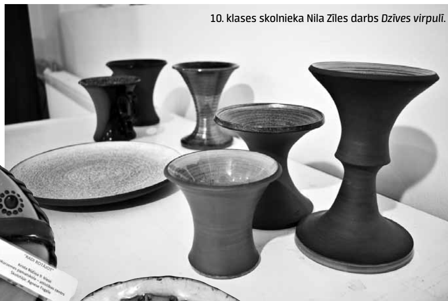
10. klases skolnieka Nila Ziles darbs Dzīves virpuļi .