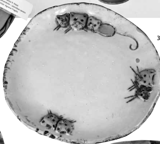
3. klases audzēknes Santas Zelčas šķīvis Ķepaiņi un ūsaiņi .