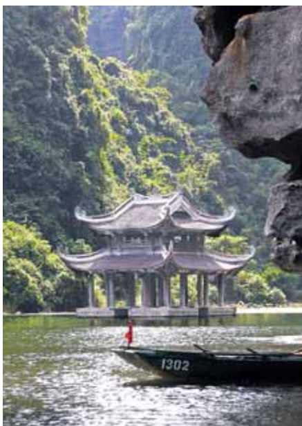
Dabas parks Trang An.