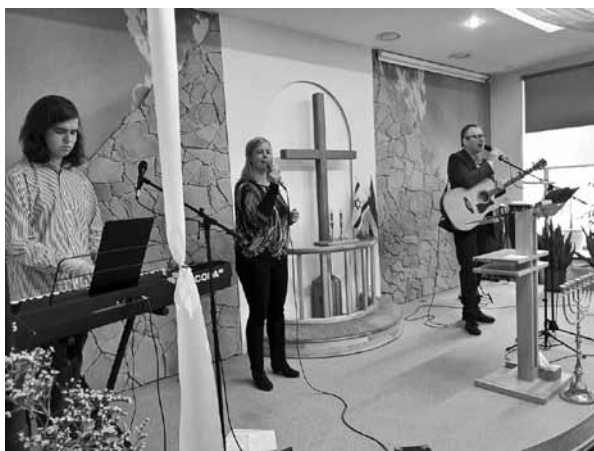
Dzied Dedžu ģimene no Talsiem.