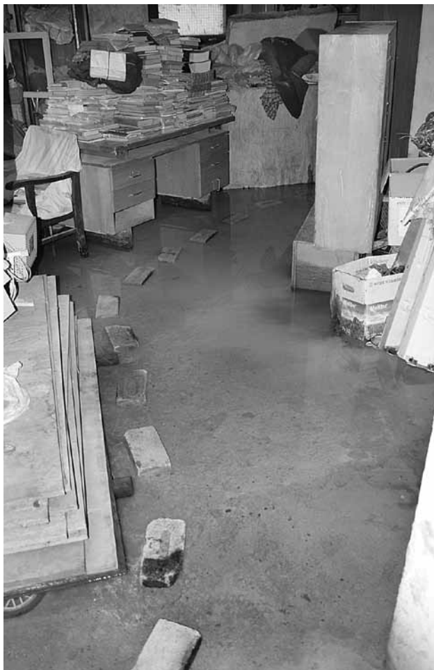
Kuldīga, Jelgavas ielas 17. nams. Pagrabi dienu pēc tam, kad izsūknēts ūdens. Iedzīvotāji pārliecināti, ka te sūcas nevis lietusūdens, bet apakšzemes ūdeņi.

iedzīvotāji: „Katru otro dienu pagrabus izsūknē, bet tas neko nelīdz, jo jau pēc dienas ūdens ir atpakaļ. Mums ir tikai viens jautājums: „Vai un kad kaut kas tiks darīts?””