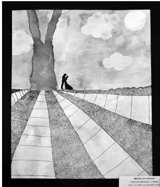
4. klases skolnieces Katrīnas Kaltnieces glezna Medus un mēness .