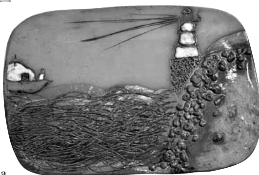
6. klases skolnieka Ralfa Berkina darbs Kurzemes bāka .