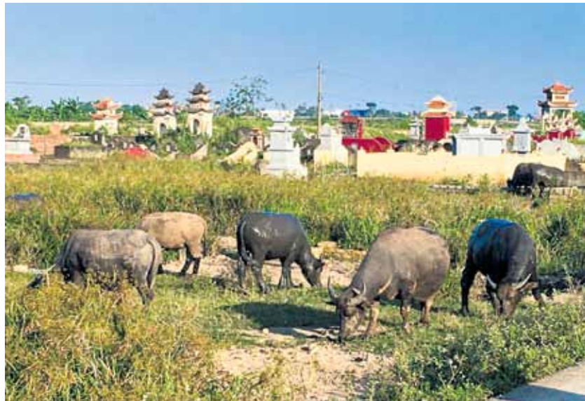
Ūdens bifeļi ganās kapos. Tamkuka.