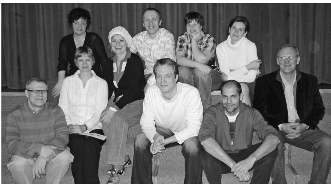
Kopā ar Bostonas, kas Amerikā ieradušies beidzamos gados

Pagājušas „Mīlestības vēstulju” izrādes Toronto, Kanadā, un ASV Austrumu krastā.