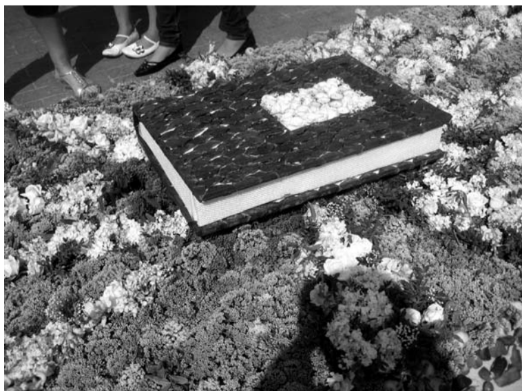
Arī ziedu grāmata ir tilts uz saprašanos...

matemātisku precizitāti aprēķinājis, lai gaismas pietiktu visiem, un šajā dārzā labi jūtas gan magnolija un ciedrs, gan siksiki,