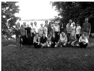
Kursu dalībnieki pirmajā vakarā pie Daugavas (foto nav redzami visi dalībnieki)

Daugavas krastos, Lielvārdes pilsētā, Andreja Pumpura Lāčplēša muzejs no 4. līdz 7. augustam bija vieta, kur pulcējās 30 latviešu valodas skolotāji (gan pārsvarā skolotājas ar pāris stiprā dzimuma pārstāvjiem) un jautrā gaisotnē mācījās, dalījās pieredzē, bet galvenais – sadraudzējās un vairs nejutās, ka