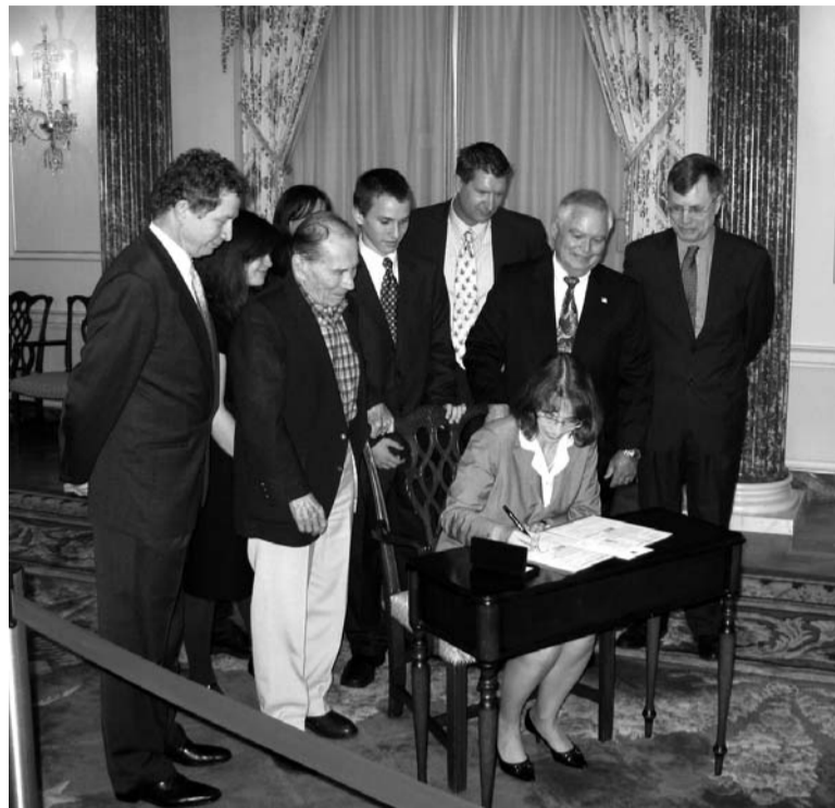
Jaunā ASV vēstniece Latvijā Džūdija Gārbera paraksta dokumentus

un Eirāzijas lietu nodaļu. Viņas kandidatūru senātā apstiprināja jūlijā, un jau 24. augustā Dž. Gārbera dosies uz Latviju iesniegt akreditācijas dokumentus Latvijas valsts prezidentam. Jaunās vēstnieces prieka un triumfa brīdi piedzīvoja visa ģimene. Zvēresta do-