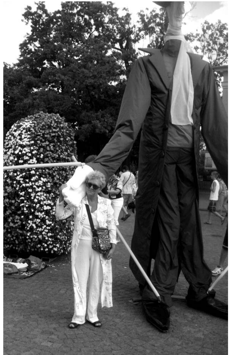
Ar Lielo rakstnieku centās nofotografēties gan mazie, gan lielie lasītāji

siem no daudzām pasaules valstīm, tajā ietilpināti arī pašmāju autoru Ventspilī tapušo darbu fragmenti. Mazie pilsētnieki mazliet nobijās, lielie uzjautrinājās par Lielo rakstnieku, vīru divstāvu mājas augstumā.