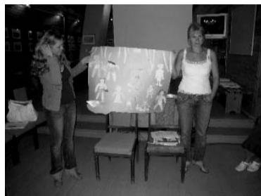
Grupās sniegums par pigmiem

līdzekļiem ar bērnu līdzdalību var izgatavot mācību, kā izveidot stundas, kur vienā grupā ir bērni ar atšķirīgiem valodas līmeņiem, un daudz ko citu. Sko-