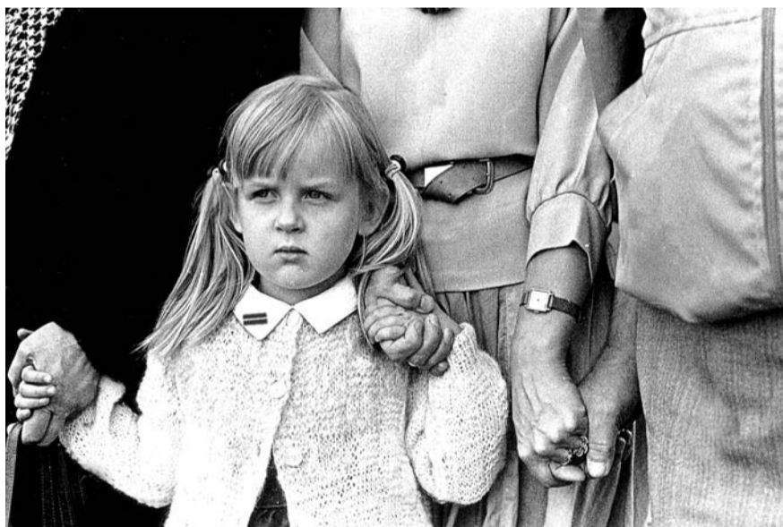
1989. gada 23. augusts. Madarai tagad ir 25 gadi

iezīmēta kartē ar simbolisku visu trīs Baltijas valstu iedzīvotāju daļību diennakts stafetes skrējienā no Viļņas un Tallinas uz Rīgu.