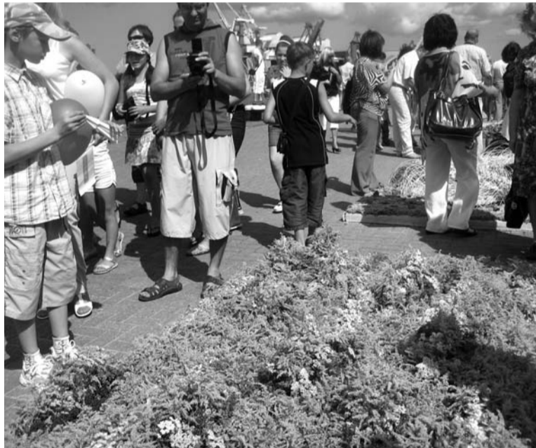
Ziedu fantazijas varas pārņemtie

Ventspilnieki ir pelnījuši uzslavu, viņi savu pilsētu rūpīgi kopj, neaizlaiž postā senos un ne tik senos dzīvojamus namus. Tagad Ventspils var mēroties glītumā ar daudzām Rietumeiropas pilsētām. Jāpiebilst, ka septembra pirmajā svētdienā Ventspils brīvdabas muzejā pulcēsies novadu čaklākie ļaudis, rādot savas prasmes un nacionālos ēdienus!