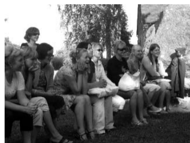
Skolotājas ar interesi seko līdzi "Lāčplēša" dramaturģijai

Kursos bija gan nopietni brīži, kur lekciju formātā pasniedza informāciju par Eiropas valodu portfeli, bilingvālo mācību metodi un Eiropas kopīgām pamatnostādņēm valodas apguvei, gan ļoti radoši momenti, kur skolotājiem bija jāveic uzdotu uzdevumu grupā un rezultātu jāpasniedz pārējiem kursu dalībniekiem. Viens no jautriem brīžiem bija vienas grupas sniegums par pašizdomātu pigmeju cilti, kur katrs individuāli spēja atjautīgi pievienot savu devumu, tādējādi nodrošinot jautrību un