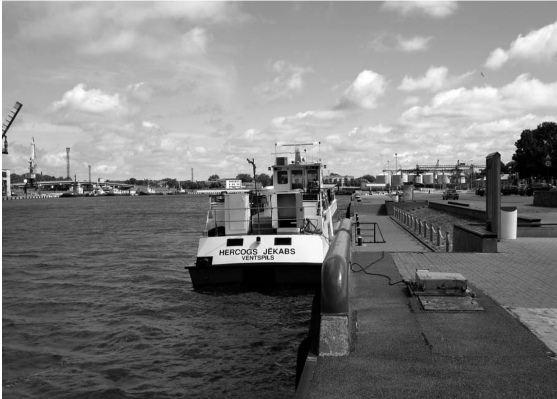
Labi būtu Ventspils ostā iekāpt „Hercogā Jēkabā” un kuģot līdz Tobago, kur 2010. gada jūnijā notiks 15. latviešu salidojums

Šogad ziedu kārtosanas māksliniekiem vienotā tema bija – tilti. Cik žēl, ka Ventspils ziedu svētku norisi nepārraida televīzijas kanālos tikpat vērienīgi kā Rožu parādi Pasadenā, jo pasaules floristiem būtu ko brīnīties. Par neparastās ekspozīcijas ap-