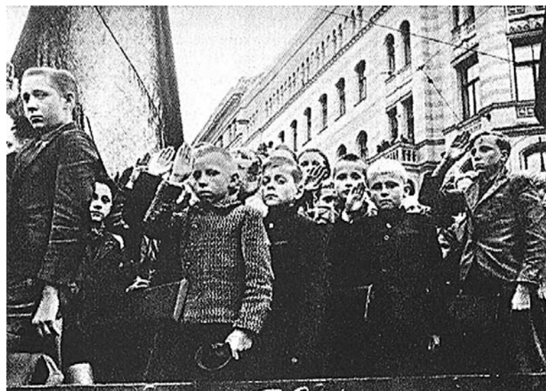
Latviešu bērni Rīgā spiesti piedalīties propagandas gājienos (1940.-1941. g.)