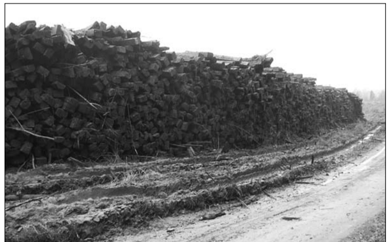
Dzelzceļa gulšņu kaudze