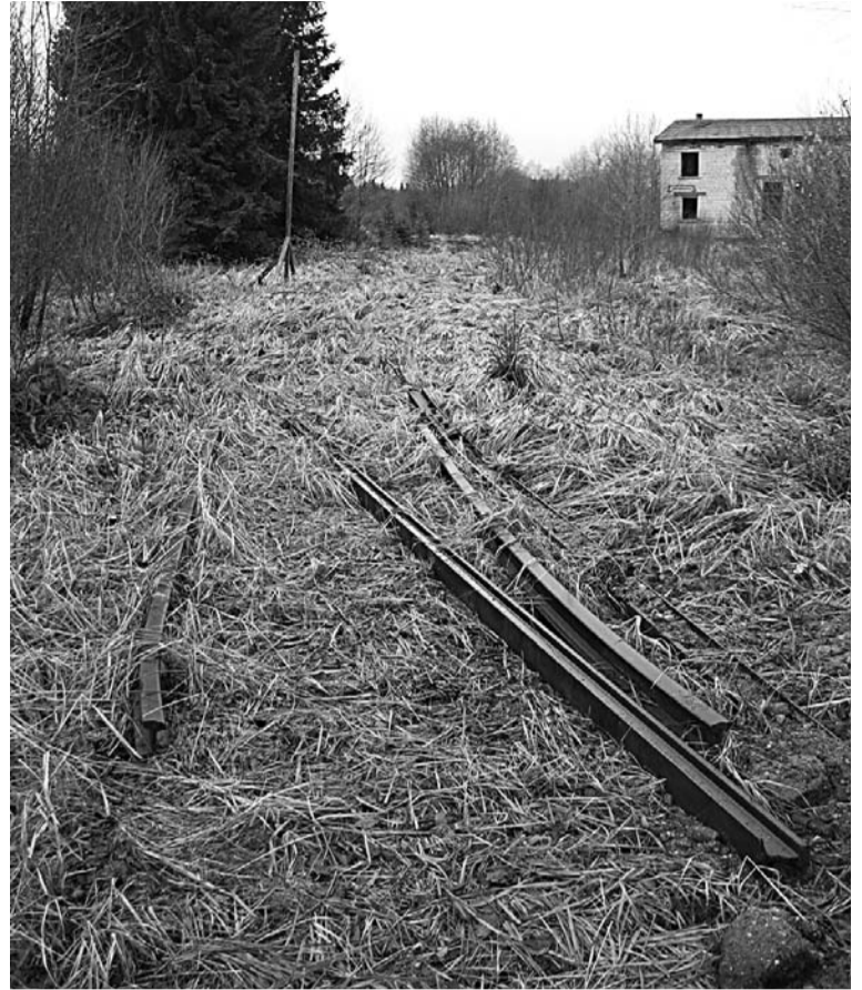
Kaut kas palicis pāri no sliedēm