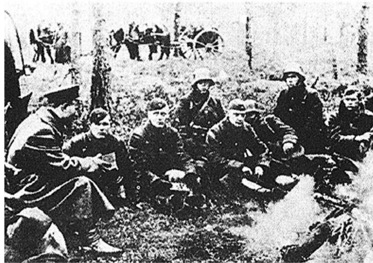
1940.-1941. gadā: Krievu politiskais virsnieks ”skolo” Latvijas jauniesauktos kaŗavīrus