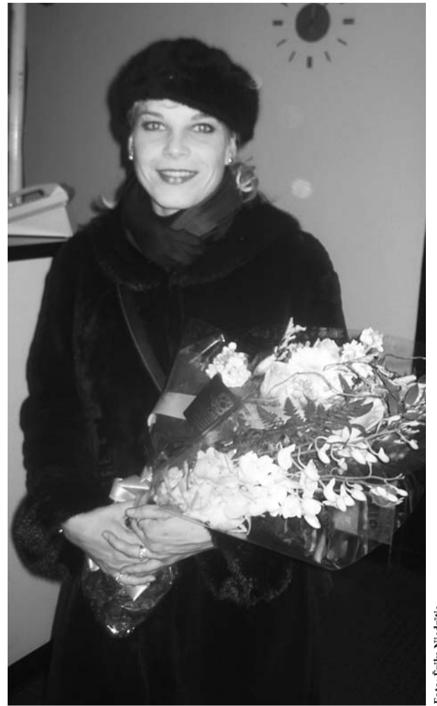
Elna Garanča pēc „Karmenas” izrādes ar latviešu pasniegtajām puķēm