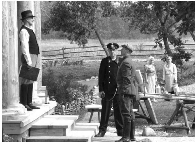
Skats no filmas - pie Rūdupa mājas lieveņa