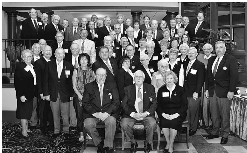
Delegāti un viesi