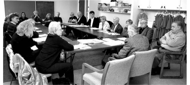
TILTA valdes sēde

Iespēju robežās TILTS mēģina atbalsta vēl citus vērtīgus projektus. robus. Daži piemēri: Latvijas Mūzikas akadēmijai, lai varētu izdot reprezentatīvu Jāzepa Vītola nošu krājumu; ceļa izdevumiem žurnālistei, lai dotu iespēju apmeklēt teātra festivālu