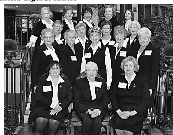
DV 56. vanadžu salidojuma delegātes