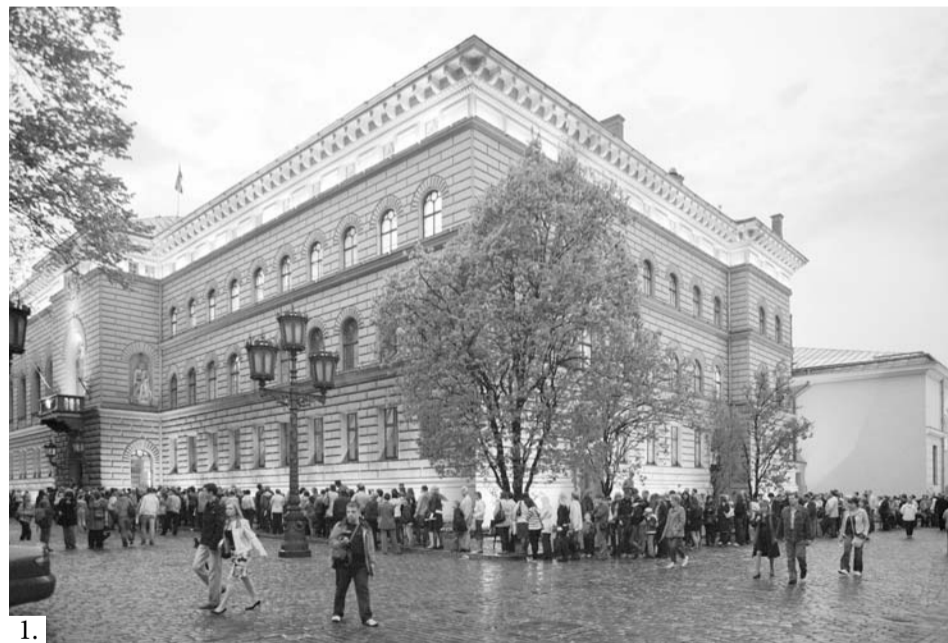
Foto mākslinieks Imants Urtāns uzņēmis Mūzeju nakts skatus dažādās Rīgas vietās. Apmeklētāju netrūka mākslas mūzejos (2.,3.), bija iespēja ieskatīties Saeimas namā (1.) un pavisam jaunajā Saules mūzejā Rātslaukumā (4.)