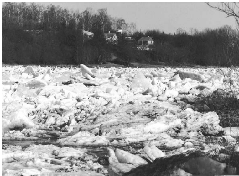
Daugavā vietām radušies ledu sablīvējumi

Saskaņā ar Valsts Vides, ģeoloģijas un meteoroloģijas dienesta novērojumiem pirmā ledu iešana sākās marta beigās Daugavā pie Krāslavas. Līdz ar to ūdens līmenis par diviem metriem cēlies Daugavā no Piedrujas līdz Jēkabpilij un paaugstinājies arī posmā Daugavpils – Vaikuļāni. Ar dažādu intensitāti ledu iet posmā Piedruja – Līksna; tas apstājies starp Līksnu un Nīcgali. Ledus sega ar izskalojumiem un brīva ūdens joslām gar krastiem saglabājas Nīcgales – Jersikas posmā. Ledus iešana un kušana izraisa ūdens līmeņa celšanos. Vienmēr pavasara pali vērojami Dunavas pagastā pie Cukurīņiem. Tur vairākas mājas ik gadu tiek atgrieztas no ārpusaules, tāpēc jau laikus tiek sagādāts viss saimniecībā nepieciešamais, bet bērnus uz skolu un pieaugušos uz darbu līdz ceļam aizved ar laivām. Ledus iet Jēkabpils – Zelķu posmā. Vienmērīgo Daugavas tecējumu sarežģīt vietām novērotie ledu sastrēgumi. Kritiskās vietas ir lepus Jēkabpils pie Zelķu tilta un Pļaviņām, kur ik pavasari Daugavas krastos novērota apkārtējo pļavu un apdzīvoto vietu applūšana. Lai ledu ātrāk izkausētu, marta otrā pusē Nacionālo bruņoto spēku lidmašīna "An-2" no Gaisa spēku