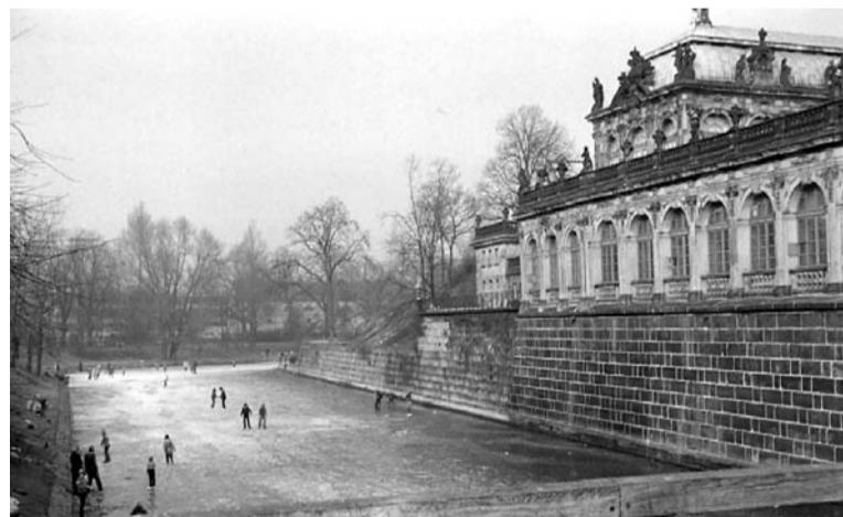
Drēzdenes skats. 1984.gads 13. februāris

laukumā. Esam izsalkuši un ejam meklēt kādu ēdnicu, ko arī atrodam, bet nekā ēdama tur nava. Mums gan laipni pasniedz skaištu rozā pudīni, bet tas garšo pēc kaut kā nedabīga un ož pēc tabakas. To atstumjam un ejam meklēt ko labāku, bet visas vietas ir bēglu pārpilnas un no ēdamā tukšas. Izsalkuši un saiguši, drūzmējāmies atpakaļ uz staciju. Tēvs mēģina mūs mierināt, saka, lai paciešamies, ka gan jau būs labi; viņš ies nopirkt biļetes, lai