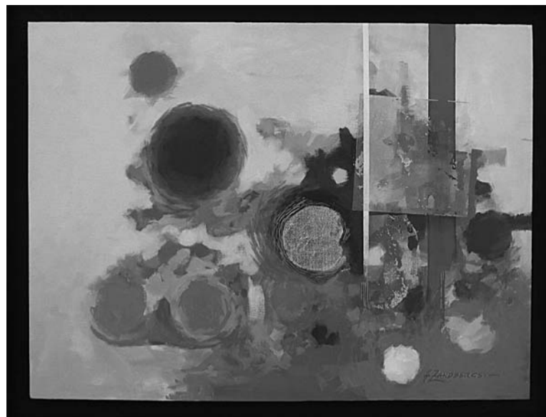
Aivara Zandberga glezna „Abstraktais kvadrāts” (akrils)