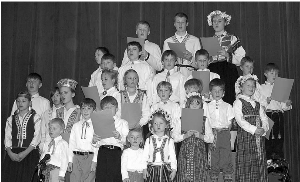
Milvoku Oskara Kalpaka latviešu skolas koris