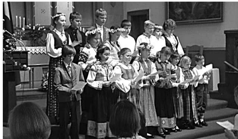
Skolas koris dzied dziesmu “Gaišais rīts baznīcā”