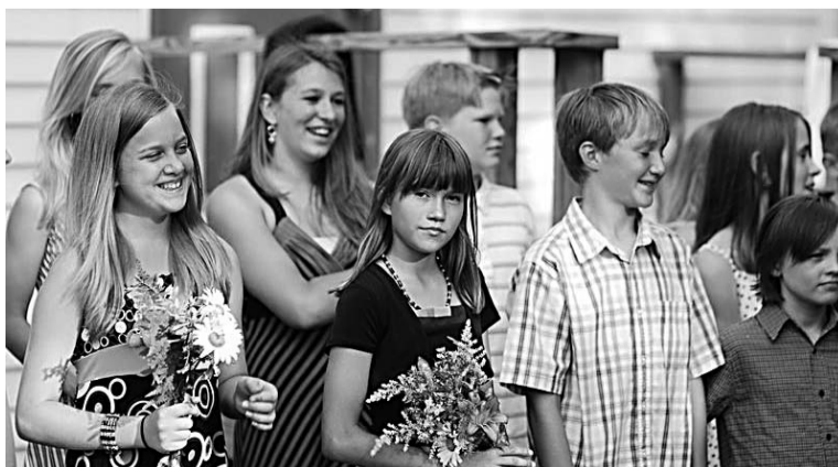
Pošamies uz Dinejballi!