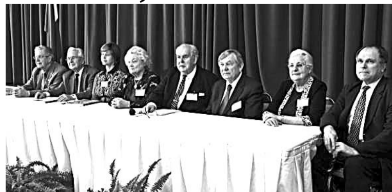
LNAK I & K fonda jaunaa valde