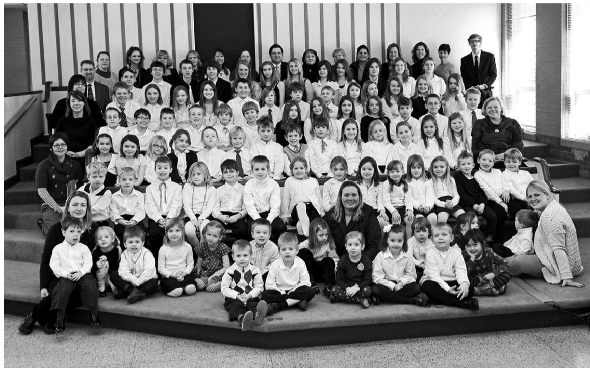
Čikāgas Krišjāņa Barona skolas saime