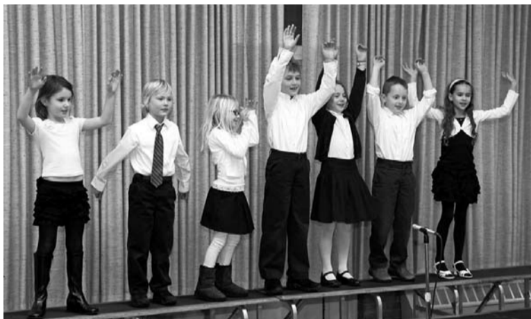
Dzied pirmās klases skolēni

denti. Visi nešaubiņģi pazina Kārli Ulmani un noraidīja komiku tēlus ar skaļu „nē”.