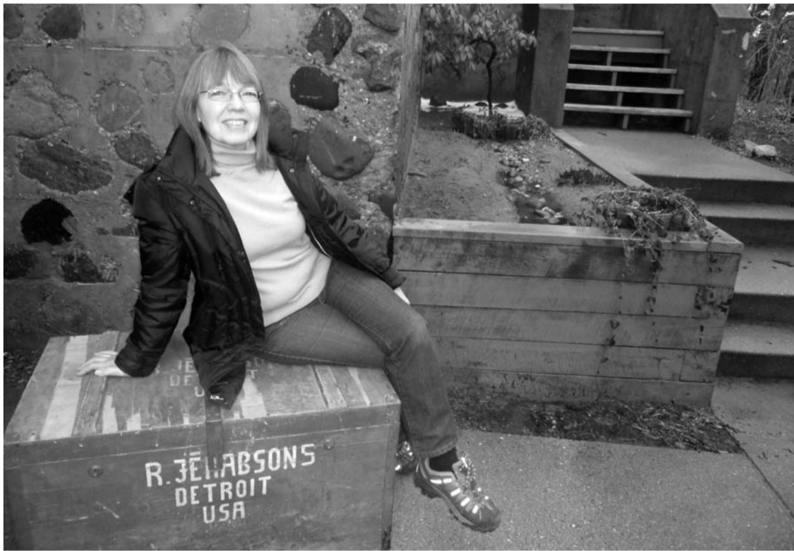
Līga un ģimenes relikvija – ceļalāde

No kuŗienes tev nāk iekšējais spēks, tā uguns, liesmiņa, kas liek darīt, rīkoties, veidot ko jaunu? Tu esi spējusi būt arī laba mājasmāte daudziem lat-