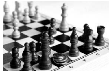
Šahs – intelektuāla spēle

Lūgums nosūtīts pēc apstiprinājuma saņemšanas no Latvijas Olimpiskās komitejas (LOK), kas izteica atbalstu Starptautiskās Šaha federācijas (FIDE) iniciatīvai par Olimpiskā sporta veida statusa piešķiršanu šaham un iekļaušanu Ziemas Olimpiskajās spēlēs.