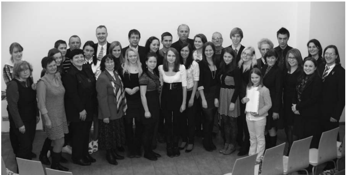
Literārā konkursa uzvarētāji, viņu skolotāji, žūrijas pārstāvji un viesi

Vēl žūrijas komisijas locekles izteicās, ka būtu ļoti jauki, ja jaunieši, uzsvērdami nacionālos jautājumus kā ļoti nozīmīgus, īpaši akcentējot mūsu nacionālās identitātes pamatvērtību – latviešu valodu –, pievērstu nedaudz vairāk uzmanības saviem izteiksmes līdzekļiem, cenšoties nepieļaut gramatikas, interpunkcijas un stila kļūdas. Skumdina studējošo un ārvalstīs dzīvojošo jauniešu aktivitātes trūkums – katrā no šīm kategorijām tika iesūtīts pa vienam darbam. Toties