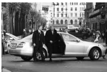
Eksprezidenta Valža Zatlera mersis

Valstij noteiktais pienākums nodrošināt bijušo prezidentu ar dzīvokli rada neizpratni par nodokļu maksātāju naudas izmantošanu. Piedāvātais risinājums ļautu saprātīgi un vienkārši plānot valsts budžeta izdevumus, jo nebūtu jātērē līdzekļi valsts dzīvokļa iegādei, uzturēšanai, remontam un komunālo pakalpojumu samaksai, norādīts likumprojektā.