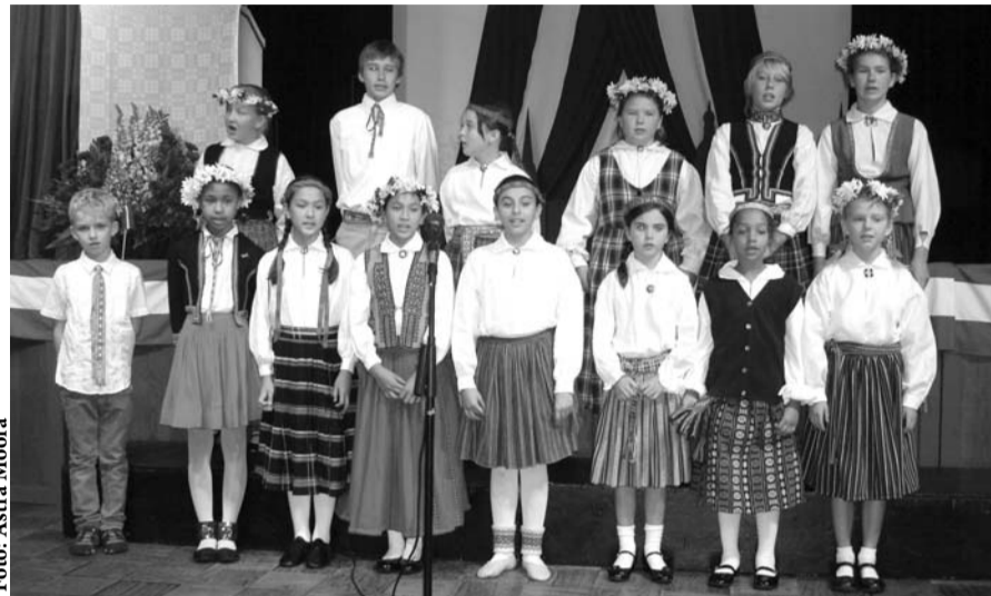
Losandželas latviešu skolas koris

Taube vecākais. Abu paveiktais latviešu sabiedrībai ir nenovērtējams. DK LB priekšnieks aicināja senāk un nesen iebraukušos iestāties biedrībā, darboties, palīdzēt.