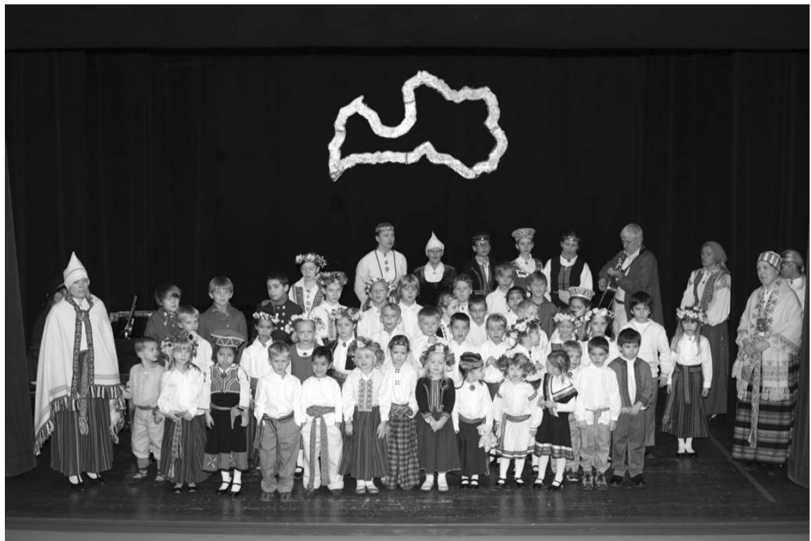
Vašingtonas draudzes pamatskolas saime Latvijas Valsts svētku sarīkojumā

Svarīgi ir plānoto vietni tīmeklī veidot, cik iespējams, pievilcīgu un draudzīgu lietotājam. Tai ir jābūt vietai, kur latvietis var atrast sev vajadzīgo informāciju. Pateicīgs avots iedvesmas gūšanai bija 12. novembrī notikušais seminārs Rīgā. Tajā piedalījās Latvijas televīzijas un radio cilvēki, sociālo tīklu un ārzemju latviešiem domāto mājaslapu pārstāvji, kuņi dalījās savā pieredzē