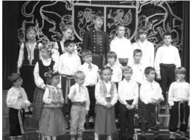
M. S. Dzied Milvoku Pulkv. O. Kalpaka latviešu skolas skolēni

Pēc akta vanadzies lūdza pakavēties pie glāzes vīna un uzkodām.