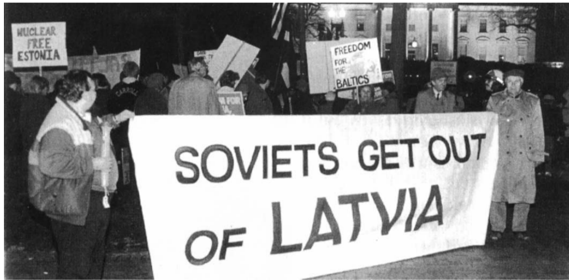
Baltiešu demonstrācijas M. Gorbačova vizītes laikā Vašingtonā, DC, 1987. gada 8. decembrī. Aizmugurē Baltais nams

pieņēma trīs rezolūcijas – vadlīnijas šādu iekšējo nesaskaņu kārtīšanai, lai novērstu latviešu sabiedrības ASV šķelšanos, nosakot, kā uzņemt, sazināties un/vai sadarboties ar viesiem no okupētās Latvijas.