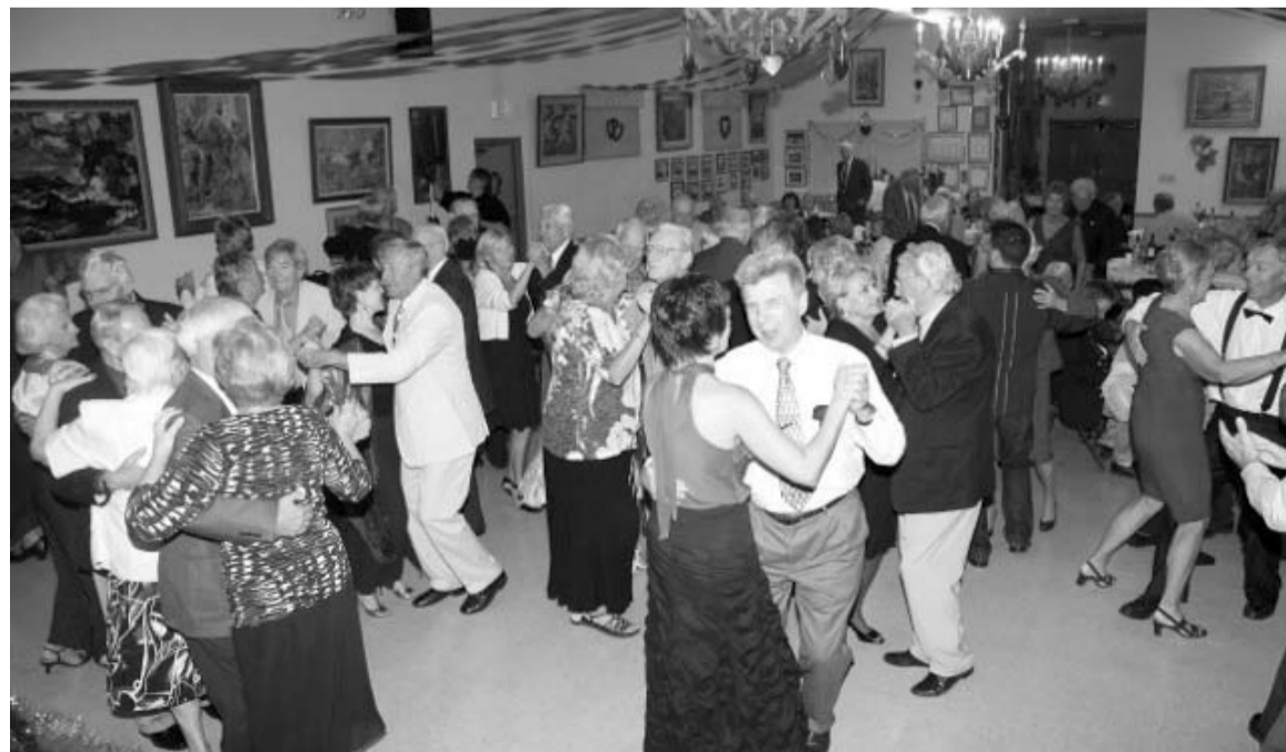
Pēc programmas, savas deju zināšanas varēja parādīt arī pārejie balles viesi

viņus apsveicām, nodziedot “Daudz baltu dieniņu”. Arī mums bija pārsteigums, kad lietuvieši piecēlās un dziedot viņus sveica savā valodā. Viesņās, māte un meita Eglītes, neatzinās, ka svinētu kaut ko speciālu, bet bija atbraukušas izbaudīt Floridas sauli un maigās Meksikas jūras līča vēsmas.