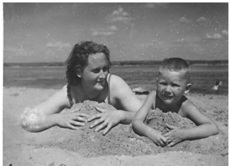
Pie Tomas upes kādā svētdienā 1953. g.