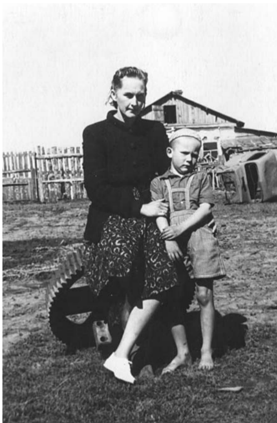
Mūsu "nama" priekšā kopā ar mammu 1954. g.