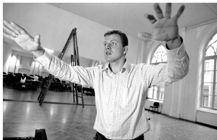
Komponists Ēriks Ešenvalds

Ē. Ešenvalds ir viens no latviešu jaunākās komponistu paaudzes spilgtākajiem skaņražiem. Viņš ir īpašs ar savas personības gaišo, pozitīvo lādiņu un viņa mūzikas sūtība, kā pats to atzīst, ir bijusi nolemtības radīta.