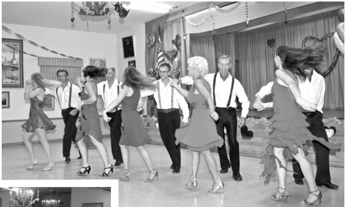
Sarkanās kleitas iederas Sirsniņu dienas ča-ča demonstrācijai