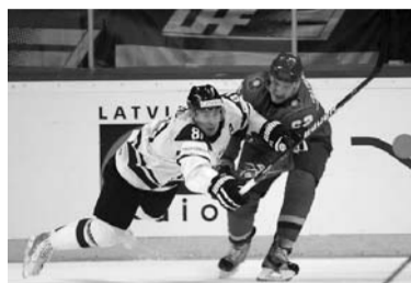
Spēles moments Latvijas – Kazachstānas spēlē

un epizode beidzās ar precīzu Rēdliha metienu no tuvas distances. Taču priecāties vēl bija pārāgi. Kazachstānas hokejistu rezultātu izlīdzināja – 2:2.