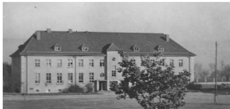
Skola švābu Gmīndes latviešu nometnē pēdējos mēnešos Vācijā - 1949. gadā

Mātei Rīgā beidzās skolas ārstes darbs, un viņa saņēma paziņojumu, ka jāpārceļas darbā uz Vāciju. Tēvs ne varēja, ne gribēja līdzi braukt, jo viņam bija jāpaliek darbā par Tautas Palīdzības – agrākā Latvijas Sarkanā Krusta medicīnas daļas administratīvo direktoru un jārūpējas, lai tūkstošiem latviešu bēgļu Kurzemē dabūtu medicīnisko aprūpi agrākajās un pārceltajās Sarkanā Krusta slimnīcās, sanatorijās, bērnu punktos un citur. Sekoja drudzaina pakošāšanās, jo līdzi varēja ņemt vienīgi dažas kastes un koferus. Dārgākās, vērtīgākās lietas no dzīvokļa Rīgā tika iemūrētas kāda nama pagrabā istabā, tā, ka nevarēja pateikt, kur bijušas pagrabā durvis. Tās piemeklēja tāds pats liktenis kā jūrmalā noraktās.