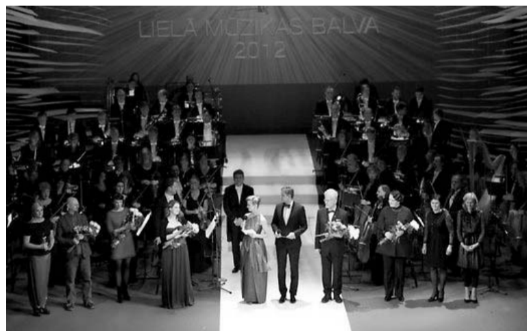
Balvu laureāti un Latvijas Nacionālais simfoniskais orķestris vakara noslēgumā