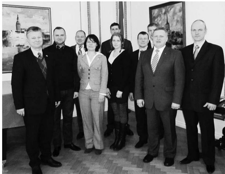
Vēstnieks Kārlis Eichenbaums (pirmais no kr.) tiek ar „Latvijas lepnus 2012” ieguvējiem

Igaunijas Glābšanas dienests apbalvoja Latvijas pārstāvjus ar dzīvības glābēju medaļām. Tas ir pirmais šāda veida apbalvojums cilvēkiem, kuŗi nedzīvo Igaunijā. Ierosmi par latviešu apbalvošanu Igaunija guvusi pēc publikācijām presē. Latvijas varoņi saņēma Glābšanas dienesta dzīvības glābēja III klases medaļu, ko svinīgā ceremonijā, klātesot Latvijas vēstniekam