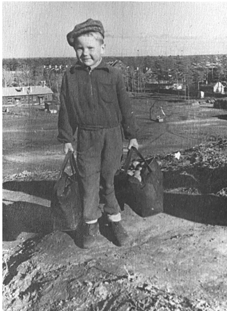
Kaspars – liels un stiprs – stiepj kartupeļu somas

un daudzkrāsaina. Barakas – tautu draudzības pamatsūnas miniatūrā. Ja baltieši parasti savas konfliktsituācijas risināja paceltas balss limenī, tad slavi to kārtoja tieši un nepārprotami, cits citu