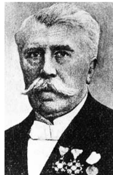
Johans Daniels Felsko

Viņa vadībā pēc cietokšņa vaļņu nojaukšanas tika izveidots pilsētas centrs. Felsko projektējis vairāku baznīcu, skolu un citu sabiedrisko celtnu būvi Rīgā un Piņķos.