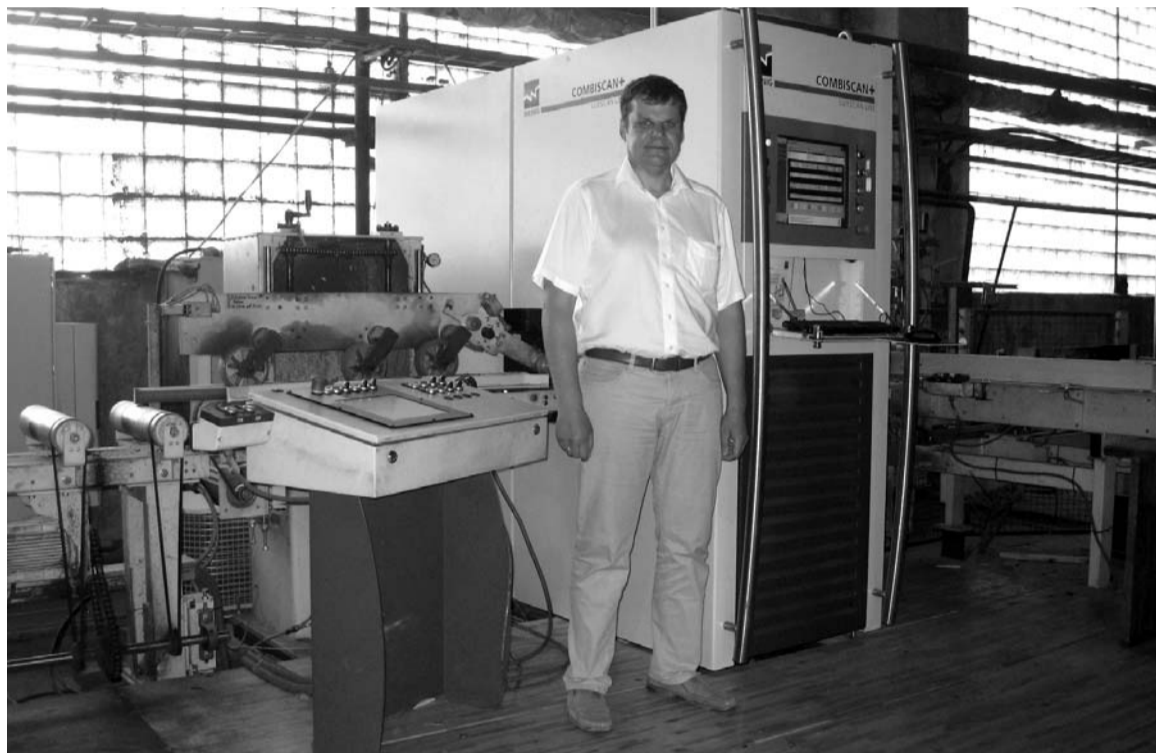
Listišu ražošana ir automatizēta ar jaudīgu Vācijas aparāturu

Dzeņu uzņēmība, centība, uzņēmuma vadīšanas prasme un filozofija liecina, ka Latvijā ir izcilas iespējas izveidot ražošanu ar augstu pievienoto vērtību. Vajadzīga saprātīga rīcība. Uzņēmumā