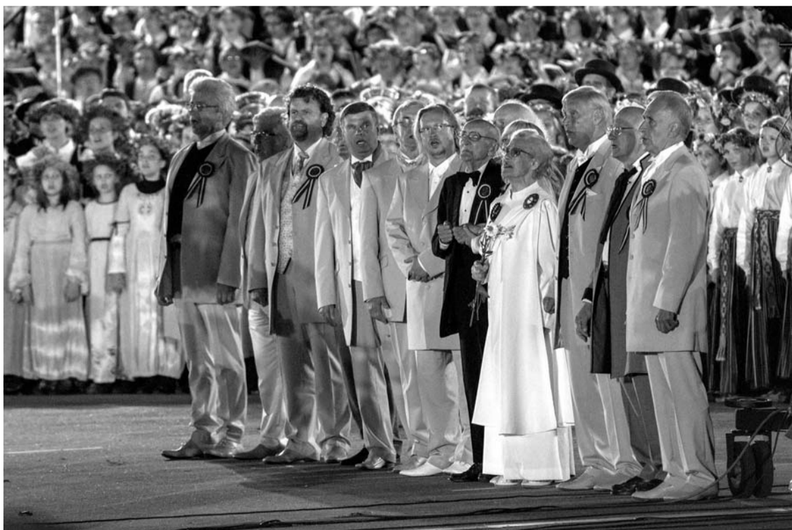
Mūzicē Juris Ķeniņš