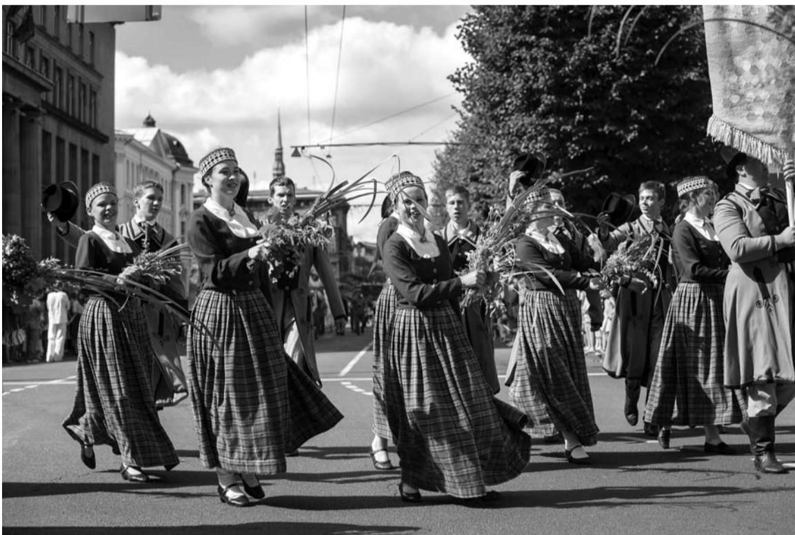
Vidzemnieces svētku gājienā

par spēju pacelties pāri ikdienas grūtībām un svinēt brīvi, atraisīti un skaisti.