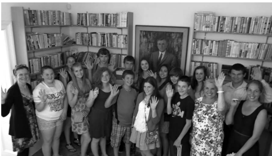
Uz tikšanos Laika slejās!