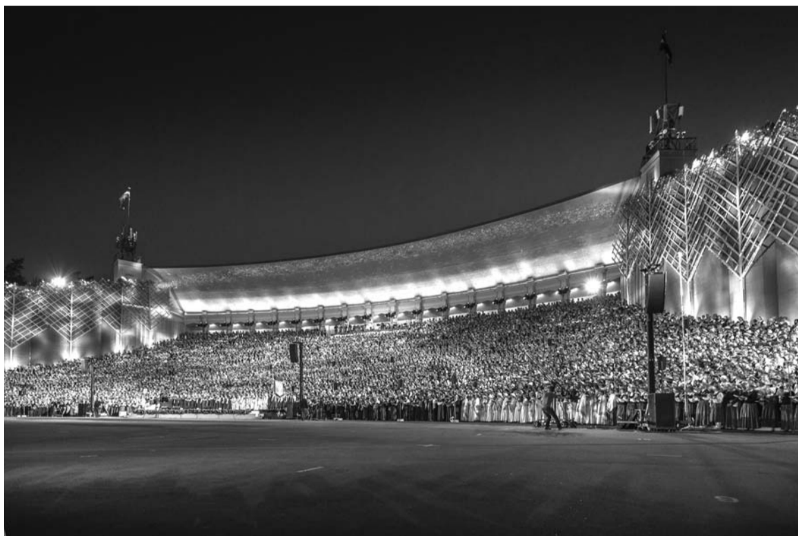
Svētku koncerta beigās visa estrāde atmirzēja sidrabā

tūkstoši deju tautas, bet tribīnēs – 5 tūkstoši skatītāju. Ir tikpat kā neiespējami iztēloties, ka vienā laukumā vienlaikus dejojā šie 14 tūkstoši, kas pārstāv 603 deju kopas, taču, kad to saredzi savām acīm, nāk sapratne, ka acīm redzamais ir brīnumdarbs. Augstas raudzes choreografu, deju svētku virsvadītāju, viņu palīgu un ansambļu vadītāju ilgu gadu rūpīgs un mērķtiecīgs darbs vainagojies ar neapraķstāmi skaistu, iedvesmojošu rezultātu.