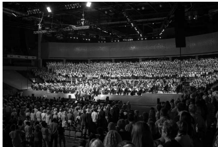
Vokāli simfoniskā koncerta kopskats