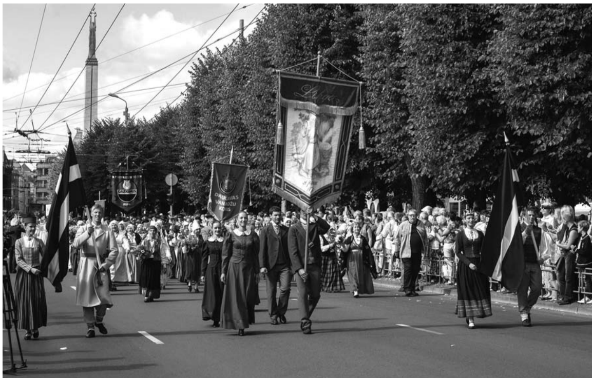
Dziesmu un deju svētku karogi Brīvības ielā

Skaistai teiksmi līdzīga, bezgala svinīga un krāšņa bija svētku atklāšanas ceremonija svētdienas – 30. jūnija vakarā Dziesmu svētku parkā. Taču tas bija tikai pirmais akords, katrs nākamais radīja atkal jaunas emocijas, kuņū kopumā sajaukts gan lepnums un apbrīna par tautas talantiem vai, citiem vārdiem, – par mūsu talantīgo tautu, gan prieks par izdošanos,