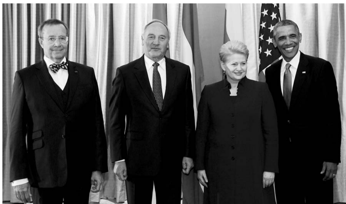
No kreisās: Igaunijas prezidents Tomass Hendriks Ilvess, Latvijas prezidents Andris Bērziņš, Lietuvas prezidente Daļa Gribauskaitė un ASV prezidents Baraks Obama

Savā uzrunā Obama uzsvēra: „Mēs būsim stingri un vienoti šī brīža pārbaudījuma priekšā. Mēs aizstāvēsim savas NATO sabiedrotās, un tas nozīmē ikvienu sabiedroto. NATO līguma piektais pants, kas noteic, ka uzbrukums vienai alianses dalībvalstij ir uzskatāms par uzbrukumu visai aliansei, ir nelokāms. NATO nav vērstā pret citām valstīm, un trīs Baltijas valstis – Igaunija, Lietuva un Latvija – nav „postpadomju ter-