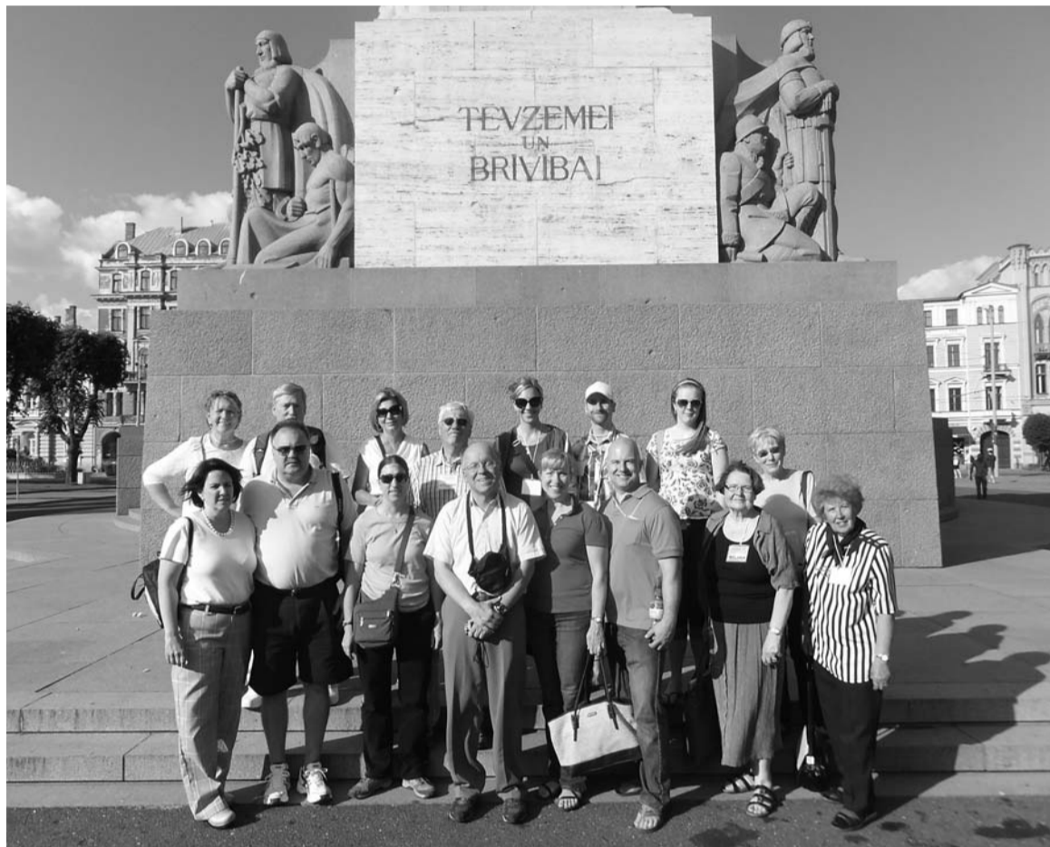
Ceļotāju grupa pie Brīvības pieminekļa