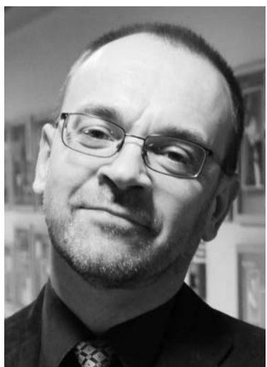
Komponists Richards Dubra

mēģinājumus. No pelniem tas izveidos dārgakmeni.