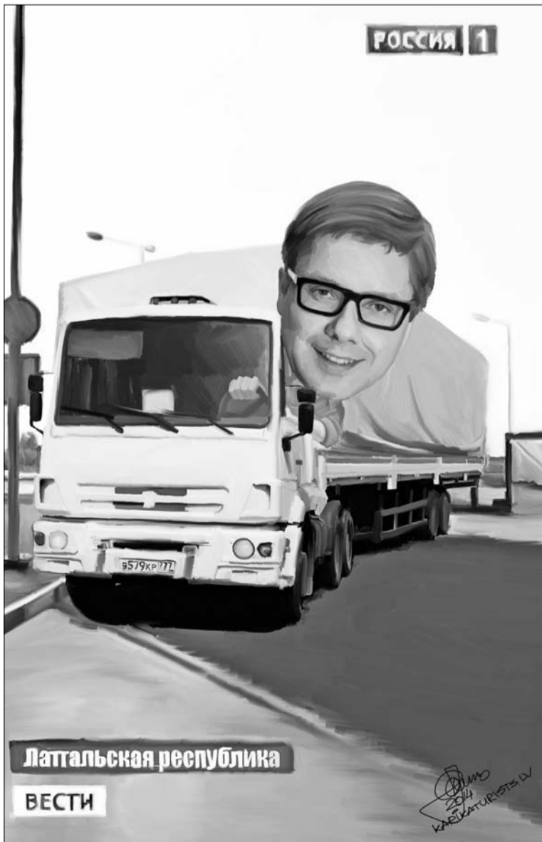
„Ušakovs atgriežas no Maskavas” // Zīmējums: Zemguss Zaharāns