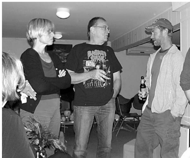
ALMA mākslinieki diskusijā