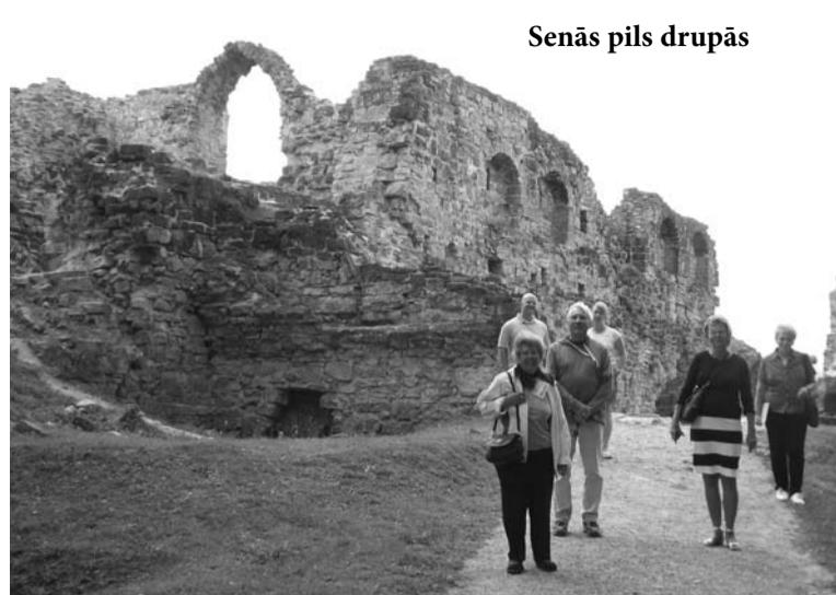
Senās pils drupās