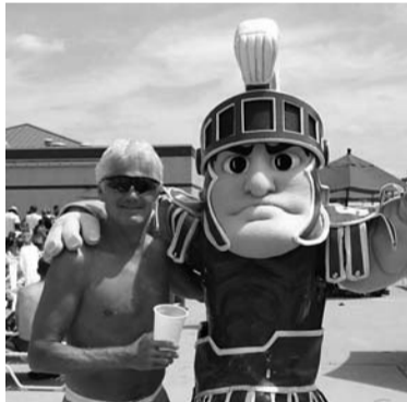
Kopā ar turnīra talismanu