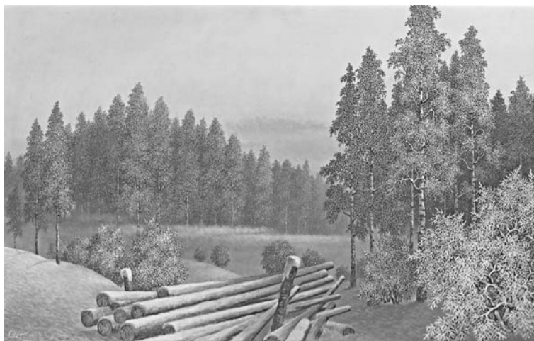
Oto Kampe (Austrālija). ZIEMAS SONĀTE. 1984

Uz drīzu un jauku redzēšanos Katskiļos no 26. līdz 28. septembrim!