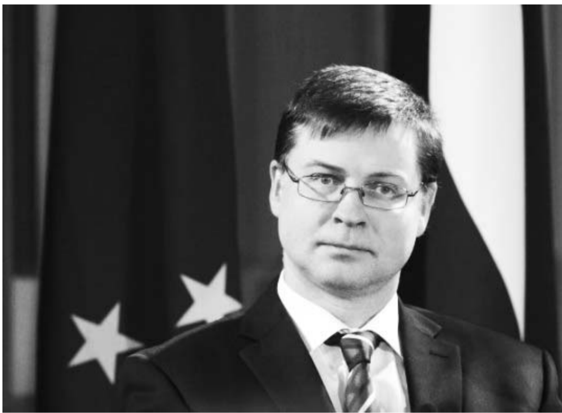
Valdis Dombrovskis, tiekoties ar Latvijas žurnālistiem Briselē, pie Eiropas parlamenta ēkas

Drīz pēc amatu sadalījuma publiskošanas, tiekoties ar Latvijas žurnālistu grupu – ap 20 avižu, radio un TV korespondentiem, kuŗu vidū bija arī Laika un Brīvās Latvijas redaktore, Valdis Dombrovskis sacīja: “Junkera kunga piedāvātais Eiropas Komisijas viceprezidenta amats ir gan liels gods, gan arī liela atbildība. Šajā darbā būs jārisina jautājumi, kas ir vistiešāk saistīti ar finanču stabilitāti un ekonomikas izaugsmi. Nākamajos piecos gados būtiskākais ir nodrošināt ilgtspējīgu ekonomikas izaugsmi un jaunu darbavietu radīšanu. Jānovērš riska faktori, kas var ievirzīt Eiropas ekonomiku ilgstošā ļoti lēnas izaugsmes un pat stagnācijas scenārijā. Atslēgas vārds ir konkurētspēja, kas aktuāla visām dalībvalstīm, tostarp Latvijai, kas daudz paveikusi tautsaimniecības pārstrukturēšanā pēdējos gados un vairākās pozīcijās uzrāda straujāko izaugsmi ES. Ir jāstiprina gan visas Eiropas savienības, gan arī atsevišķu valstu konkurētspēja. Jāstiprina ES iekšējais tirgus, jāīsteno nepieciešamās strukturālās reformas ES dalībvalstīs. Svarīgi ir arī nodrošināt, lai ekonomiskās izaugsmes augļus sajustu visi ES iedzīvotāji, mazinot ienākumu nevienlīdzību starp ES dalībvalstīm, kā arī pašās dalībvalstīs. Esmu gatavs risināt šos jautājumus, strādājot ciešā kon-