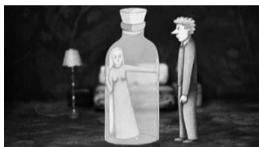
Skats no filmas

ASV Kinoakadēmijas balvas Oskars nominācijai par labāko ārzemju filmu ( Best Foreign Language Film Award ) pēc Nacionālā