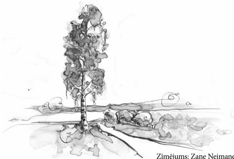
Zīmējums: Zane Neimane

Baibas māte jaunlaulātajiem jau bija uzklājusi baltiem palagiem uz platā divāna gultu. Uz šī divāna Imants bija pārnakšņojis dažu labu reizi, Baiba, atvadoties un