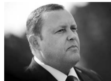
Grieķijas un Itālijas. Richards Kozlovskis

Latvija ir ieinteresēta uzņemt bēgļu ģimenes, nevis atsevišķus bēgļus, intervijā Latvijas Televīzijas raidījumam 900 sekundes teica iekšlietu ministrs Richards Kozlovskis ( Vienotība ). Ko ar bēgļiem darīt šogad, Eiropas Savienība daudz maz vienojusies. Par nākamā gadu skaidrības nav. Ministrs informēja, ka šobrīd panākta vienošanās, ka no 250 bēgļiem, kuŗus uzņems Latvija, 50 būs no trešajām valstīm, bet pārējie no