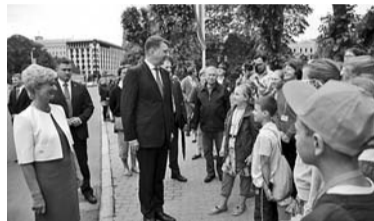
Valsts prezidents Raimonds Vējonis sarunā ar iedzīvotājiem

Valsts prezidents Raimonds Vējonis pirmajā reģionālajā vizītē devās uz Latgali. Kā pirmo pilsētu prezidents apmeklēja Krāslavu. Ierodoties savā pirmajā reģionālajā vizītē, Vējonis pagodināja visus klātesošos. Sadarbība ar Krāslavu bija ilgstoša vēl aizsardzības ministra amatā. Prezidents uzsvēra, ka Krāslavā sākas ne tikai Latvija, bet arī Eiropas Savienība, un aicināja visus turpināt strādāt šajā virzienā un veicināt valsts ekonomisko attīstību.