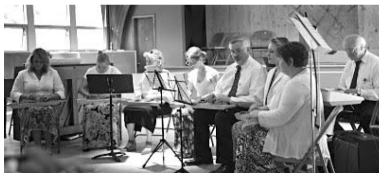
Koklētāju ansamblis koncertē