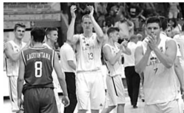
Latvijas U-20 basketbolisti

Latvijas U-20 izlases basketbolisti Eiropas meistarsacīkstēs ceturtdaļfinālā Italijā ar 58:72 zaudēja Turcijas līdzaudžiem un turnīra turpinājumā pretendēja uz piekto vietu. Lai gan vienības sastāvā nebija vadošo spēlētāju Kristapa Porziņģa un Anžeja Pasečņika, izdevās ar 77:66 (14:17, 14:18, 27:11, 22:20) pārspēt Čehijas vienību, un piektā vietā bija rokā.