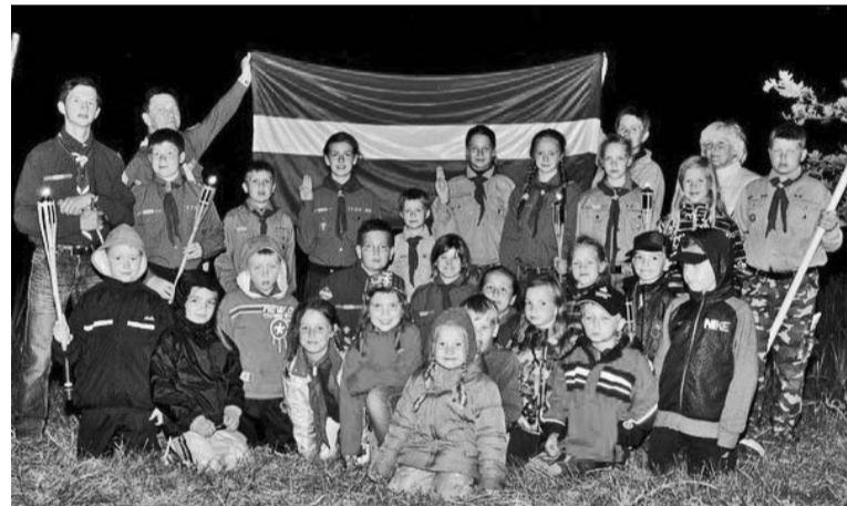
Kocēnu 38. skautu vienība džamborejā

No 14. līdz 19. jūlijam Tagametsā – tradicionālajā Igaunijas skautu un gaidu parkā – norisinājās Baltijas olimpiskā skautu un gaidu džamboreja (lielā noņemne), kur pulcējās vairāk nekā 600 skautu un gaidu no Latvijas, Lietuvas, Igaunijas, Ungārijas, Somijas, Zviedrijas, kā arī no Honkongas, Austrijas un Beļģijas. No Latvijas uz Igauniju šogad bija devušies 73 dalībnieki no Rīgas, Valmieras, Kocēniem, Ogres, Ķeguma, Tukuma un Dobele.