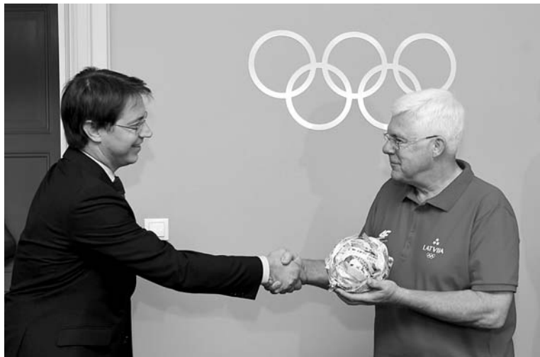
Sveicienu kamolu saņem LOK prezidents Aldons Vrubļevskis