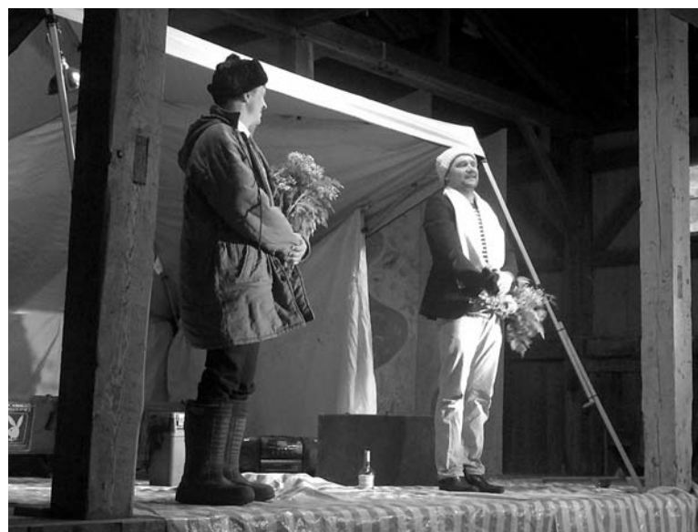
Pēc izrādes

notika dievkalpojums Piesaulē baznīcā. To vadīja prāvests Juris Cālītis. No laika zoba cietušajām ērģelēm labākās skaņas izvilināja Ilona Kudiņa. Bija iepriecinoši liels dievlūdēju skaits. Īeskanējās arī Piesaulē zvans, no sava zvanu torņa aicinot apmeklēt pirms piecdesmit deviņiem gadiem jauniešu celto Piesaulē dievnamu. Daži vārdi par Piesaulē lielo šķūni un skatuvi. Skatuve ir ar pietiekamu pacēlumu un dziļu-