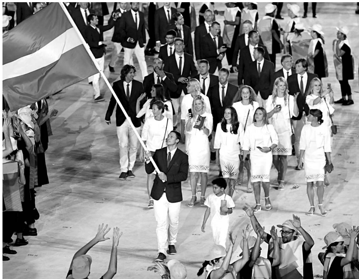
Latvijas olimpisko delegāciju Maracana stadionā ievē divkārtējais olimpiskais čempions BMX riteņbraukšanā Māris Štrombergs

(Par citām Olimpisko spēļu sacensībām lasiet 17., 20. lpp.)