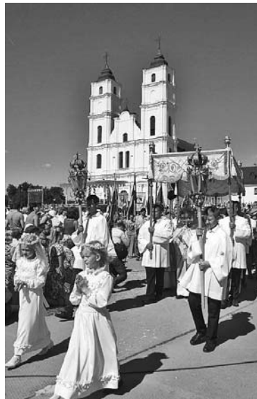
Daudzi kristieši Vissvētākās Jaunavas Marijas Debesīs uzņemšanas svētkos gūst mieru dvēselei un Dieva svētību