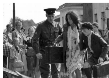
Aina no filmas