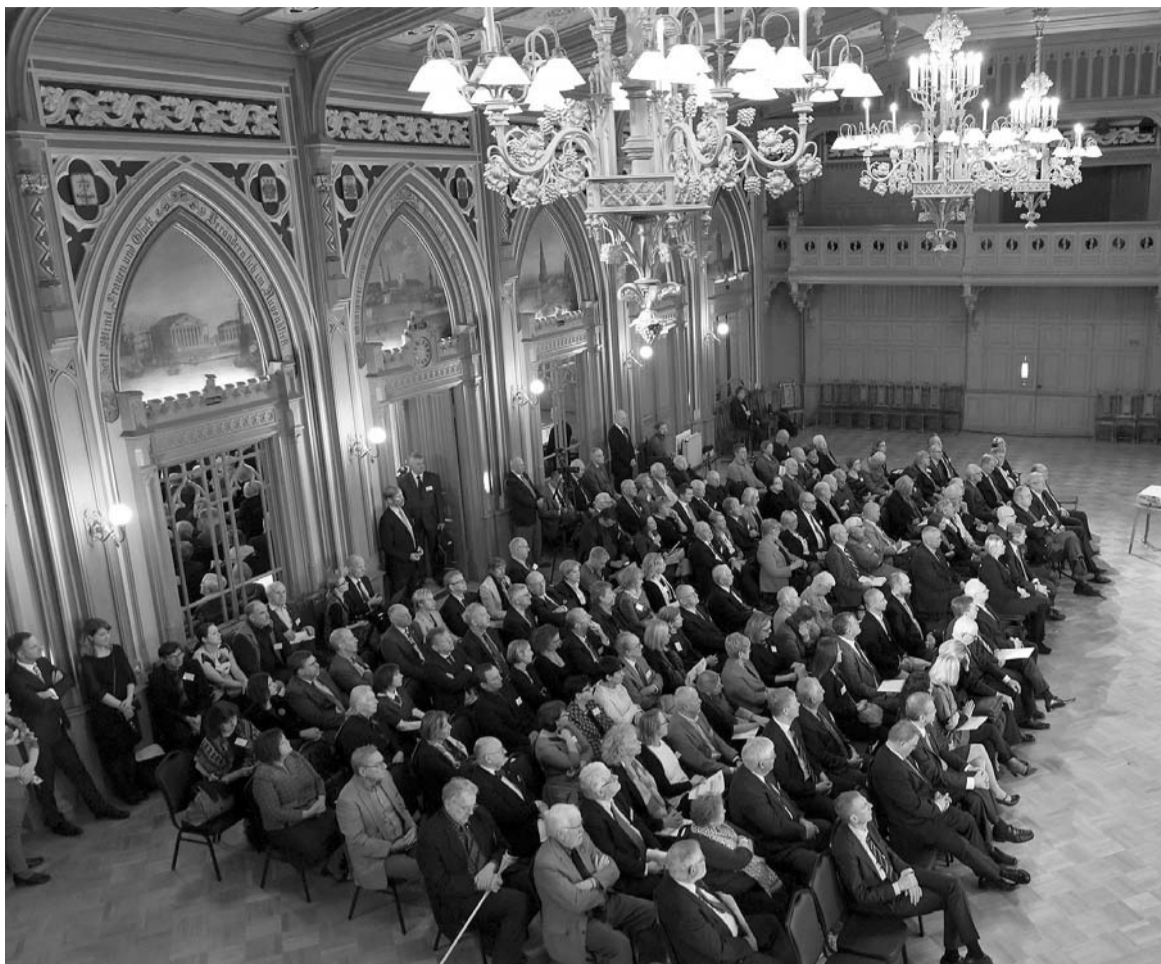
PBLA konferences dalībnieki Mazajā ģildē