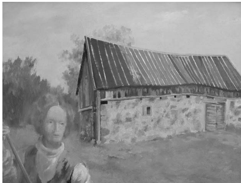
Pie vecās ēkas. 2016

Kā savulaik ofortos, arī gleznās Lolita Zikmane rāda šķietami gluži parastas lietas vai ikdienišķus notikumus: pavasara iestāšanos parkā, koku