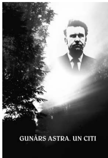
GUNĀRS ASTRA. UN CITI

es jūtos tad, kad man veikalā, iestādē, transporta līdzekli vai citā Latvijas sabiedriskā vietā jāsadurās ik uz soļa ar augstprātīgu, šovinistisku attieksmi pret manu valodu.”