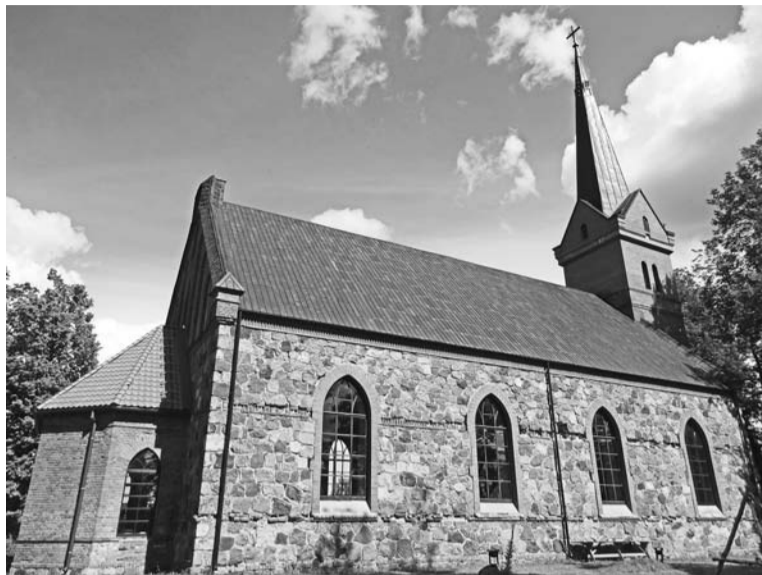
Dievnamu vidū – ciems apkārt. Neogotikas arhitektūras stilā būvētā Ropažu ev. lut. baznīca. Celta 1893. gadā pēc Gotfrīda Krona projekta

Vispirms mājdzīvnieks ieinteresēti apstāigāja solu rindas, apskatot, kas tie ir par ļaudīm, kuŗi ieradusies uz dievkalpojumu. Pēc tam minka cienīgā gaitā aizgāja līdz altārim, arī tur visu apskatot, un visbeidzot apgūlās kādā kļūšākā stūrītī, visu laiku uzmanības centrā paturot savu saimnieci. Iespējams, šo rindu lasītājs būs izbrīnījies: sak, kas tie par jokiem!