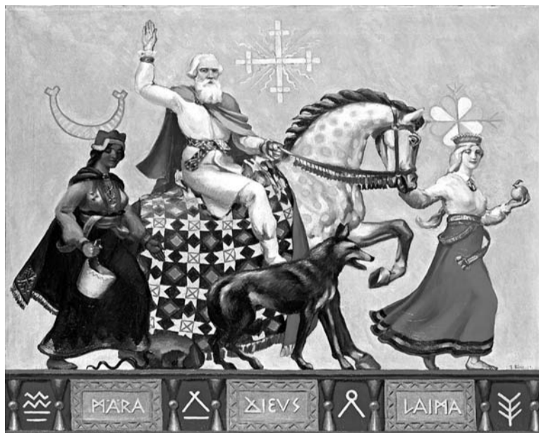
JĒKABS BĪNE. Dievs, Māra, Laima. 1931.g.