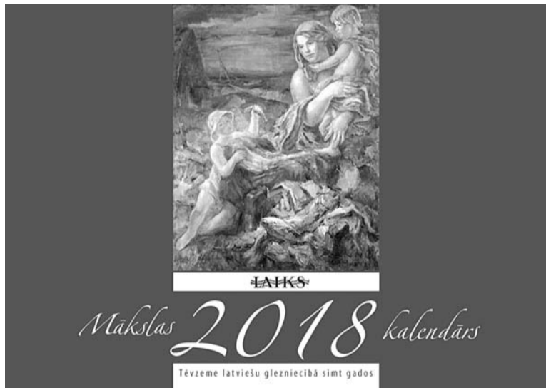
AUGUSTS ANNUS. Bērniņa. 1939. gads

Kalendārus var iegādāties par USD 19,- plūs pasta izdevumi, rakstot čeku uz "Laiks" Inc. 114 4th Ave NW, Largo, FL33770