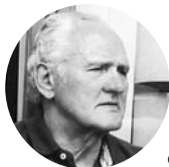
JĀNIS BOLIS, ceļotājs, rakstnieks, advokāts