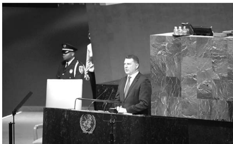
Raimonds Vējonis runā ANO Ģenerālajā Asamblejā

nājumiem, ar kuriem pasaule saskaras. Valsts prezidents ir pārliecināts, ka ANO jāsauglabā, bet dažos gadījumos pat jāatgūst pilsoņu un dalībvalstu uzticība tās spējai novērst un reaģēt uz krīzēm, kā arī veicināt uz noteikumiem balstītu pasaules kārtību. „Jaunais ANO ģenerālsekretārs Antoniu Gutērrešs tika ievēlēts pārmaiņu laikā. Latvija atzinīgi vērtē viņa iecelšanu un pilnībā atbalsta viņa redzējumu par efektīvāku ANO. Reformas nekad nav viegls uzdevums, taču ar pacietību, skaidri noteiktiem mērķiem un ANO sistēmas un dalībvalstu savstarpēju sadarbību tas ir iespējams. Mēs pilnībā atbal-