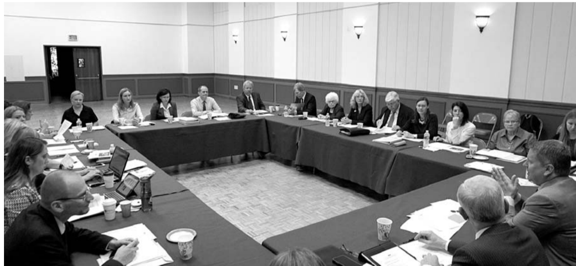
ALAs valde 16. septembra valdes sēdē (kopskats)