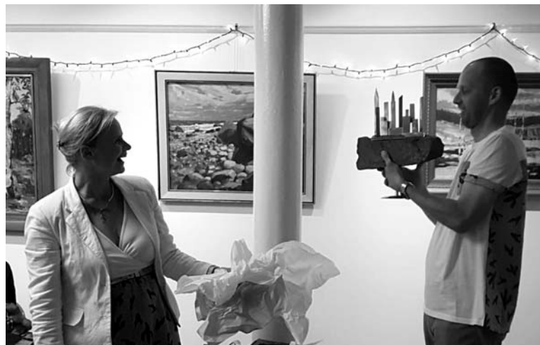
Mažeiku pāris saņem tautiešu pateicības dāvanas

valsts amatpersonai par labi un vairāk nekā labi paveiktu darbu Latvijas labā. Šādi pateicības sarīkojumi nav ierasti Latvijā, un Mažeiku ģimene var droši justies