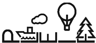
2018. gada 28.–29. jūnijs | Valmiera, Latvija

E. Rinkēvičs izteica pateicību Pasaules Brīvo latviešu apvienībai par tās iniciatīvu pirms pieciem gadiem uzsākt šādu forumu ciklu, lai piesaistītu Latvijas diasporas uzņēmējus tautsaimniecības attīstībā Latvijā. Arī pilsētas galva