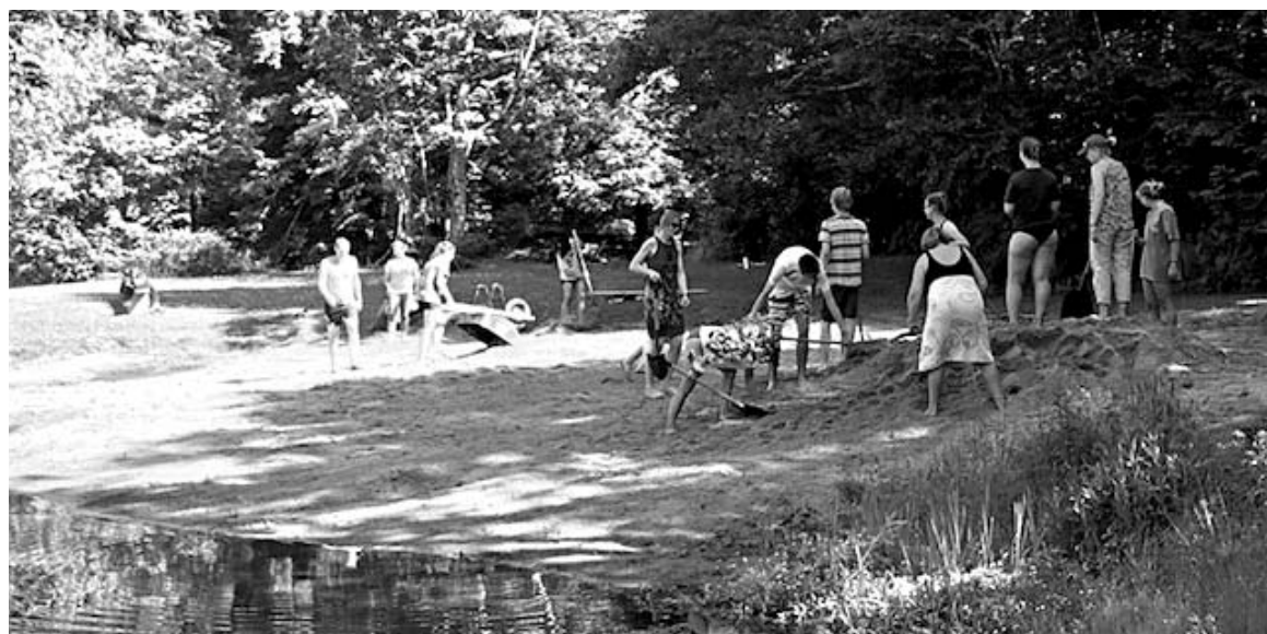
Plūdmales uzbēršana un izlīdzināšana