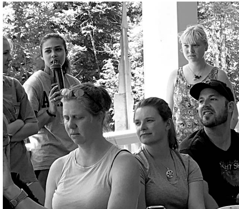
Darbinieki un brīvprātīgie pirmsdarbu sarunās