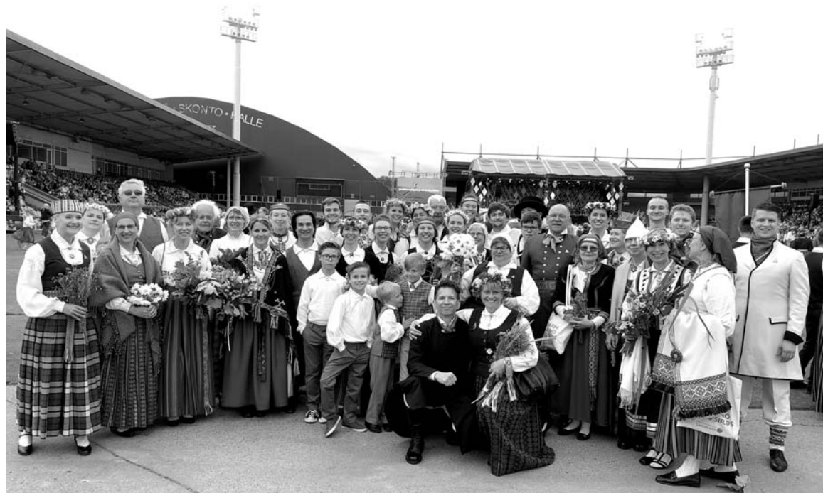
Ņujorkas latviešu kori Skonto stadionā 2018. gada vasarā Dziesmu svētkos