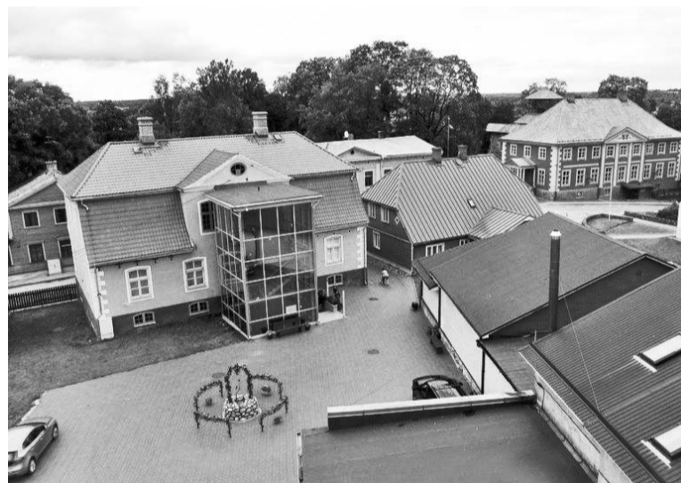
Dzīvā sudraba muzejs