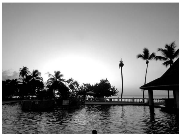
Saulriets Lielajā Kurzemes līcī