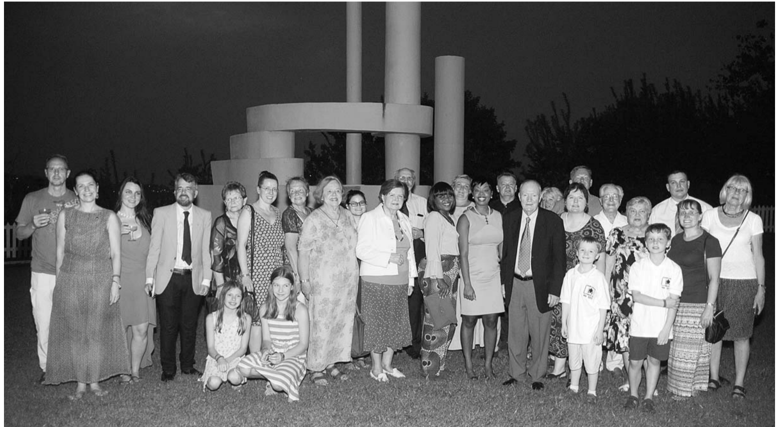
Salidojuma dalībnieki sagaida Jauno gadu pie Lielā Kurzemes pieminēkļa

ceļš atkal veda cauri Tobāgo centrālajai kalnu joslai, šoreiz pa visvecāko mežu rezervātu Amerikā (dib.1776.g.) uz salas ziemeļaustrumu galu un patālo Šarlot-