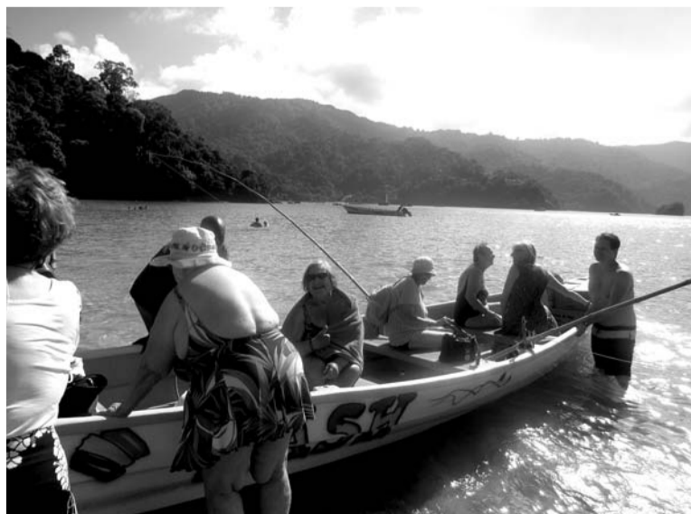
Dodamies kārtējā laivu braucienā

saņemdam velti, sacīja dažus vārdus par sevi. Par latviešu trešo Ziemsvētku dāvanām bija rūpējies TNT (Trinidadas un Tobāgo) Ziemsvētku vecītis, kas, parasti