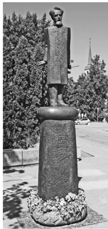
Piemineklis Latvijas Republikas himnas melodijas un vārdu autoram Baumaņu Kārlim