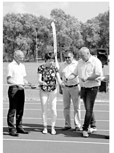
Sporta ziņas sakopojis P. KARLSONS

Ventspils novada Piltēnē atklāts stadions. Tā pārbūve uzsākta 2017. gada maijā, pabeigta 2018. gada maijā. Stadionā ir četri 400 metru celiņi, 110 metru taisnē – seši celiņi, atjaunotajā objektā ir dabīgā zaļiena futbola laukums, lodes grūšanas, diska un vesera mešanas sektors, ir iespēja nodarboties ar kārtslēkšanu, augstlēkšanu un tāllēkšanu, mest šķēpu un organizēt kavēkļu skrējienus.