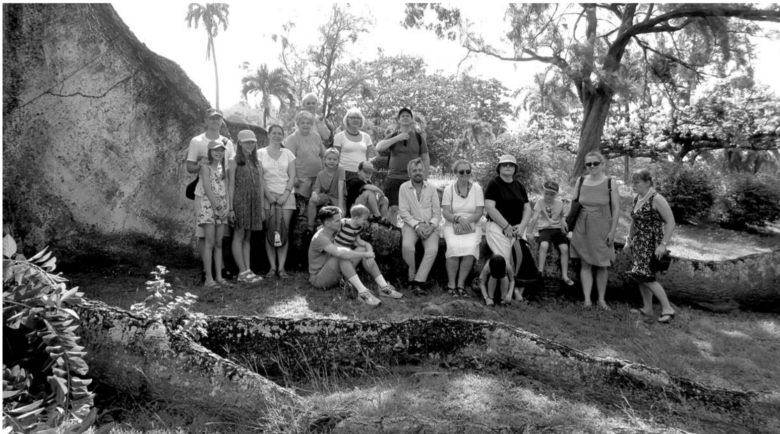
Salidojuma dalībnieki Botāniskajā dārzā pie senā "zida kokvilnas" koka saknēm