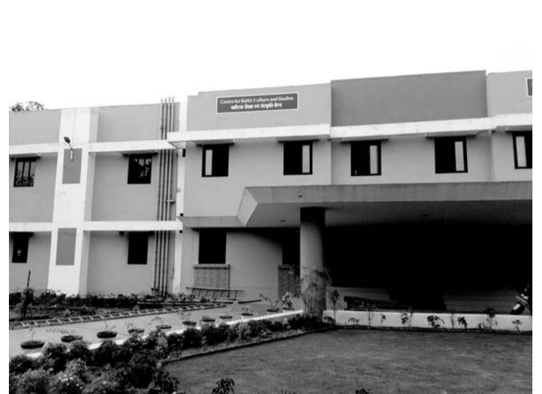
Jaunais Baltijas centra nams Dev Sanskriti Universitātē

Pirmkārt, šī universitāte ir ar īpaši holistisku ievirzi. Šajā universitātē studentiem ir skaidrs un viņiem tas tiek arī mācīts, ka mums ir ārkārtīgi izteikta lingvistiskā radniecība, jo lietuviešu