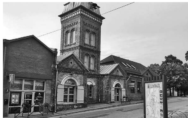
Vecais ugunsdzēsēju depo Limbažos pārtapis par tūrisma un informācijas centru