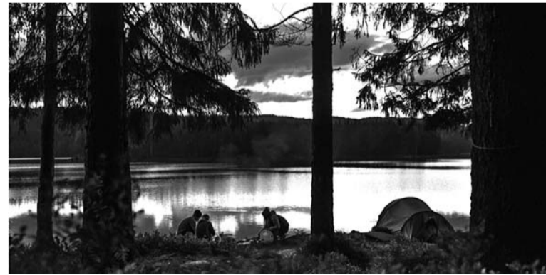
Pie Burtnieku ezera

Burtnieku novada Matīšos no- tika nometne bērniem no dažā- dām zemēm, lai sniegtu viņiem plašākas zināšanas ar latviešu kultūru, tradīcijām un stiprinātu latviešu valodas prasmi. Šai no- metnē, piemēram, iepazīstot Lat- vijas kokus un zāles, bērni mā- cās siet zāļu slotiņas. Citā no- darbībā katram ir iespēja izcept savu maizes kukulīti. Kopā ar cit- zemju bērniem ir arī Burtnieku novada biedrības „Pāvilēni” da- lībnieki. Organizatori atzīnusi,