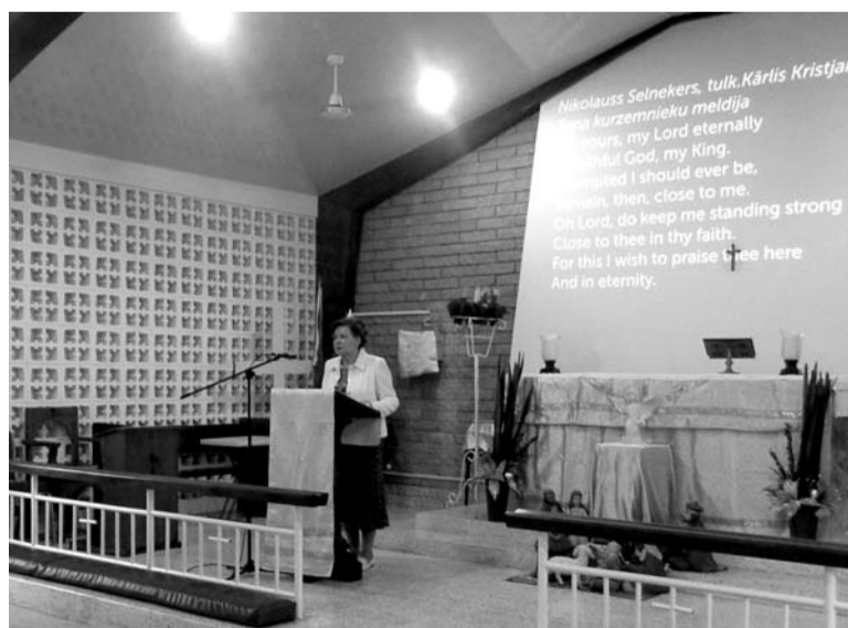
Bijusī Valsts prezidente Vaira Vīķe-Freiberga uzrunā salidojuma dalībniekus un viesus Sv. Dāvida baznīcā