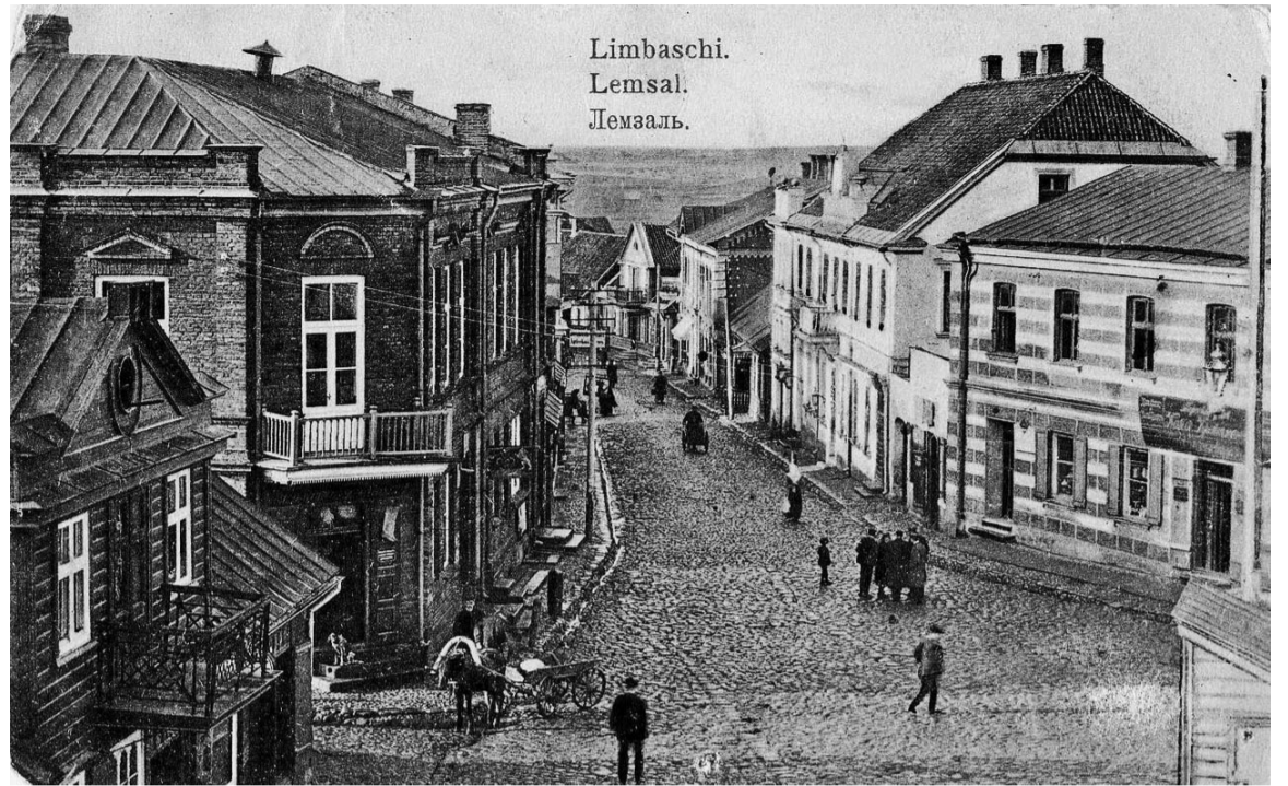
Vēl pirms pāris gadsimtiem Limbaži bija nozīmīgs darījumu un garīgās dzīves centrs