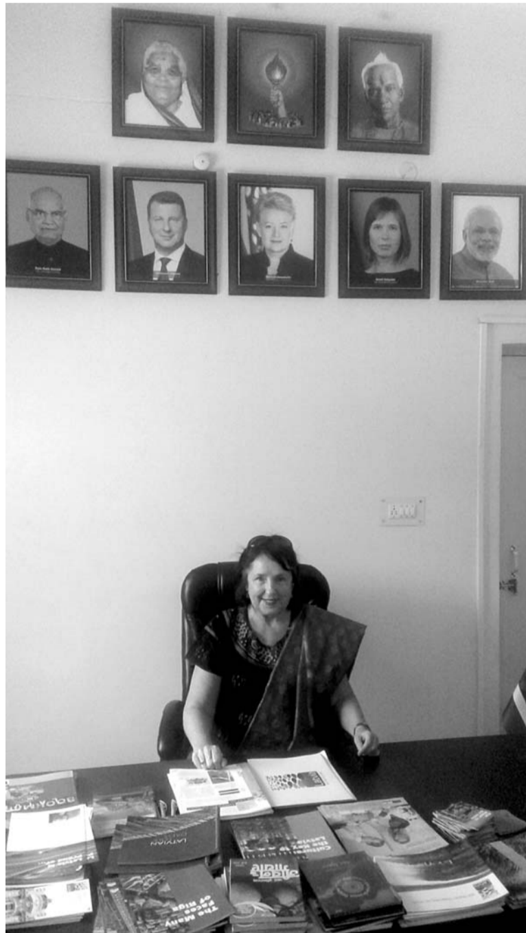
Profesore Sigma Ankrava Baltijas Studiju centrā

Kultūras sakaru uzturēšana ar Baltiju noteikti ir viena no DSVV prioritātēm. Tomēr Baltija