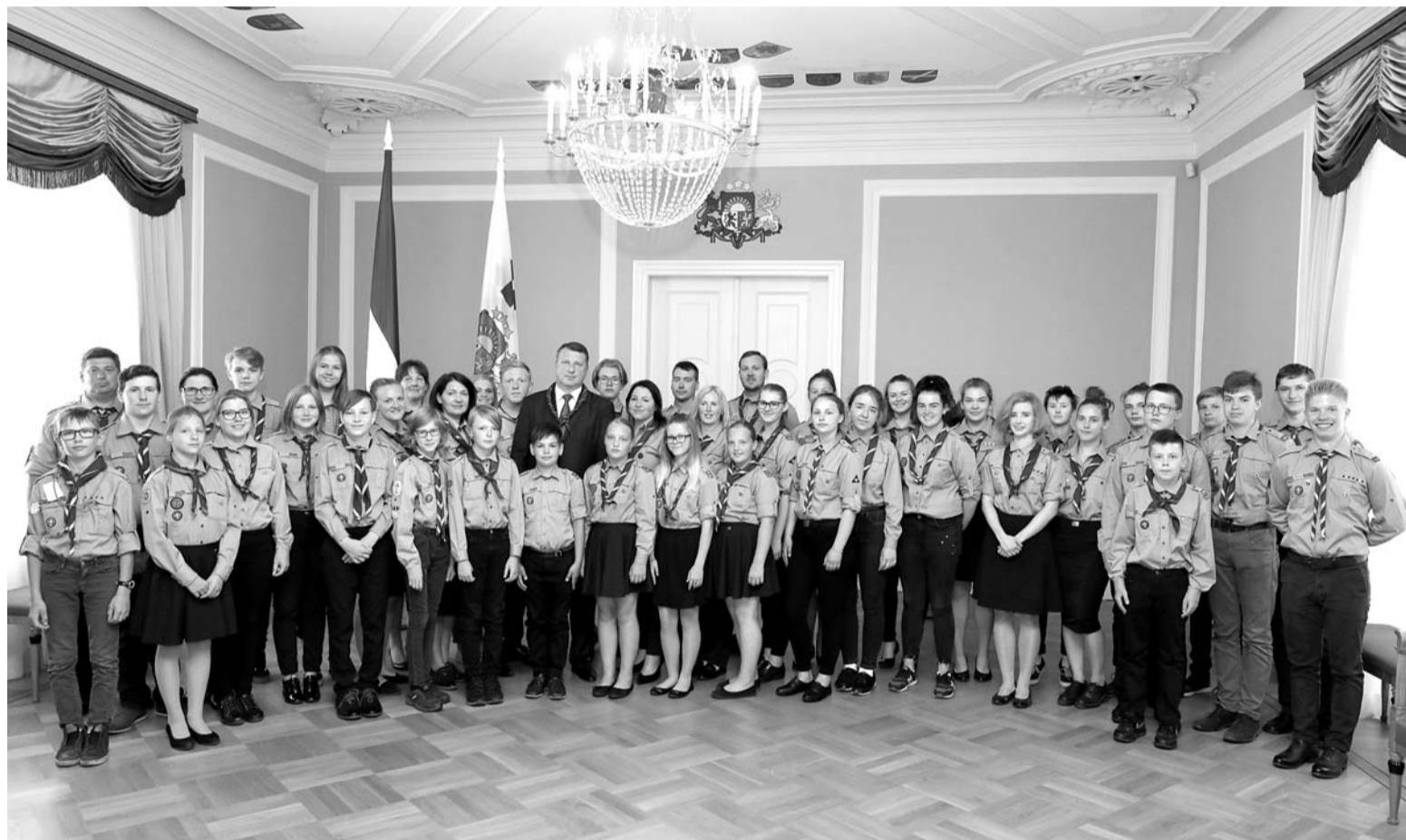
26. jūnijā Rīgas pili uz Valsts prezidenta Raimonda Vējoņa prezidentūras atvadu vizīti tika ielūgti Latvijas Skautu un gaidu centrālās organizācijas vienību pārstāvji. Tā bija iespēja bērniem un jauniešiem pateikt „paldies!” par atsaucību un atbalstu visas prezidentūras laikā

Lai saulainas, pozitīvām emocijām un atmiņā paliekošiem piedzīvojumiem bagāta vasara skautiem un gaidām visā pasaulē!