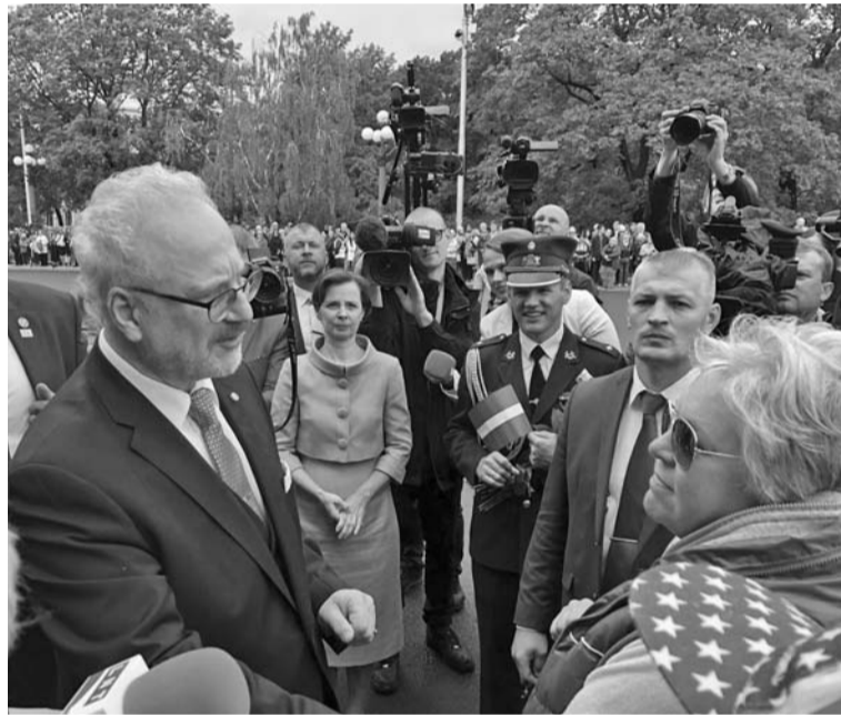
Tiekoties ar tautu pie Brīvības pieminekļa

Abi lietvārdi – Tēvzemei un Brīvībai – ir datīva locījumā. Datīvs atbild uz jautājumu “kam”? Šis datīvs pārvērš šos vārdus no vienkārši konstatējošiem par uzrunājošiem, aicinošiem. Zināmos apstākļos pat par pavēlošiem. Tas prasa aktīvu rīcību, tas pieprasa kaut ko vēltīt. Tātad kaut ko darīt Tēvzemes un Brīvības labā. Šie vārdi vērsas pie mums, uzrunā mūs. Uzrunā mani, jūs, visu Latvijas tautu. Latvijas tauta tiek aicināta vēltīt savas pūles Tēvzemei un Brīvībai. (...)