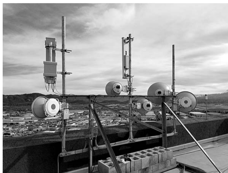
SAF Tehnika radio

Nodrošinām tehnoloģijas datu pārraidei, internetam. Viens liels klientu loks ir televīzijas ziņu studijas. Mēs nodrošinām signāla pārraidi no TV studijas uz apkārtnējo tiklu, kas ļoti daudzus gadījumos notiek ar radioviļņiem. Pašlaik apmēram 70% no