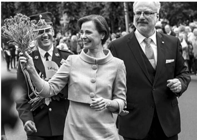
Valsts prezidents Egils Levits un Andra Levita pie Brīvības pieminekļa

Valsts prezidenta amatā stājies Egils Levits