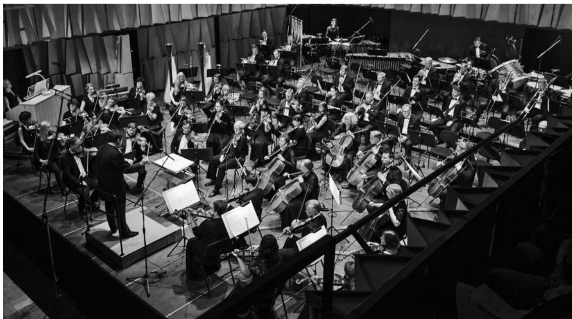
Latvian National Symphony Orchestra

Rakstā izmantoti T. Ķeniņa citāti no žurnāla Mūzikas saule Nr. 2, 2019