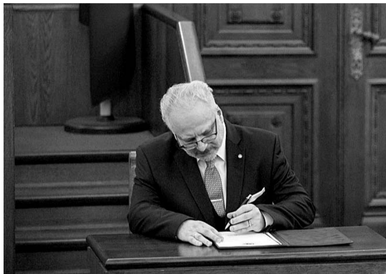
Valsts prezidents Egils Levits paraksta svinīgo solījumu

Jaunais Valsts prezidents Egils Levits, uzņemoties amata pienākumus, 8. jūlijā Saeimas ārkārtas sēdē nodeva svinīgo solījumu.