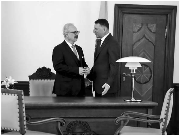
Rīgas pilī jaunajā darba kabinetā

gāks saturs, nekā ikdienā par to pierasts domāt. Mūsu saknes balstās valodā un kultūrā, bet modernajam latviskumam arvien nozīmīgāka kļūst arī nākotnes dimensija. Tur iekļaujas gan mūsu vērtībās balstītā identitāte, gan uz mūsu nākotni vērstās domas, projekti, ideāli.