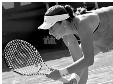
Grūti, bet jāvar

Pēc pirmās dienas Latvija bija iedzīvējos ar 0:2, un nākamais zaudējums dotu ASV uzvaru duelī. Tomēr vispirms Ostapenko ar 6:3, 2:6, 6:2 pārspēja nule kā Austrālijas atklātajā čempionātā triumfējušo Keninu, kurā ir planētas septītā rakete. Vēlāk Anastasija Sevastova ar 7:6 (7:5), 3:6, 7:6 (7:4) uzveica planētas devīto raketi Serēnu Viljamsu, kurā pirmo reizi sava panākumiem bagātajā karjērā cieta zaudējumu Federāciju kausa izcīņas vien-spēlē.