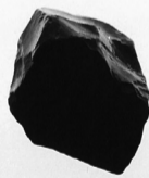
MELNAIS AKMENS, BALTĀS KĀJAS