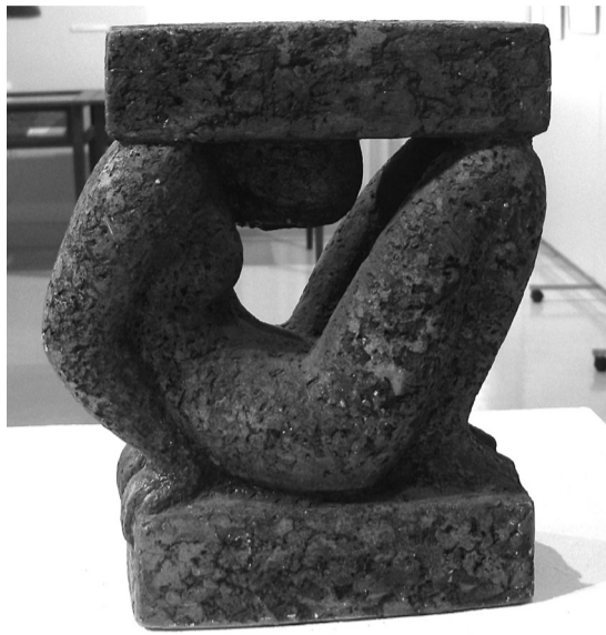
Kariatīde. 1983. gads