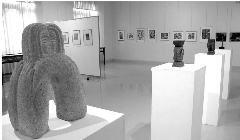
Skats no izstādes

nozīmīgo gadskārtu. Pirmā tika atklāta Valkā pagājušā gada janvārī pāris dienu pirms istās dzimšanas dienas, kad viņš patiesi kļuva 70 gadu vecs (viņš dzimis 1949. gada 28. janvārī) – Valkā pavadīta daļa bērnības un še pabeigta vidusskola. Otrā notika pagājušā gada vasarā, kas bija iekārtota Paula Stradiņa Latvijas