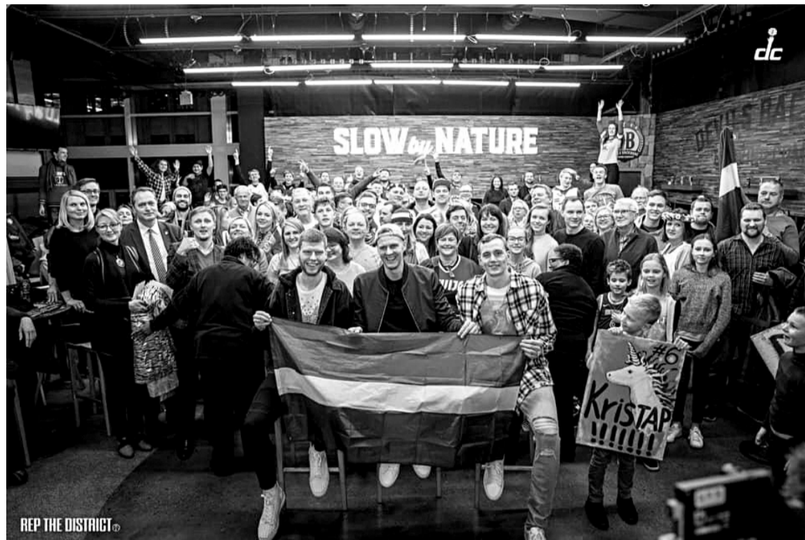
Vēsturiskā fotogrāfija ar latviešu līdzjutējiem

Piektdienas, 7. februāra spēle Vašingtonā nebija tikai sacensības starp Dalasu un Vašingtonu, tas bija pārsteigums, prieka pilns saviesīgs latviešu sabiedrības vakars tālu prom no Latvijas, bet ar lielu lepnumu par Latviju!