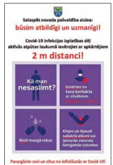
Pasargāsim sevi un citus no inficēšanās ar Covid-19!

Bet ar to būs par maz. Bez jūsu pašu līdzdalības jūsu bērnus pasargāt būs grūti!