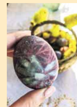
Šī ola vārīta upeņu ievāriņumā. Lai iegūtu dažādas nokrāsas, vispirms piesitprīnāti dažādi ziedīņi.

Olu krāsošanai Lieldienās ir rituāla nozīme, jo senie latvieši to saistīja ar pavasara svētkiem, zemes atmodu pēc ziemas, kā arī ar auglības un atdzimšanas kultu. Olu simbolizē jaunās dzīvības rašanos, tāpēc šajos svētkos tās tiek celtas godā un dažādi izkrāsotas.