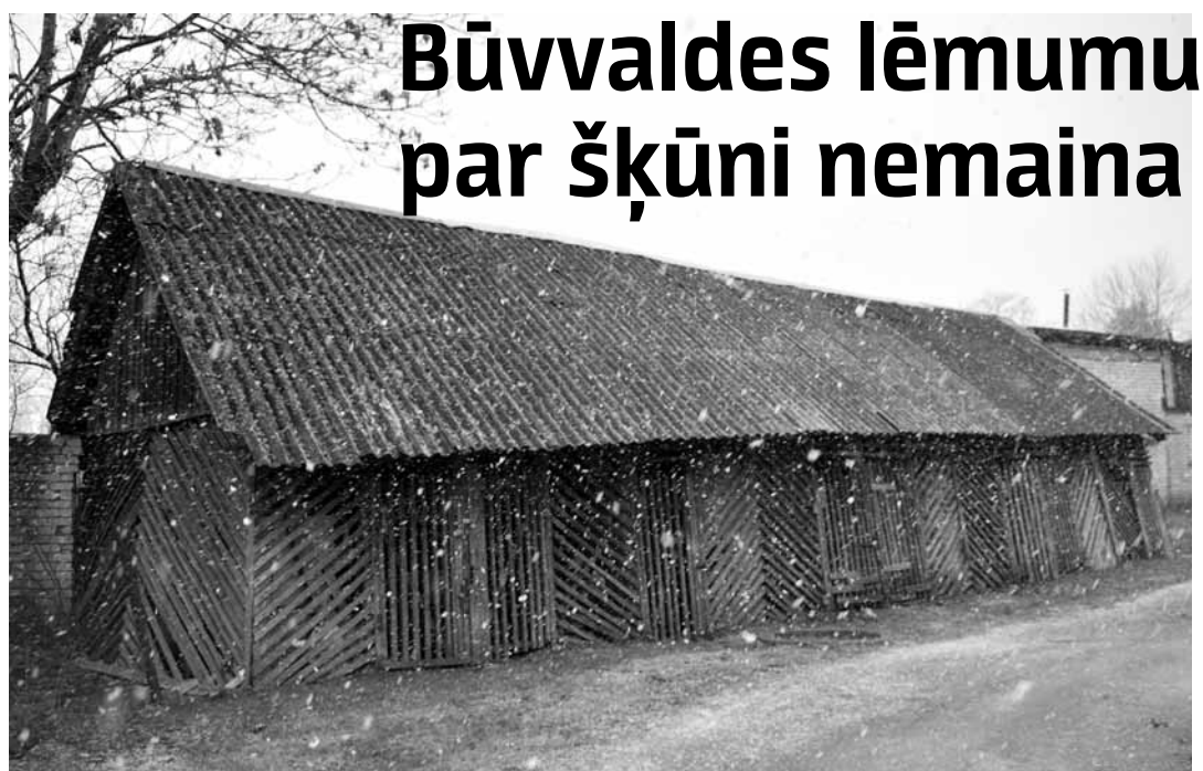
Kuldīgas komunālo pakalpojumu darbinieki Liepājas ielas 18. nama šķūņiem jau nojaukuši divas bistamas piebūves. Par pārējo būs jāvienojas īpašniekiem.

Liepājas ielas 18. nama iedzīvotājiem Kuldīgā līdz nākamā gada 1. maijam jāsakārto vidi degradējošais un apkārtējiem bistamais šķūnis – tā lēmusi novada būvvalde. Pēc tam, kad kāda no īpašniecēm lēmumu pārsūdzēja, novada dome tomēr to atzina par pareizu un likumīgu.