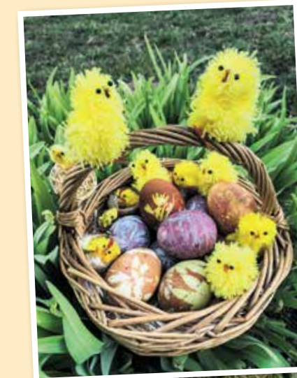
Olas, kas krāsotas ar dažādām metodēm.