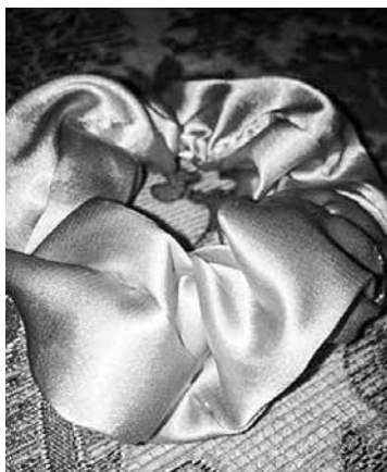
80. un 90. gados meitenes nēsāja šādas matu gumijas, un tās atkal ir modē.

Enija Grēta Filippova un Žaklīna Filippova ir izveidojušas uzņēmumu Scrunchies , kurā šuj matu gumijas.