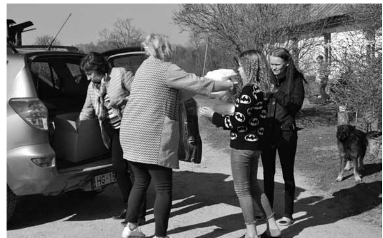
Sudmaļkalnos meitenes iznāk pirmās, tad nāk arī mamma, lai aprunātos ar ēdiena vedējiem.