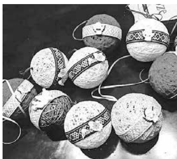
Dekoratīvās bumbas, kas darinātas 18. novembra svētkiem.