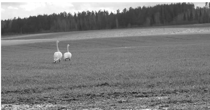
Dabā pavasaris nav atcelts, un valdības noteiktie ierobežojumi arī tiek ievēroti. Lāsma Reimanes teksts un foto