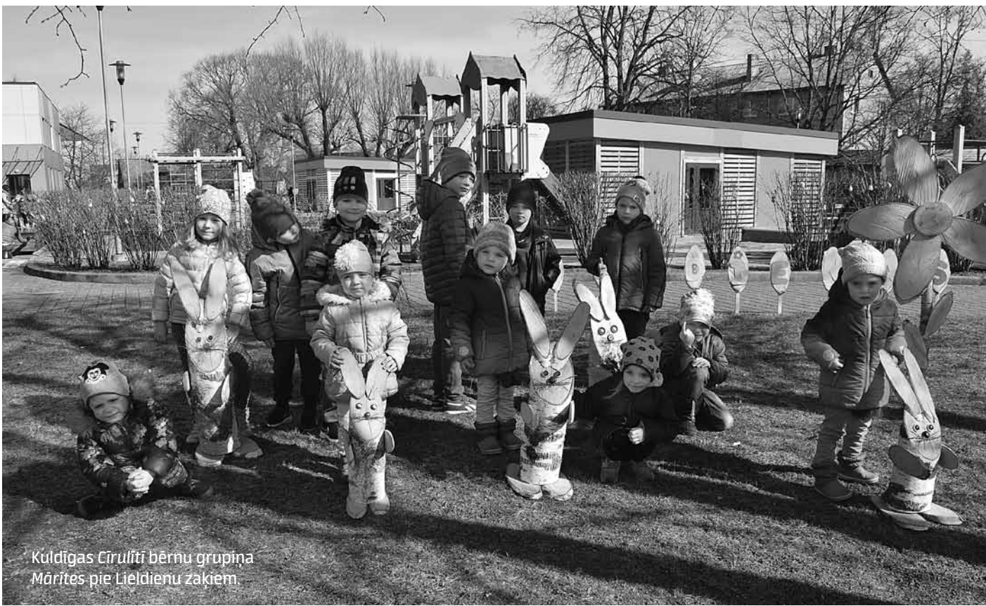
Kuldīgas Cīrulīti bērnu grupiņa Mārites pie Lielienu zaķiem.