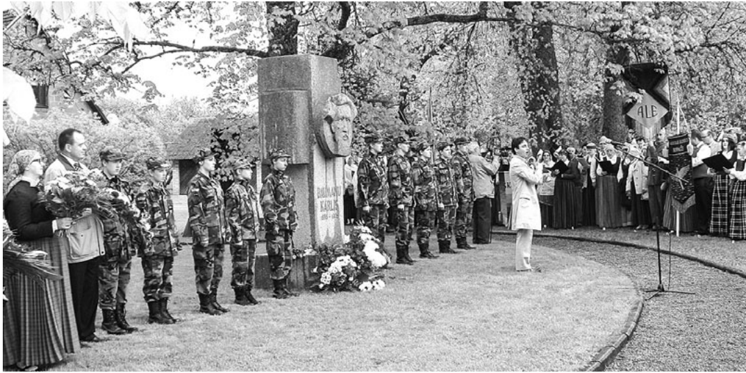
Piemīņas brīdis pie Baumaņu Kārļa pieminekļa 2015. gadā