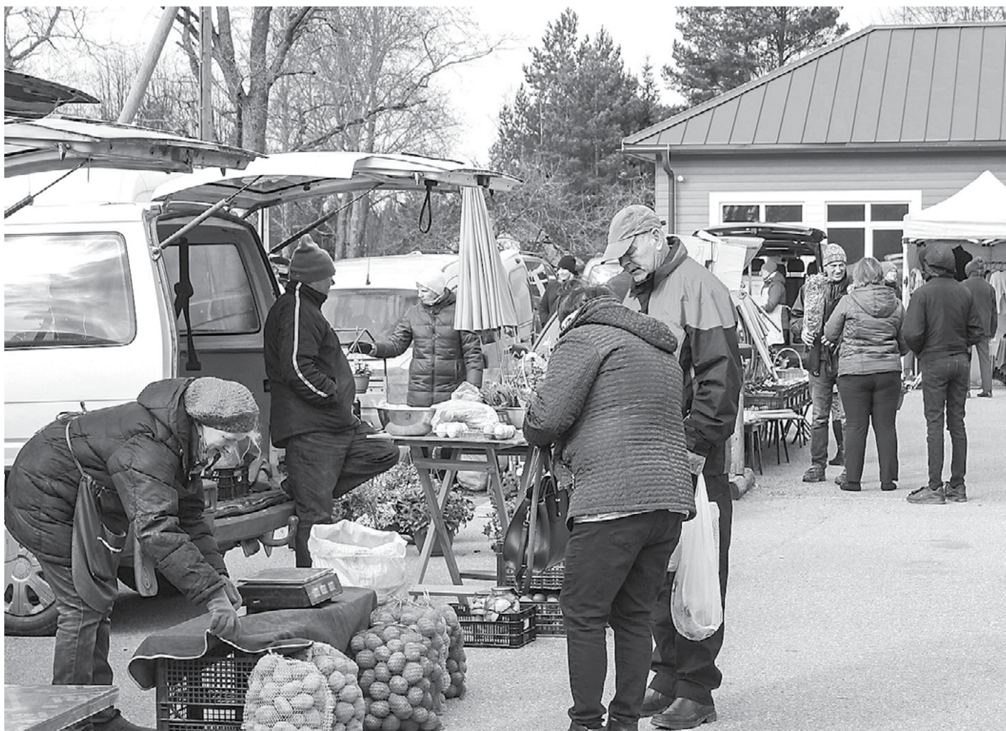
Covid-19 apstākļos drošību tirgū noteic pircēju gatavība distancēties