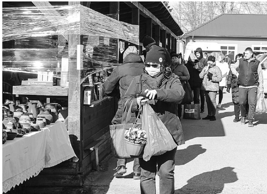
Daļai pircēju ir devīze – nebaidies, bet piesargājies! Tā tomēr ir drošāk

To, ka cilvēki ierobežojumu ievērošanā kļūst nedisciplinētāki kā pirmajās nedēļās,