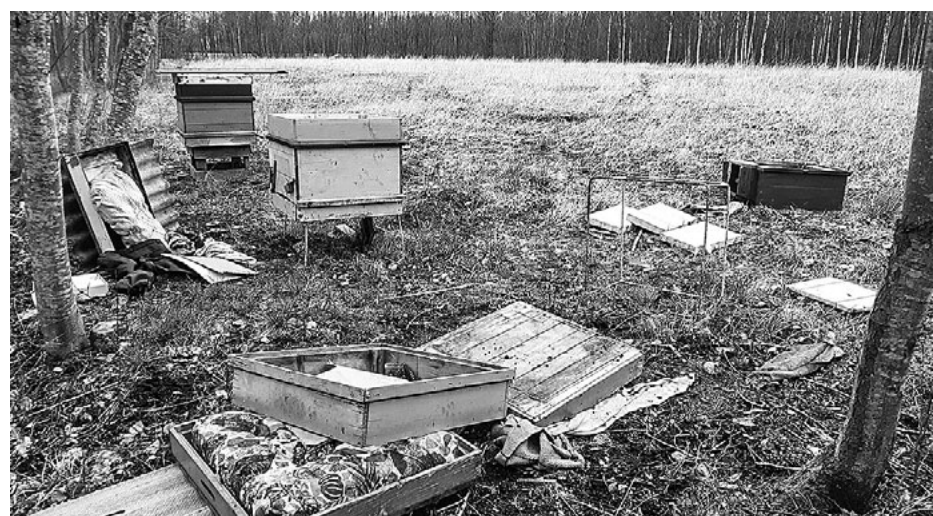
Lāča ciemošanās sekas – sapostīti bišu stropi un saimes – limbažnieka dravā