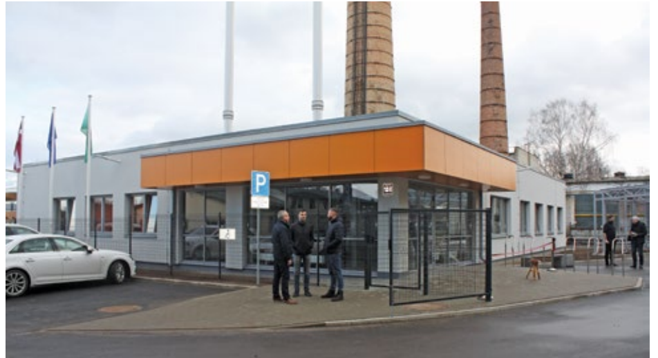
SIA „Babītes siltums” katlumāja Piņķos, Jūrmalas ielā 13E.