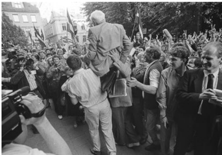
Mavriku Vulfsonu no Jēkaba ielas līdz krastmalai pūlis aiznesa uz rokām.

Vēl 1917. gadā, pirms Latvijas valsts dibināšanas, prezidents Jānis Čakste