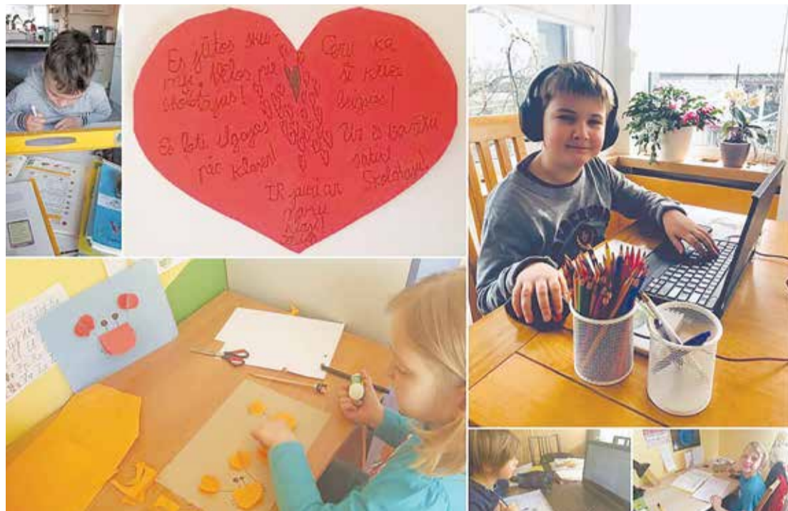
Salaspils 1. vidusskolas skolēni, apgūstot zināšanas attālināti.

Attālinātais mācību process ir izaicinājums visiem – gan skolēniem, gan vecākiem, gan skolotājiem. Tā ir jauna un nebijusi situācija, kurai bija ļoti ātri jāpielāgojas un jāizdomā efektīvāks veids, lai turpinātos mācību process.