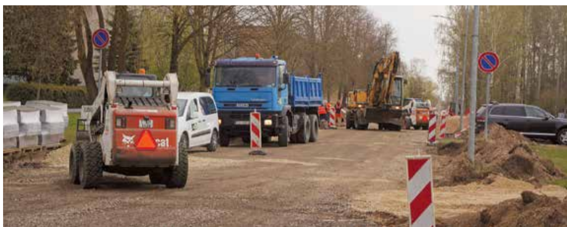
Dienvidu ielas ceļa seguma atjaunošanas darbi noris pilnā sparā.

Ir noslēgušies Salaspils septītās pirmsskolas izglītības iestādes projektēšanas darbi, kas ir svarīgs projekts visam