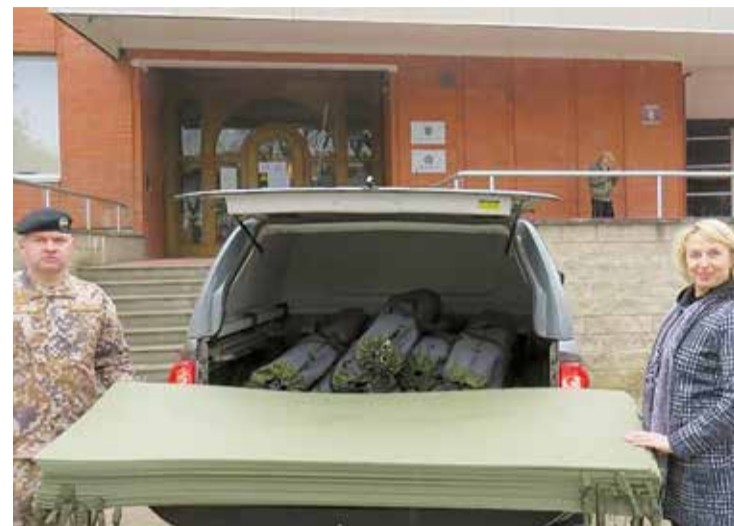
1. Rīgas brigādes 19. kaujas nodrošinājuma bataljona komandieris ar pašvaldības speciālisti darba aizsardzības, ugunsdrošības un civilās aizsardzības jautājumos V. Gorsku.

Viņa gan norāda, ka šobrīd ēkā nav konstatēti inficēšanās gadījumi,