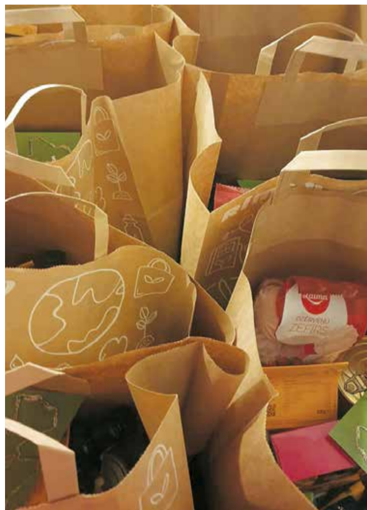
26. aprīlī gardās un vērtīgās pārtikas pakas nonāca pie pirmajiem adresātiem.