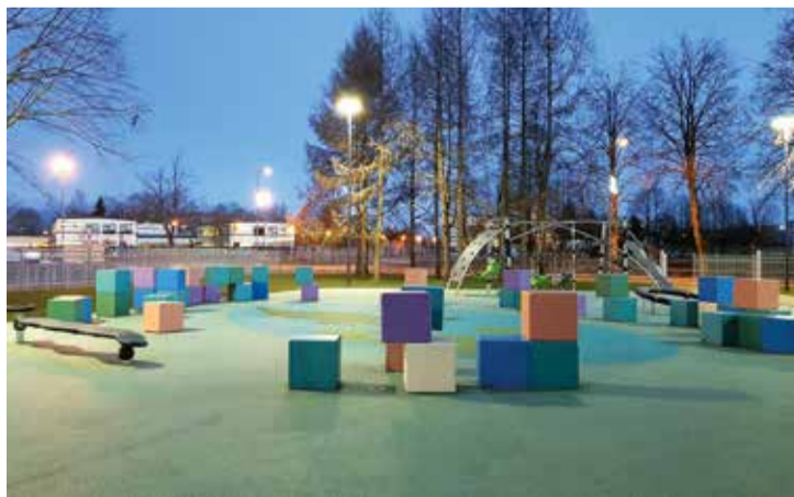
2. vidusskolas pagalmā ir izveidotas vairākas zonas skolēnu nodarbībām un mācību procesam ārtelpā.

tais projekts "Sporta un rekreācijas zonas labiekārtojums Saulkalnes daudzstāvu namu iekšpagalmā", savukārt Salaspils novada pašvaldība saņēma diplomu par ieguldījumu kvalitatīvas būvniecības veicināšanā.