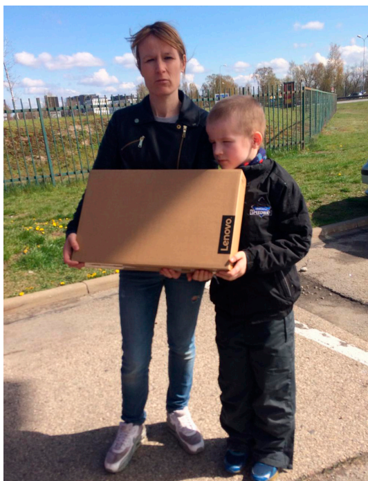
Datoru saņem Žagaru ģimenes atvase no Rīgas