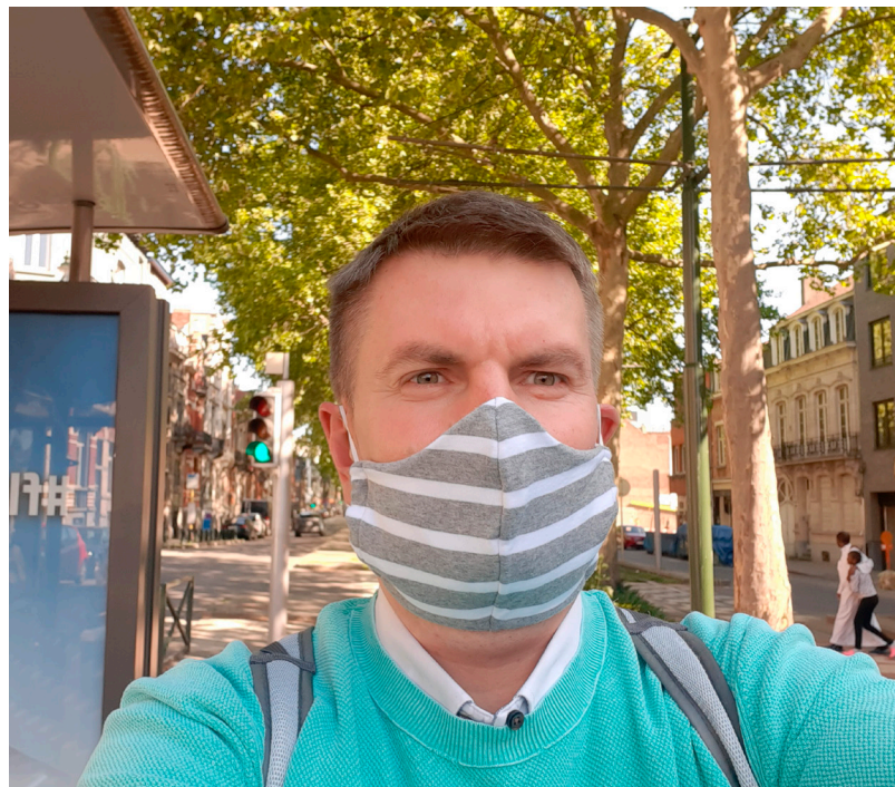
Sabiedriskajā transportā – maska obligāta!

gan par nenotikušo pasākumu Roterdamā, gan jāspēj operatīvi izvēlēties stādus savam mājoklim. Lai gan kāda latviešu dārzkoķe Briselē sociālajos tīklos atļaujas norādīt, ka “manā” dārzniecībā esot nokaltuši stādi un neprofesionāls serviss, tomēr ir ļoti grūti piekrist šādai atsauksmei. No stādu lielās daudzveidības patiešām patikami apjūku, un kur nu vēl runāt par izcili profesionālo apkalpošanu, dārznieku precīzajiem padomiem.