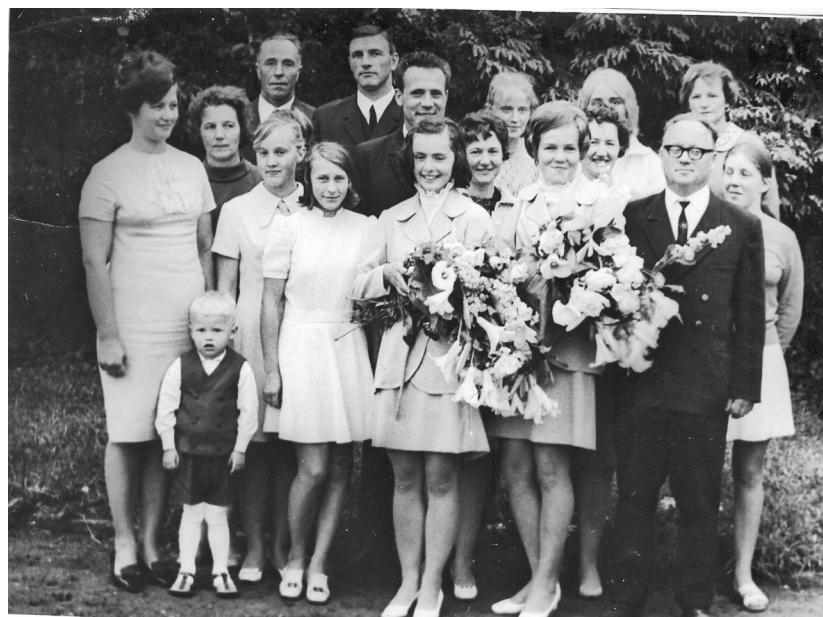
Makša meitas Ritās izlaidumā