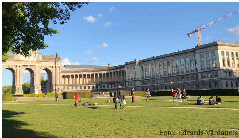
Pamazām Briseles ielās parādās arvien vairāk cilvēku

Beļģija lēni un gausi aizvērās, un tā pamazām tikpat lēnīgi un prātīgi, soli pa solim tiek atvērtā... Viss sākas ar dārzniecībām, būvmateriālu veikaliem, audumu tirgotavām, slaveno cepto kartupeļu bodītēm. Krīzes laikā esot samazinājies saldēto tupeņu apgrozījums, un kartupeļu audzētāji jau sūkstas par smagu iekritienu biznesā. Tiek solīts, ka pamazām atvērsies skolas, bet frizētavas un sporta klubi vēl būšot slēgti. Tātad – ārējais un fiziskais skaistums vēl tiek turēts izolācijā, bet nevienam jau nav liegts uzspodrināt savu garīgo un intelektuālo pasauli arī maskā.