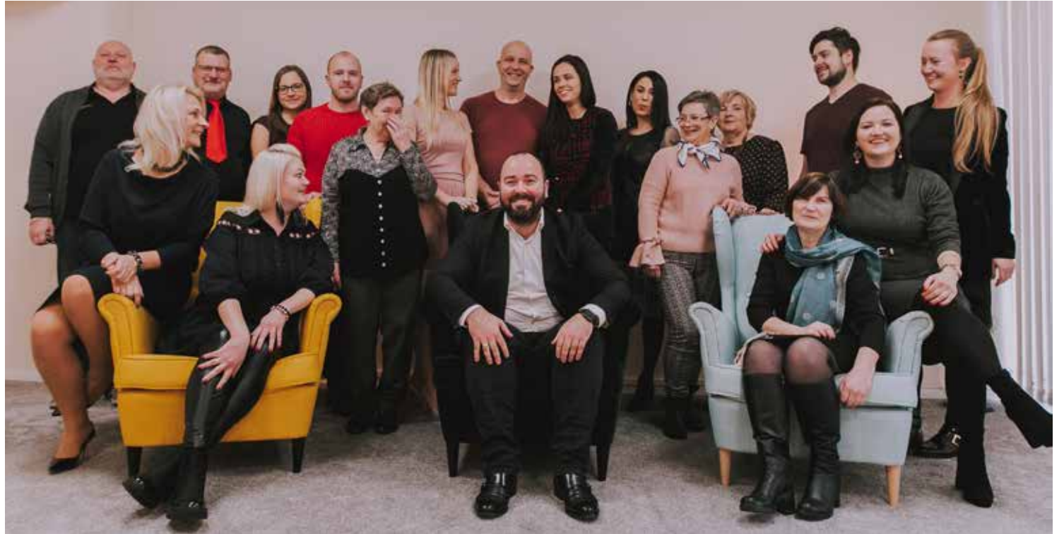
Pateicoties kultūras nama darbinieku pūlēm, salaspiliešiem ir iespēja gan dejot, gan dziedāt, gan apmeklēt daudz un dažādus pasākumus.

2019. gada sākumā k/n "Rīgava" tika realizēts arī foajē renovācijas projekts, pilnībā pārbūvējot