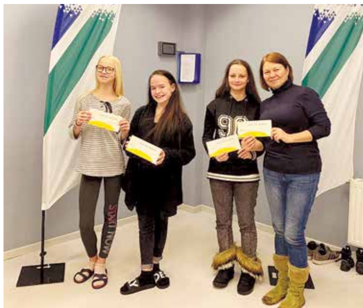
Allaž ir prieks sacensties un izcīnīt balvas.