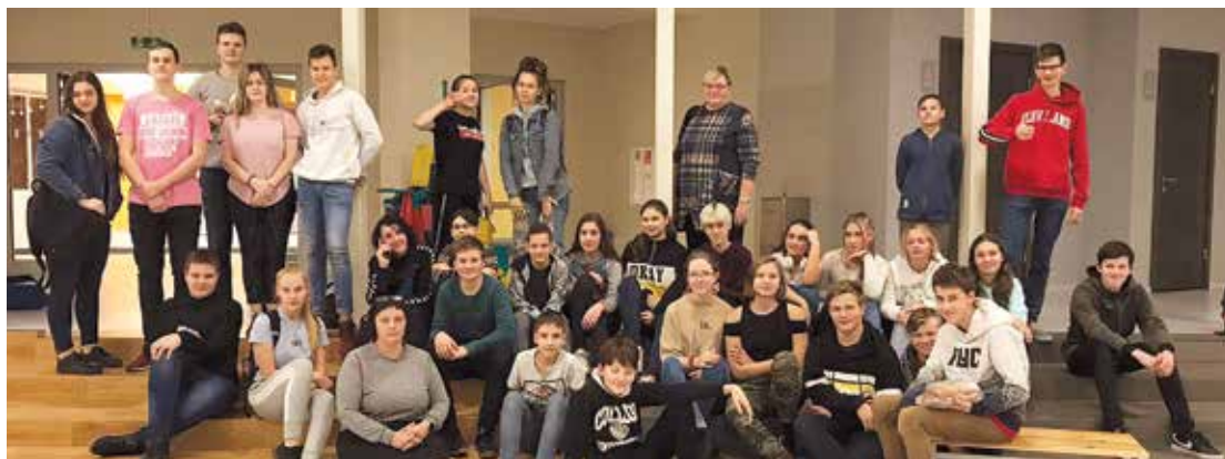
Skolēni šādās aktivitātēs labprāt piedalītos atkal.

6. decembra pēcpusdienā Salaspils 1.vidusskolā notika sadraudzības pasākums „EKO SLĒPŅOŠANA” ar 2. vidusskolas 8. un 9. klašu skolēniem. Pasākuma laikā skolēni darbojās jauktās komandās, meklējot kapsulas un norādes, apmeklējot 12 kontrolpunktus, kuros bija jāveic praktiski uzdevumi, kas saistīti ar dabaszinātņu jomas mācību priekšmetiem fiziku, ķīmiju un bioloģiju.