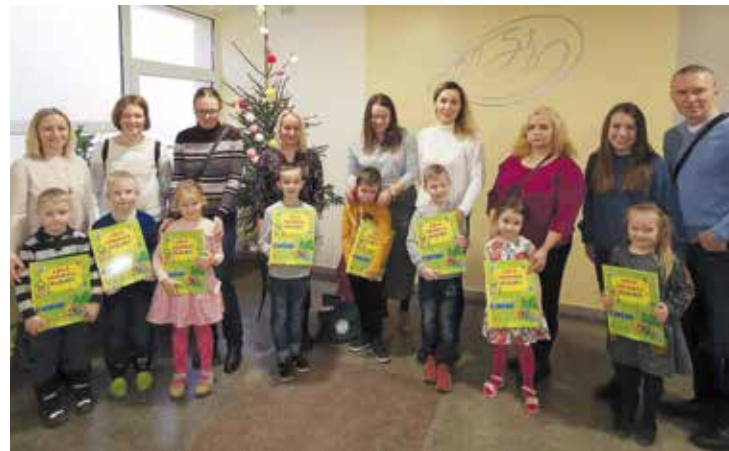
Bērni un vecāki zina, ka mācīties kopā ir daudz jautrāk.

Vislielāko prieku bērniem un vecākiem sagādāja darbošanās kopā, kopīgas aktivitātes – miklu uzdošana un minēšana, pikošanās, labo vārdu teikšana un