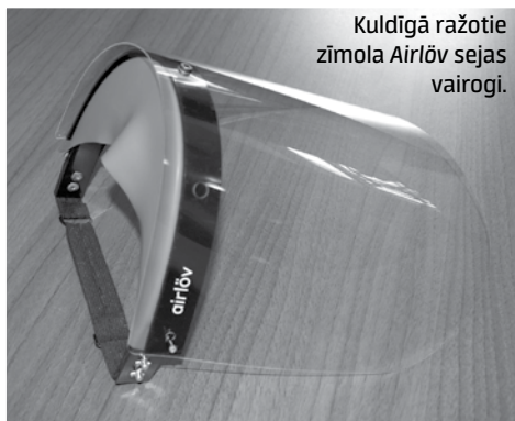
Kuldīgā ražotie zīmola Airlöv sejas vairogi.