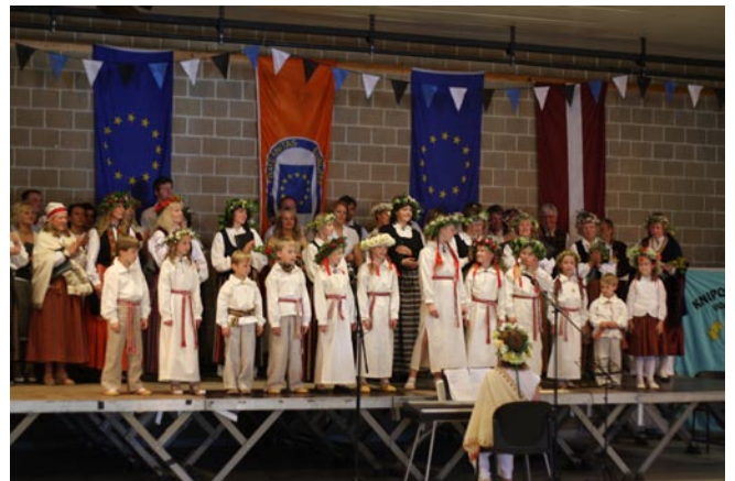
Afligemā programma bija daudzveidīga - te dzied Briseles Latviešu koris un bērnu ansamblis