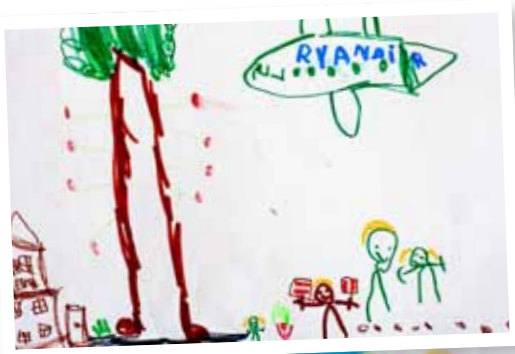
Pēteris Rungulis, 4 gadi.