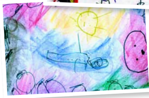
Henrijs Goldmanis, 4 gadi.