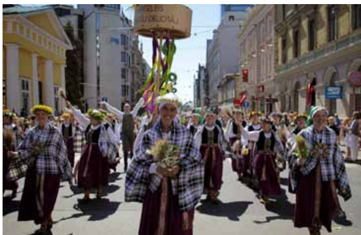
Triumfa brīdis svētku gājienā.

Un paldies mūsu mīļajiem Deju svētku virsvadītājiem par tik jēgpilniem un sakarīgiem mēģinājumiem! Ar humoru, korekti, profesionāli – tādi kopmēģinājumi mums bija ieguvums visiem. Un „laukuma suņi” – virsvadītāju lielākie palīgi un dejotāju uz klausītāji/virzītāji – bija tikpat nenogurdināmi kā mēs paši.