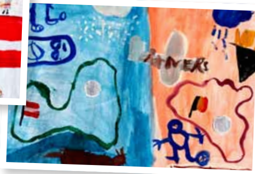
Matīss Baranovskis, 6 gadi.