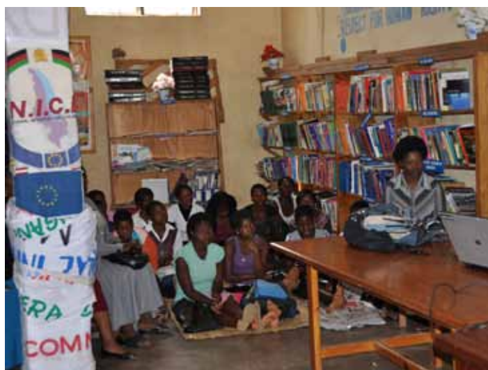
☐ Skolas klase Malāvijā, 2013