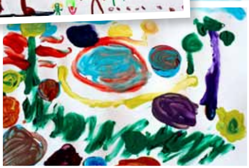
Tomass Lipinski, 3 gadi.