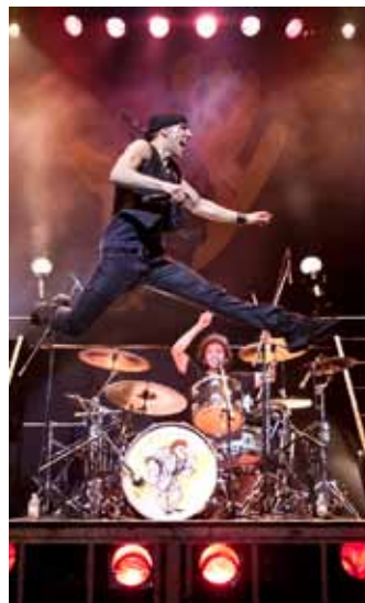
□ Extreme, Tokija, Japāna