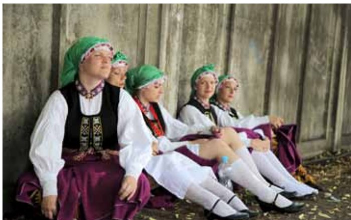
☐ Atelpas brīdī.