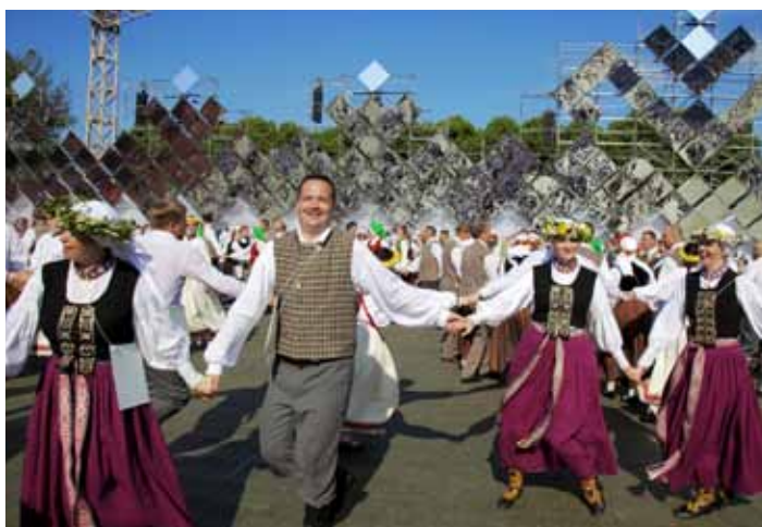
☐ “Pilnā uzkabē” 30 grādu karstumā.