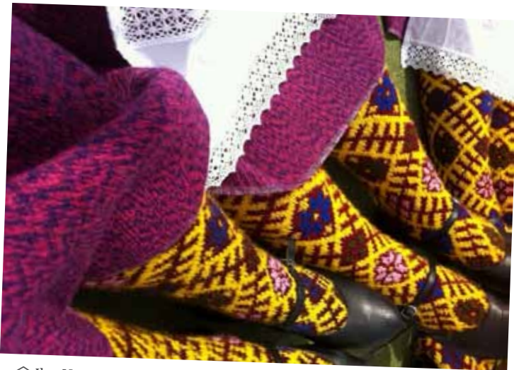
□ Ilze Vesere, Deju svētki.