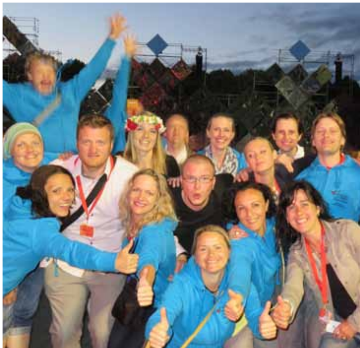
Dejotāju balles karstasinīgākie lēcēji.