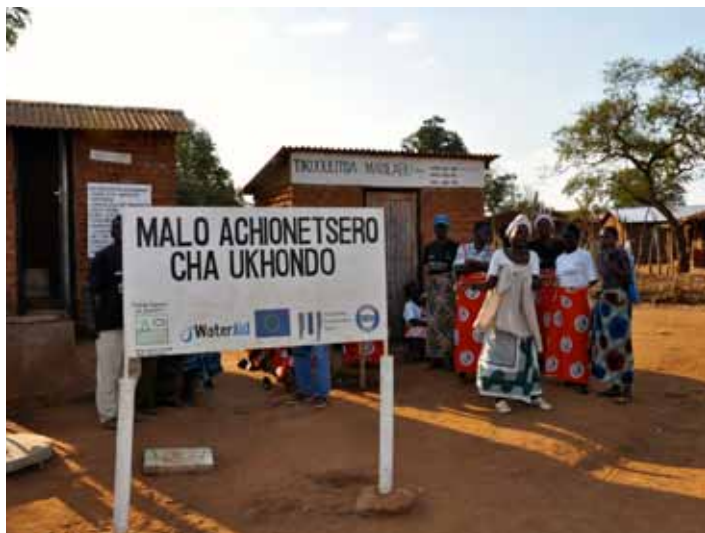
🏠 Labs darbs, kas padarīts. Malāvija, 2013

Diemžēl laika tam paliek ļoti maz, jo lielāko daļu laika es pavadu lidmašīnā. Piemēram, šobrīd neesmu bijis mājās jau trīs nedēļas, tagad paredzēts, ka ieradišos tur uz vienu nedēļu nogali un pēc tam atkal trīs nedēļas būšu prom. Faktiski es Briselē esmu ļoti īsu laiku, tas pat ir drīzāk izņēmums nekā norma. Pārsvārā esmu vai nu lidmašīnā, vai viesnīcā kādā citā pasaules daļā. Mans mandāts aptver visu pasauli, sākot ar Āfriku, kas ir galvenā daļa, bet arī Āziju, Latīņameriku, Centrālameriku, Karību jūras salas, Okeāniju. Lai pārlidotu, ir jāizmanto nakts, jāguļ lidmašīnā, pa dienu jāstrādā, tad atkal jāpārbrauc uz citurieni. Tas rada tādu ritmu, ka brīvajos brīžos gribas pavadīt laiku tikai, lai satiktu ģimeni vai vienkārši pagulētu savā gultā. Rezultātā man no daudz kā ir nācies atteikties. Es esmu attālinājies no paziņām, draugiem un vienīgais, kas ir palicis, ir ģimene un darbs. [BLZ]