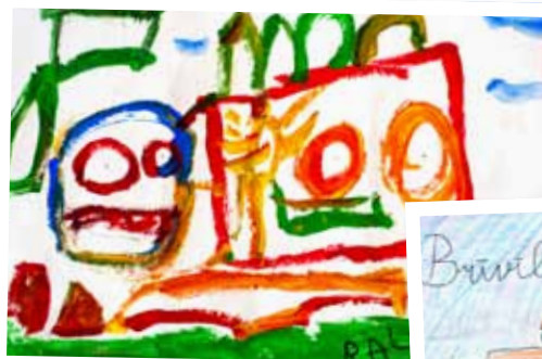
Ralfs Ozoliņš, 5 gadi.