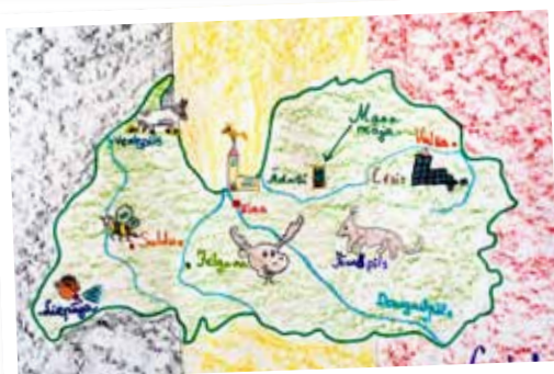
Gerda Zdanovska, 3 klase.