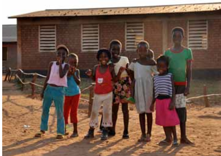
🏠 Jaunās skolas priecīgie audzēkņi. Malāvija, 2013