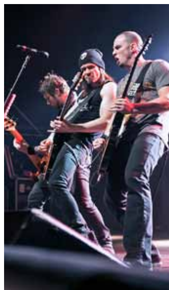
□ Alter Bridge, Brisele