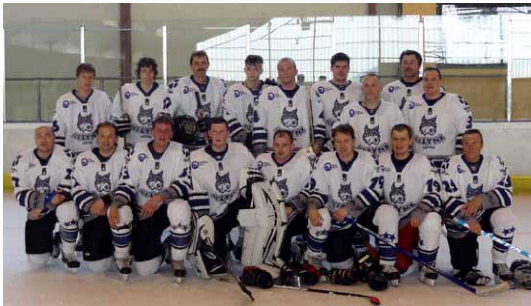
◻ Ledus lūši

- Pašreiz vietējā amatieru čempionātā nespējam startēt, bet uzspēlējam atsevišķos turnīros vai organizējam draudzības spēles. Jau pāris gadus braucam ciemos pie latviešiem uz Luksemburgu, kur pavasarī norisinās neliels turnīrs ar Luksemburgā dzīvojošo latviešu un dažu vietējo komandu līdzdalību. Piedalāmies arī turnīrā, kas risinās starp to valstu komandām, kas trenējas Lēvenes hallē. Pretinieku saraksts ir spēcīgs – Krievija, Somija, Čehija, Slovēnija un Beļģija. Šajā turnīrā startējam jau otro gadu un esam pieveikuši mūsu treniņu partnerus krievus, kā arī beļģu komandu. Sīva spēkošanās notiek ar somu, čehu un slovēņu komandām, bet līdz šim ir nācies atzīt šo hokeja lielvalstu pārākumu. Turpinām trenēties ar pārliecību, ka nākamajā turnīrā spēsim uzvarēt arī pārējās komandas.