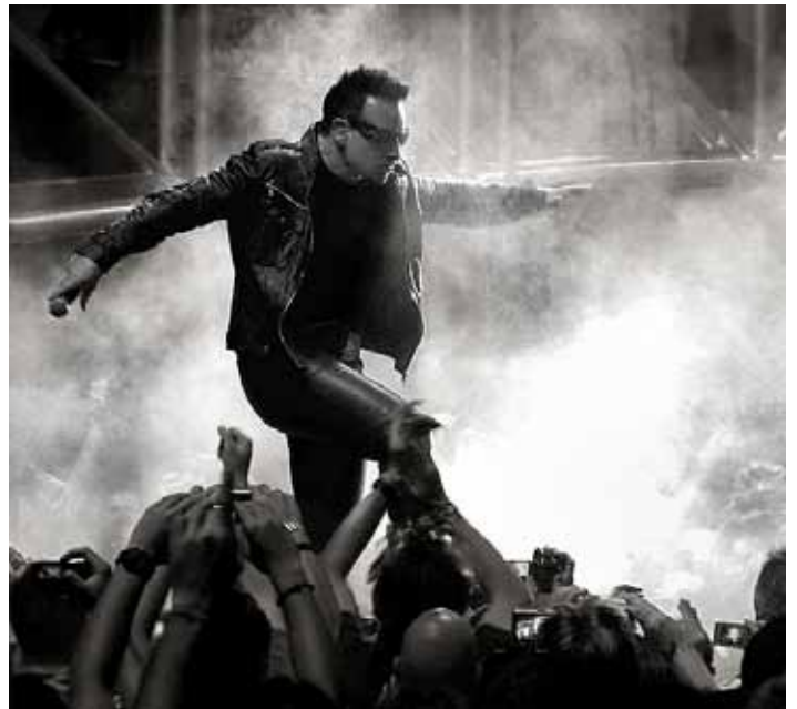
□ Bono, U2, Seviļa, Spānija

Kopš 2008. gada, kad aktīvi sāku apmeklēt koncertus un tos fotografēt, ir pagūts apceļot daļu Eiropas, ASV un pat būt Japānā. Šo gadu laikā man visai savdabīgā veidā izveidojās sadarbība ar savulaik 90. gados populāro amerikāņu rokgrupu Extreme (daudz 90. gadus pārdzīvojušie, iespējams, atminēsies šīs grupas akustisko balādi „More Than Words”). Grupa pēc ilgu gadu pārtraukuma atkal apvienojās un izdeva jaunu albumu, kam sekoja koncertturneja. Viens no koncertiem tika ierakstīts ar mērķi izdot to DVD formātā. Tā kā koncertos biju klāt ar savu neiztrūkstošo fotoaparātu, tad bilžu man netrūka un fanu priekam publicēju tās grupas fanu forumos. Līdz vienu dienu saņēmu zvanu no grupas menedžera ar lūgumu izpalīdzēt – izrādījās, ka koncertieraksta DVD un CD noformējumam nepieciešamas fotogrāfijas un grupai manas forumos publicētās bildes bija iepatikušās. Šo disku noformējumā iekļautās fotogrāfijas tad arī varu uzskatīt par savu pirmo oficiālo drukāto publikāciju. Sajūtas, redzot savas bildes uz koncertieraksta diska vāka Luksemburgas elektrotehnikas veikala DVD