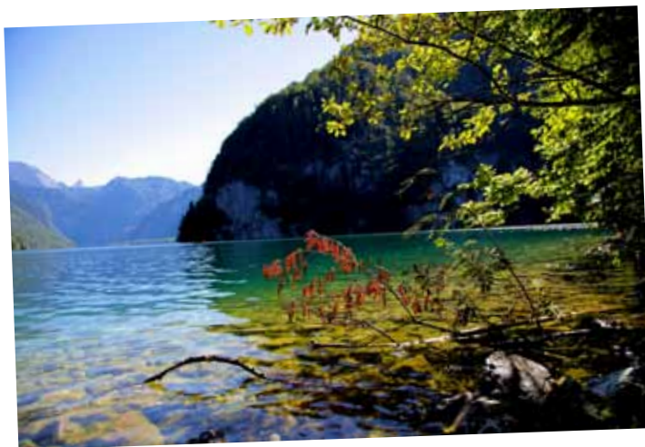
□ Dace Kalniņa, Ķēniņi pie Ķēniņezera.