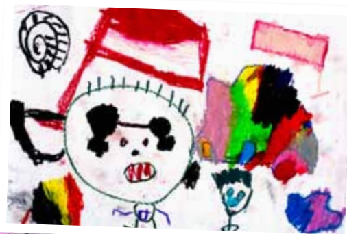
Mārtiņš Vestards Zemītis, 4 gadi.