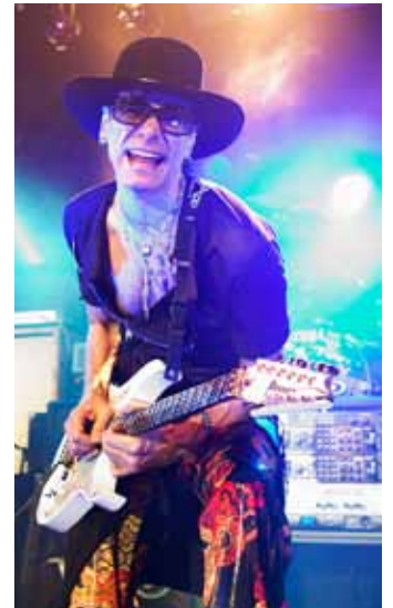
□ Steve Vai, Luksemburga