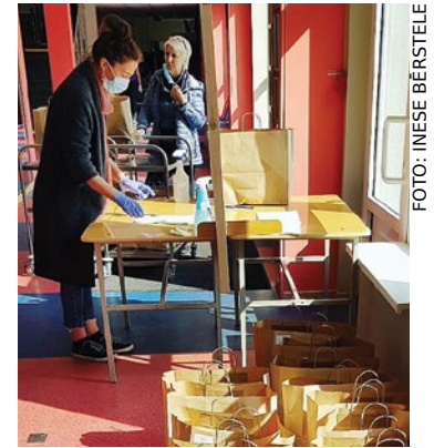
Pārtikas paku izdalīšanas pirmā diena Babītes vidusskolā.

Atbalsta pasākumus 1.–12. klases skolēniem plānots turpināt līdz