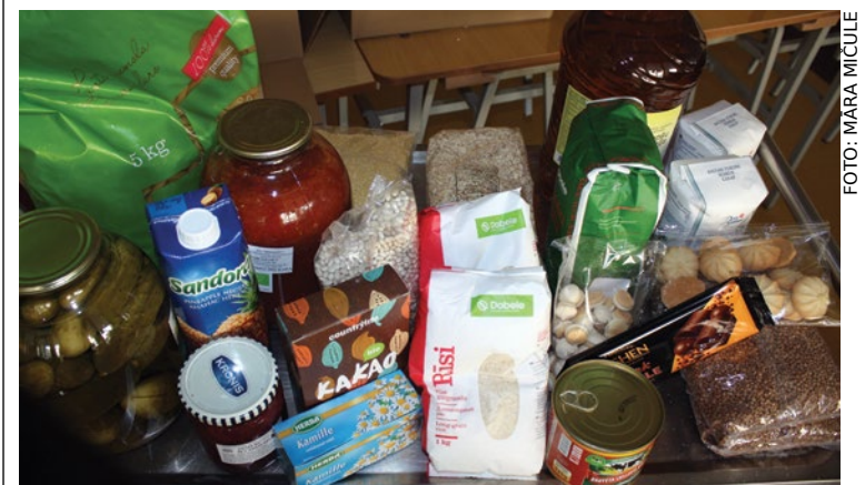
Ieskats pārtikas paku saturā – produkti ar ilgu uzglabāšanas termiņu.

Babītes novada pašvaldības sabiedrisko attiecību speciāliste