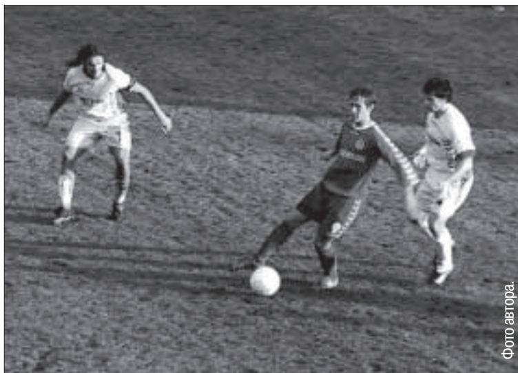
Матч между «Диттоном» и «Лиепаяс металлургс» закончился с результатом 1:2.