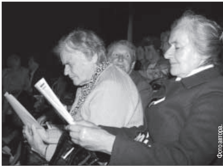
Пенсионерки знакомятся с агитационными материалами партий.