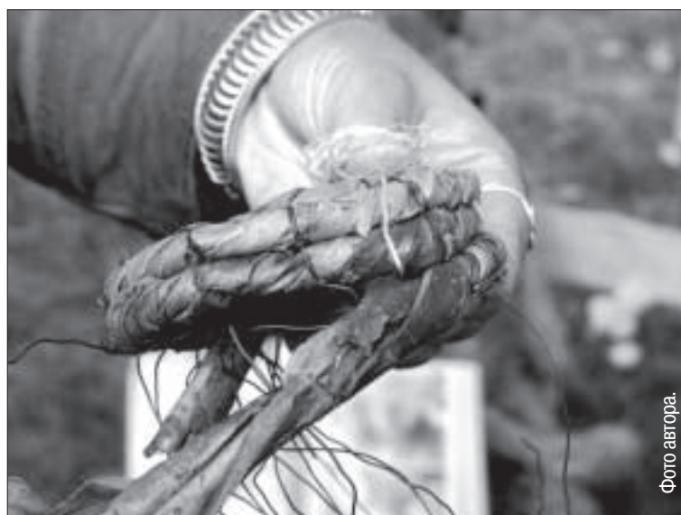
Ивовая кора подчиняется мастеру, как глина.