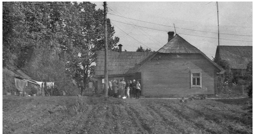
Skats uz "Apīņu" māju, 1979. gads.