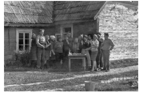
Kapusvētki, 1979. gads.