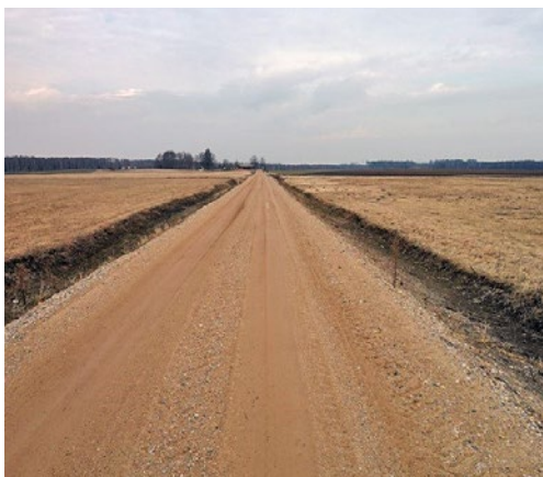
Pārbūvētais ceļa posms "Zariņi (lielceļš) - Dimanti - Pūpoli - Viesīte"