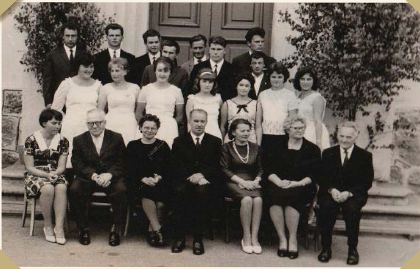
Ar absolventiem vakarskolas izlaidumā. 20. gs. 60.-desmitie gadi.

uzdāvināja invalīdu ratiņus: „Es biju ļoti pateicīga un uzdāvināju viņam pašas tamborētas apkaklītes. Pēkšņi iedomājos, ka visas humānas palīdzības nāk ar valdības ziņu, un aizsūtīju apkaklīti Zviedrijas karalienei Silvijai. Pēc neilga laika Zviedrijas karaliene pateicībā atsūtīja savu foto ar parakstu un saldumus.”