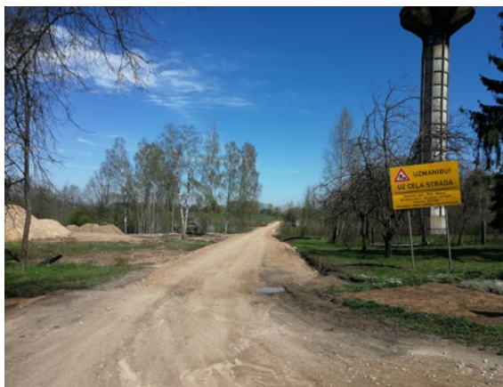
Notiek ceļa pārbūves darbi "Mazbleivi - Ilze"

EIROPA INVESTĒ LAUKU APVIDOS Eiropas Lauksaimniecības fonds lauku attīstībai