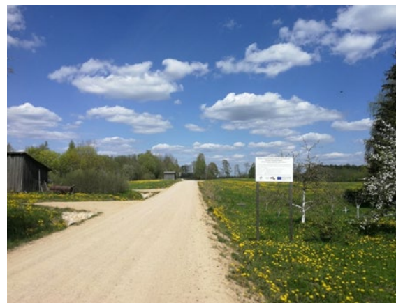
Pārbūvētais ceļa posms "Dzintari - Talcinieki - Krastiņi"