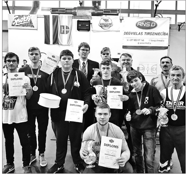
LĪVĀNU NOVADA ČEMPIONĀTĀ Aizkraukli pārstāvēja 13 atlēti.