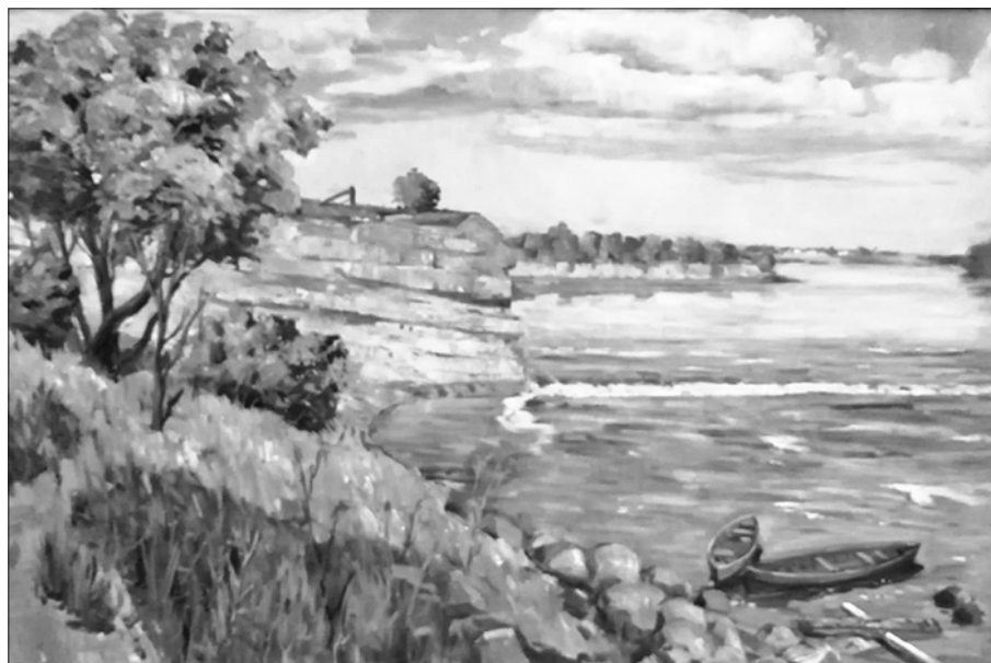
VIENA NO J. VEISA GLEZNAS "OLIŅKALNS" VĒRTĪBĀM slēpjas ainavā, kuru šodien vairāk nav iespējams apskatīt dabā.