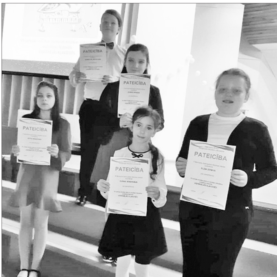
KLAVIERMŪZIKAS FESTIVĀLA DALĪBNIKI pārsvarā bija izvēlējušies laikmetīgu repertuāru klavierēm solo un dažāda sastāva ansambļiem, kurš radīja interesi jaunajiem mūziķiem un neatstāja vienaldzīgu nevienu klausītāju.

P. Barisona Aizkraukles Mūzikas skolas direktore