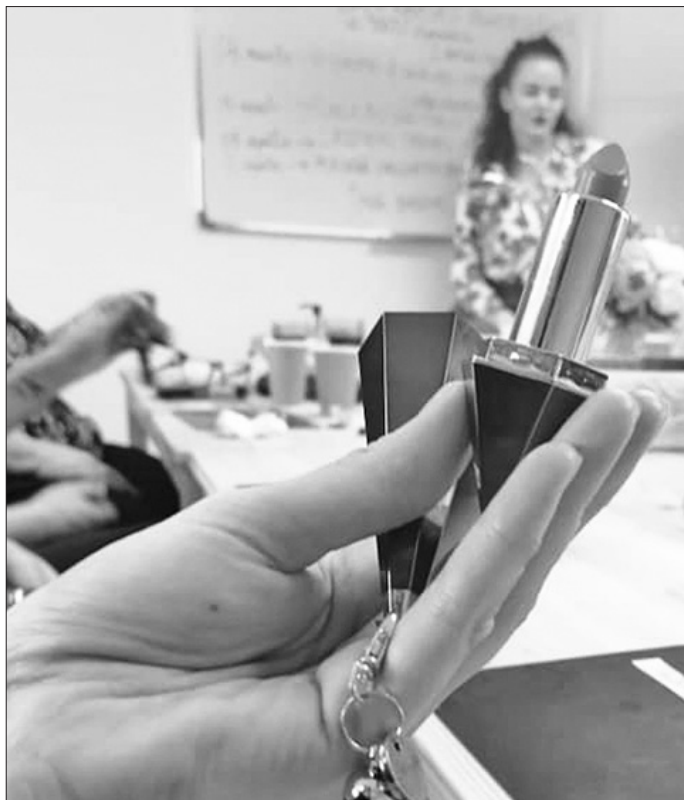
“HIP HIP URRĀ” MĀJĪGAJĀS TELPĀS notiek dažādas radošās darbnīcas. Sieviešu dienā dāmas izgatavoja savu lūpkrāsu, bet apriņķā sākumā interesenti aicināti izveidot pavasara galda dekoru.

Kā jau katru gadu, jaunās tūrisma sezonas gaidās arī šogad Aizkraukles tūrisma informācijas punkts (TIP) piedalījās tūrisma izstādē – gadatirgū “Balttour 2020”. Šoreiz gan bez vietējiem tūrisma nozares uzņēmējiem platības trūkuma dēļ.