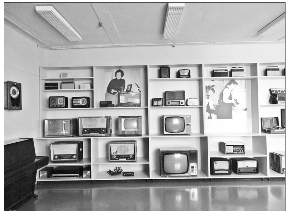
EKSPOZĪCIJA “PADOMJU GADI” interesē gan padomju laikos dzīvojušos, gan jauniešus, kuri dzimuši atjaunotajā Latvijā.

Uzņemot ciemiņus vai pašam doties ceļojumā, lieliska dāvana būs suvenīri ar Aizkraukles simboliku. Suvenīri iegādājami Aizkraukles TIP (Spīdolas iela 2), ziedu salonā “Fantāzija” (Bēzru iela 4) un salonā “Centrs” (Lāčplēša iela 3).