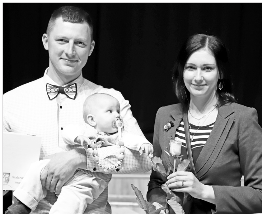
PĒRN SVEIKTIE MAZUĻI JAU PAAUGUŠIES, un šogad uz sveikšanu tiek aicināti 2019. gada jaundzimušie. Attēlā – Ciematnieku ģimene ar dēliņu.

Tuvojoties pasākuma dienai, pašvaldības pārstā-