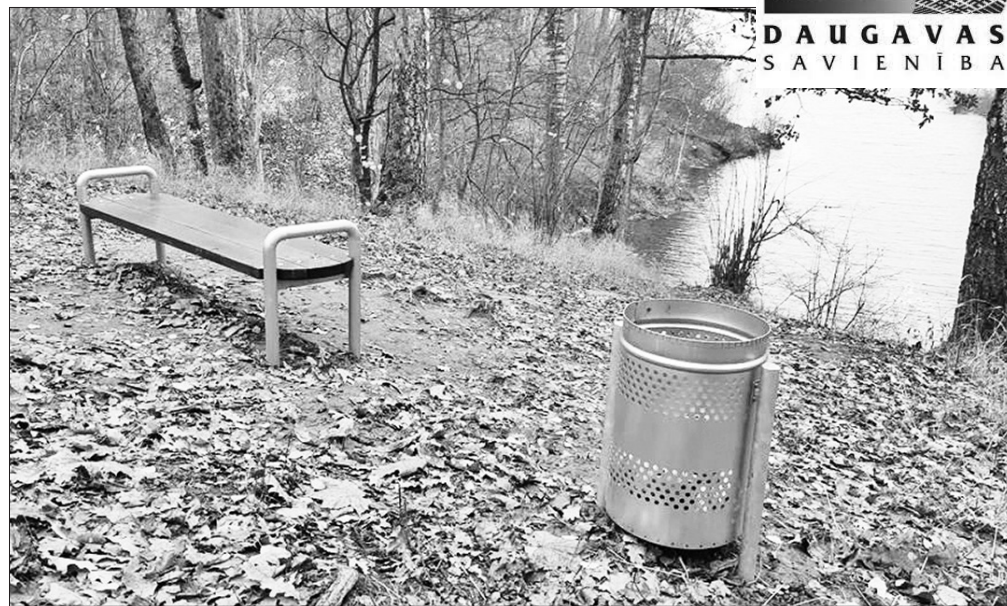
SOLIŅI UN ATKRITUMU URNAS ar "Daugavas savienības" finansējumu iepriekš uzstādīti arī gar dabas taku Aizkrauklē.

Ar biedrības "Daugavas savienība" atbalstu Aizkrauklē arī šogad īstenos vairākas ieceres atpūtas un kultūras dzīves dažādošanai novadā. Biedrības valde ikgadējā projektu konkursā lēmusi piešķirt finansējumu visām trim Aizkraukles pašvaldības un tās iestāžu iesniegtajām projektu idejām.