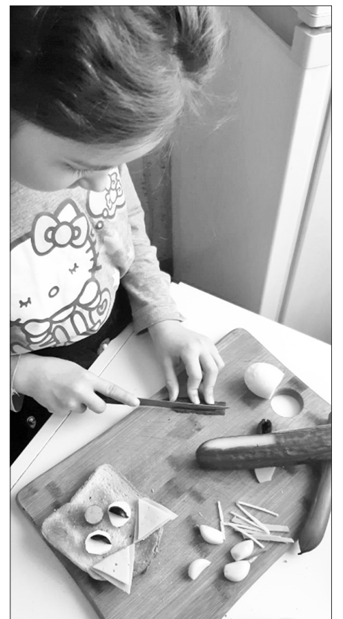
ARĪ MĀJTURĪBU nu jāmācās katram savās mājās.

Es uzskatu, ka saņemu ļoti pilnvērtīgu atgriezenisko saiti. Bērni izpilda uzdevumus un vecāki nosūta tos man, pievienojot komentārus par to, kā bērnam veicās – vai tika galā patstāvīgi vai bija nepieciešama palīdzība, kas padēvēs viegli, kas sagādāja grūtības. Es, savukārt, ar bilžu rediģēšanas programmas palīdzību, izlaboju iesūtītos darbus, un nosūtu tos atpakaļ bērniem.