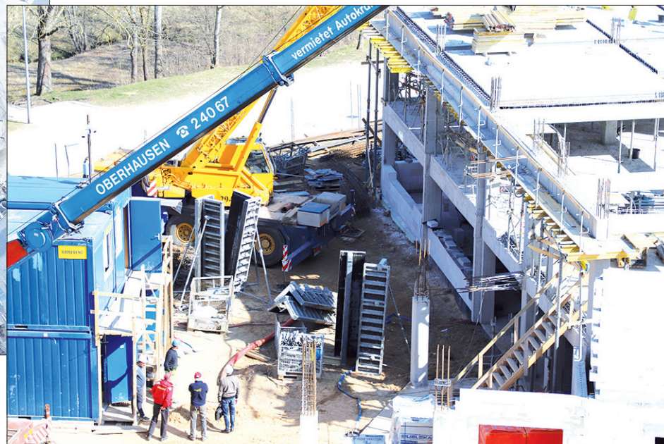
PIEBŪVES CELTNIECĪBA NORIT KĀ PLĀNOTS. Būvdarbus pavada pastiprināti darba drošības pasākumi – strādnieku veselība tiek rūpīgi kontrolēta.

aprēķinu precizēšana, lai ventilācija darbotos klusi un skolēniem uzturēšanās šajās telpās būtu komfortabla.