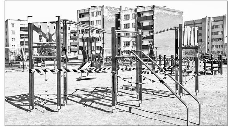
ROTAĻU LAUKUMI UN ĀRA TRENAŽIERI uz laiku norobežoti, lai mazinātu saslimšanas riskus ar koronāvirusu, kas uz virsmām var saglabāties līdz pat 72 stundām.

Kā atzīst pedagogi, liels izaicinājums ir digitālo tehnoloģiju apgušana un dažādu tiešsaistes instrumentu izmantošana mācībās. Tie jāapgūst arī vecākiem un skolēniem. Un tas viss – diezgan lielas spriedzes un steigas apstākļos. Arī pašvaldības domes sē-