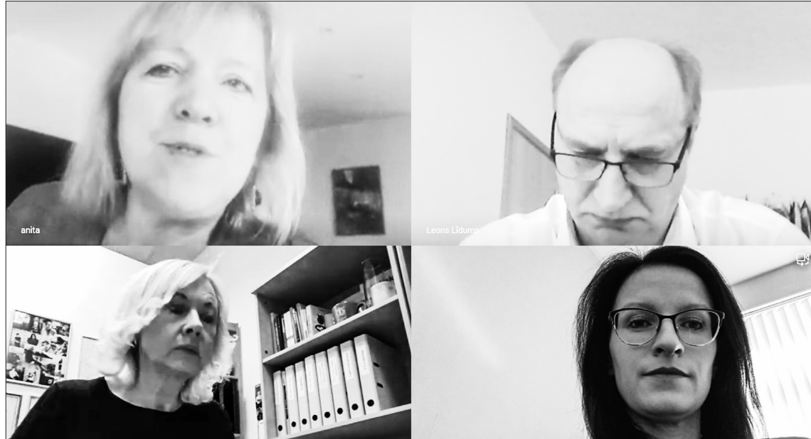
ĀRKĀRTĒJĀS SITUĀCIJAS PERIODĀ visas domes sēdes noris videokonferences režīmā.