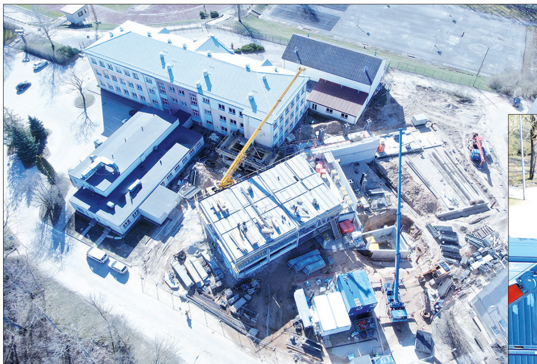
PIEBŪVI PLĀNOTS NODOT EKSPLOATĀCIJĀ NOVEMBRI, skolas vajadzībām to daļēji varēs sākt izmantot no jaunā gada.

Lai gan kopējā situācija koronavīrusa izraisītās pandēmijas dēļ valstī šobrīd ir diezgan nestabila, Aizkraukles novada vidusskolas piebūves celtniecība Draudzības krastmalā turpinās un norit atbilstoši plānotajiem laika un izmaksu grafikiem. Piebūve top projekta Nr. 8.1.2.0/18/I/005 "Uzlabot vispārējās izglītības iestāžu mācību vidi Aizkraukles novadā" ietvaros, un tās kopējās izmaksas būs 4 020 891,84 eiro. Šobrīd, ēkai paceļoties virs zemes, pamazām kļūst redzamas tās aprises un izmēri.