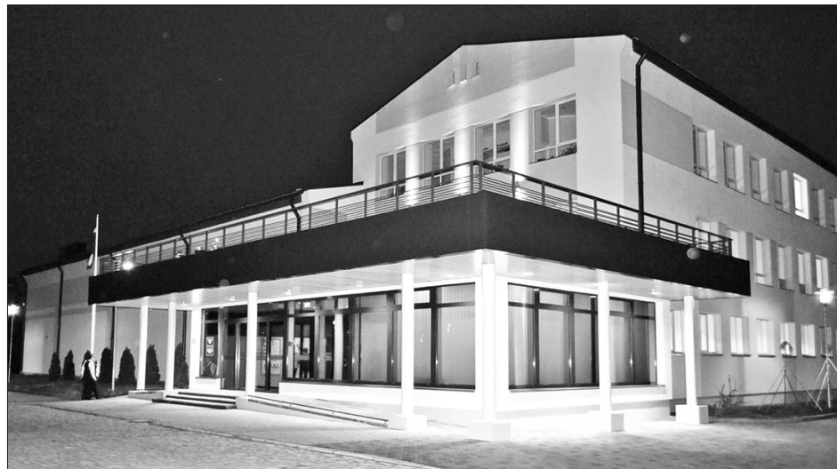
NEPĀRSNIEDZOT PIEĻAUTO APMEKLĒTĀJU SKAITU, kultūras namā notiks iekšējās telpu un arī brīvdabas kino seansi.