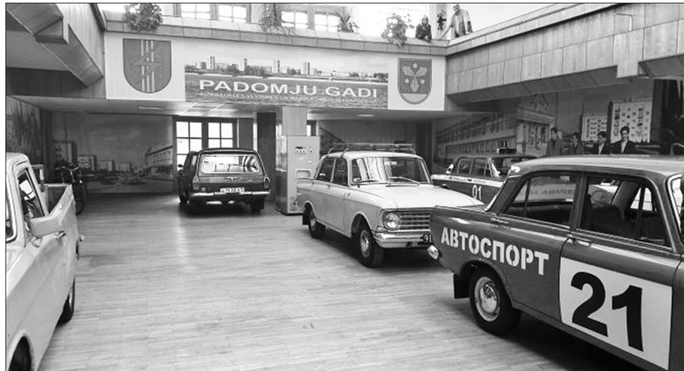
LĪDZ AR MUZEJA EKSPOZĪCIJAS "PADOMJU GADI" ATVĒRŠANU Aizkrauklē cer piesaistīt tūristus un veicināt vietējās uzņēmējdarbības atjaunošanos.