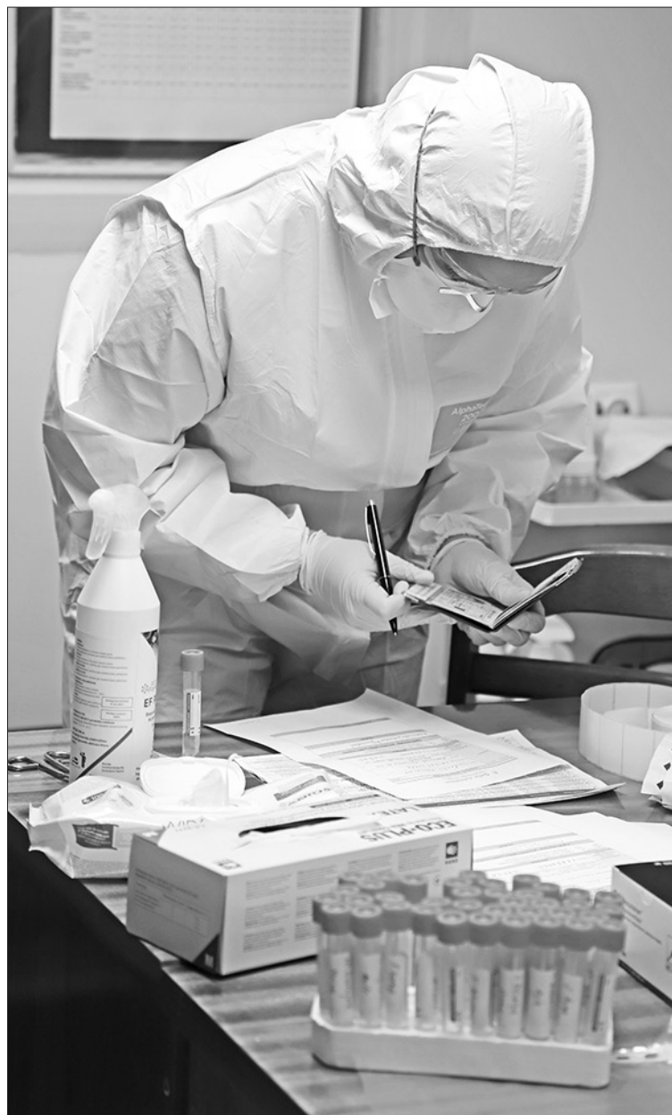
"COVID-19" TESTUS VEICA pirmsskolas izglītības iestāžu "Zilīte" un "Auseklītis" telpās, kur strādāja E. Gulbja laboratorijas speciālisti no Jēkabpils.

Testēšanas rezultātus saņems katrs darbinieks individuāli. Pozitīva testa gadījumā informācija tiks sniegta arī pirmsskolas iestādes vadītājam, un pašvaldība rīkosies atbilstoši Slimību profilakses un kontroles centra rekomendācijām.