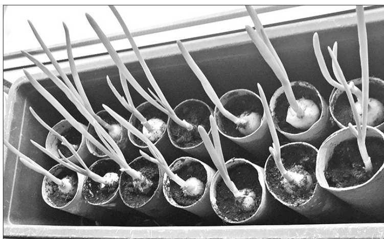
EVIAS ĢIMENE vitaminus nepērk aptiekā, bet gan uzņem tos ar veselīgu ēdienu.

Jauna darba forma ir jauniešu ar invaliditāti grupai "Solis" – izveidota WhatsApp grupa, kurai tiek doti uzdevumi, viņi rāda savu paveikto, par