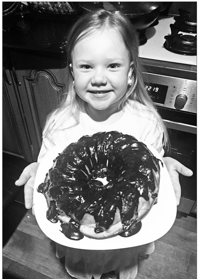
VISLABĀK, JA BĒRNUS IZDODAS IESAISTĪT gatavošanas procesā.

Sociālā darba būtība – sniegt palīdzību un atbalstu cilvēkiem, kuriem tas nepieciešams. To mēs arī godprātīgi darām."