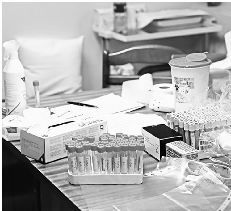
DROŠĪBAS NOLŪKOS analīzes ņēma gan grupu audzinātājam, gan tehniskajiem darbiniekiem, kas tiešā saskarē ar bērniem nenonāk.

"Mūsu novada iedzīvotāji ir satraukušies, jo Aizkrauklē līdz šim ir konstatēti vairāki