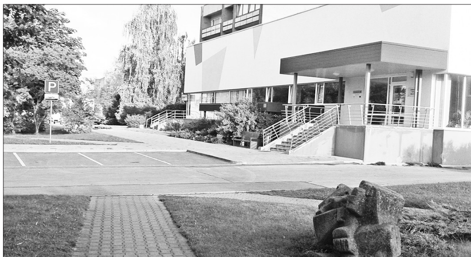
TURPMĀK IEDZĪVOTĀJIEM BIBLIOTĒKĀ atkal būs pieejami divi datori, būs iespēja skenēt, kopēt un drukāt dokumentus.

Pēc ārkārtējās situācijas ierobežojumu daļējas atcelšanas no 12. maija Aizkraukles pilsētas bibliotēka turpinās lasītāju apkalpošanu darba dienās no 11:00 līdz 17:00, ievērojot sanitārā protokola noteikumus. Sestdienās un svētdienās bibliotēka slēgta.