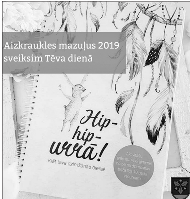
AIZKRAUKLIETIES DACES BEBRIŠAS radīto grāmatiņu, kas ir unikāla, Aizkrauklē radīta dāvana jaunajiem vecākiem, Aizkraukles mazuļi saņems šogad un arī nākamajos gados.

Lai pieteiktu savu jaundzimušo pasākumam, vienam no vecākiem, aizbildnim vai audžuvecākam jāiesniedz iesniegums Vienotajā valsts un pašvaldības klientu apkalpošanas centrā (VPVKAC) Lāčplēša ielā 1, Aizkrauklē, 1. stāvā. Iesnieguma veidlapa pieejama pašvaldības mājaslapā www.aizkraukle.lv sadaļā "Pašvaldība/Pakalpojumi/Ģimenēm pieejamie pakalpojumi, VPVKAC vai Aizkraukles novada Dzimtsarakstu nodaļā". Pieteikums pieņems visa gada garumā, uz sveikšanu Mātes dienā līdz 1. aprīlim,