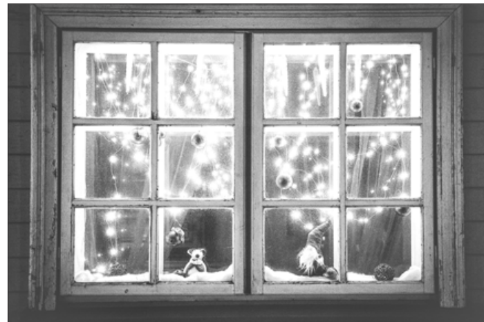
Aizpute decembrī tērpjas mirgojošā svētku rotā, un to iemūžinājis aizputnieks, fotogrāfs Mārtiņš Kalniņš.