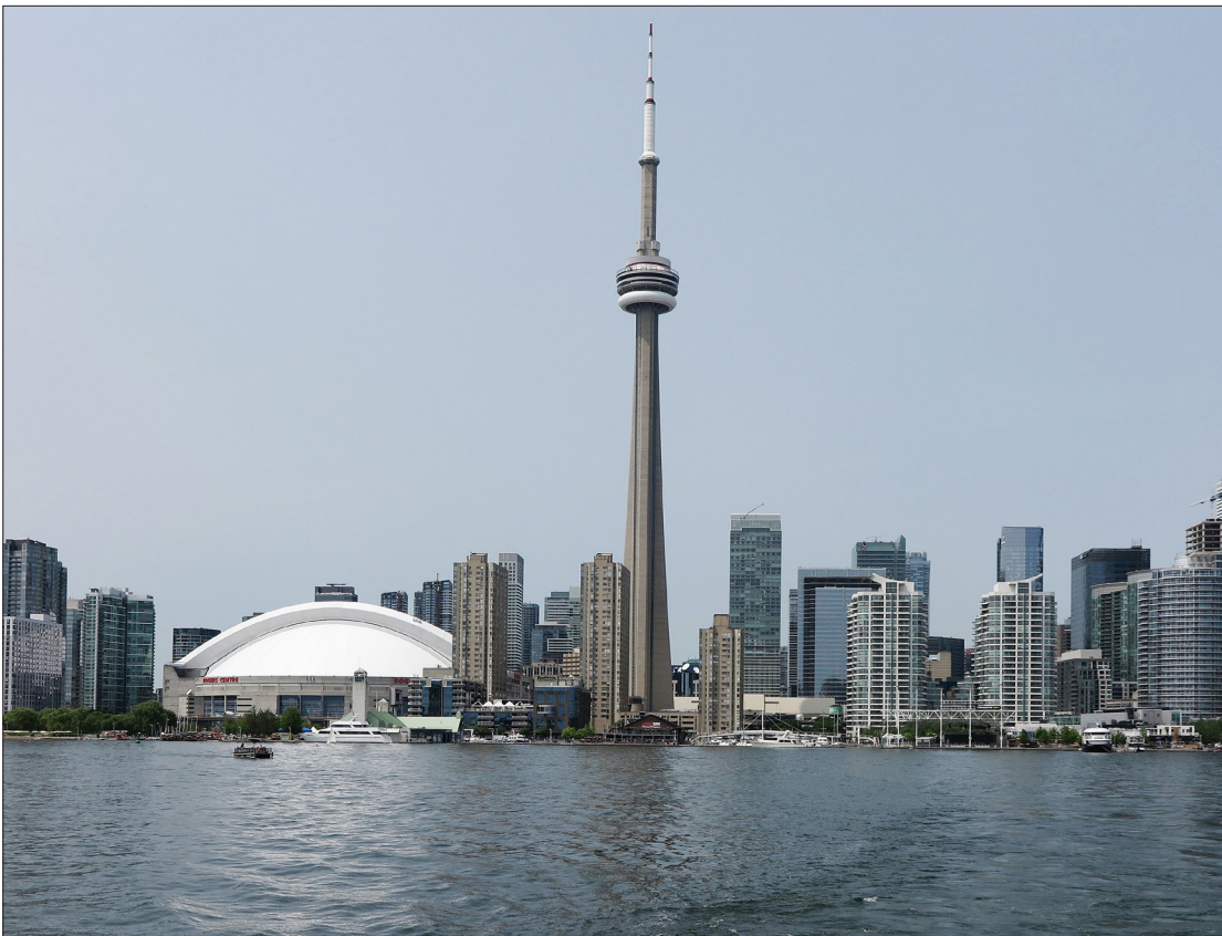
Klasisks skats uz Toronto pilsētu.

No 5.februāra Aizputes pilsētas bibliotēkā būs skatāma Dina Kopštāles fotogrāfiju izstāde par ceļojuma iespaidiem Kanādā.