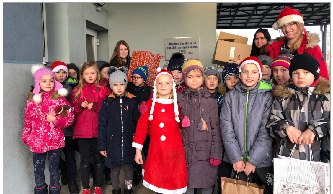
Mazi un lieli rūķīši gatavi iepriecināt iepriecināt svētkos ar dāvanām, smaidiem un dziesmām.