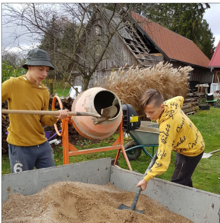
Mazpulka jaunieši iesaistās aizraujošās un praktiskās nodarbībās.

Aizputes 1013. Mazpulks pagājušā gada vasarā realizēja projektu "Medus vasara", kas bija Aizputes 1013. mazpulka pirmais „Lielais projekts”. Pašreiz projekts „Medus vasara” tiek rādīts visiem interesentiem kā LABĀS PRAKSES piemērs, par ko liels prieks un gods ir gan pašiem, gan iesaistītajiem, gan Aizputes novada iedzīvotājiem.