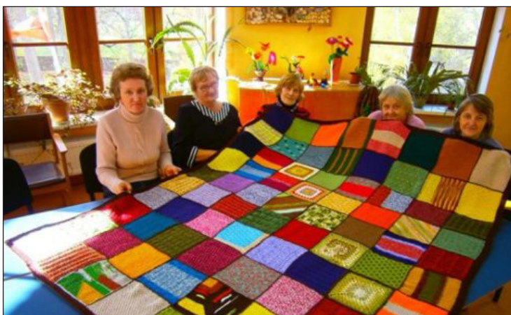
Lietišķās mākslas kolektīva "Tinga" dalībnieces ar savu veikumu.

Cīravas pagasta bibliotēka jaunajā gadā interesentiem piedāvā Talsu novada lietišķās mākslas kolektīva "Tinga" darbu izstādi "Vaļasprieka lidojums". Izstāde tiks atklāta 6.februārī plkst. 14.00 pagasta pārvaldes zālē, piedaloties viesiem no Tiņģeres un mūsu pašmāju rokdarbu darinātājiem. Pēc atklāšanas mākslas kolektīva "Tinga" meistaros organizēs visiem interesentiem meistar-darbnīcas jaunu rokdarbu darināšanas veidu apguvē.