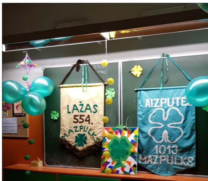
Aizputes 1013. mazpulka sadraudzības pasākums Aizputes vidusskolā

Projekta laikā bērni aktīvi darbojās septiņās dažādās izziņošanās pieturās, guva daudz jaunu zināšanu par dabu un Latviju. Kā stāsta Lažas 554. Mazpulka un Aizputes 1013. Mazpulka vadītāja Liene Cinovska, pasākuma mērķis bija nodrošināt izziņošanās pieturas speciālo skolu skolēniem par vides iedarbību uz mums un mūsu pašu rīcību seku rezultāta izvērtējums – ko darām vai nedarām pareizi. Galvenais uzsvars likts uz praktisku darbošanos ar videi draudzīgiem elementiem, izziņošanā,