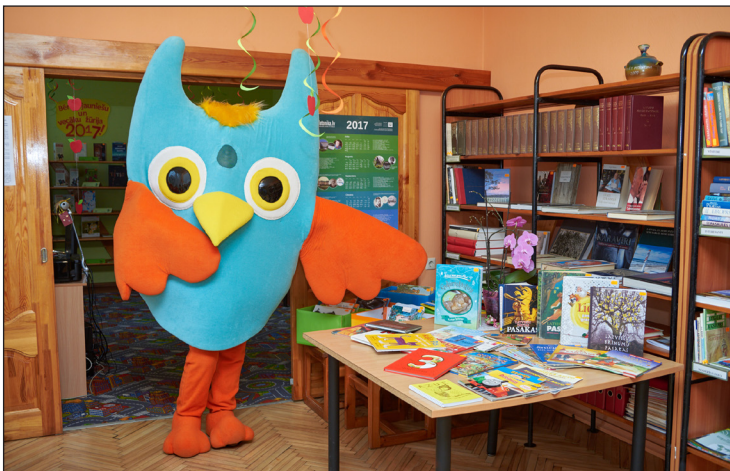
Bibliotēka gaida mazos pūčulēnus

Jau trešo gadu Cīravas pagasta bibliotēka piedalās LNB Atbalsta biedrības piedāvātajā projektā "Grāmatu starts". Projekta mērķis – iepazīstināt ar bibliotēkas pakalpojumiem mērķgrupu, kuri audzina bērnus vecumā no 3–4 gadiem, lai veicinātu lasīšanas tradīciju izkopšanu ģimenēs.