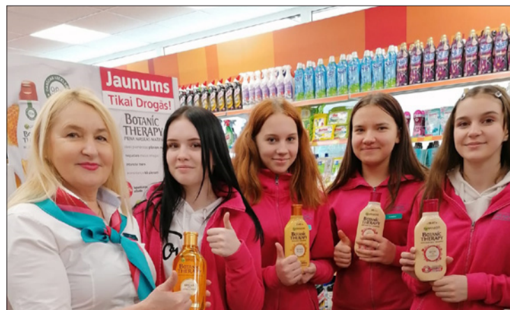
Māteru Jura Kazdangas pamatskolas meitenes AS Drogas Kuldīgā

Māteru Jura Kazdangas pamatskolā ēnot devās 2. - 9.klašu skolēni un ēnoja visdažādāko profesiju pārstāvjus. Iepazīs ar veikala pārdevēja, veikala vadītāja, konditora, bērnu dārza audzinātāja, pedagoga, psihologa, frizieres, pašvaldības darbinieka, IT speciālista, lauksaimniecības speciālista, meža nozares, jūrniecības nozares un pārtikas nozares profesiju pār-