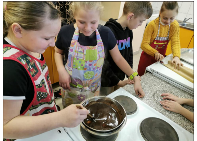
Aizputes vidusskolas 4.a klase gatavo šokolādes brauniju.

(Informāciju apkopoja Aizputes novada pedagoģes-karjeras konsultantes Vineta Bardanovska un Monta Balode)