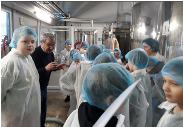
Aizputes vidusskolas 4.b klase uzņēmumā SIA Elpa.