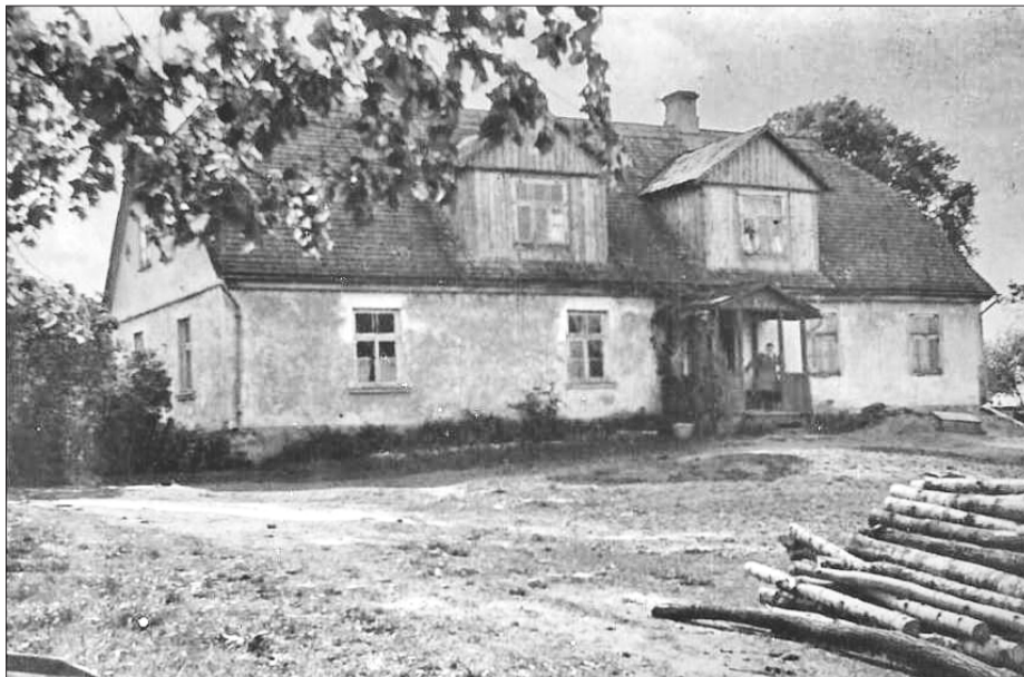
Mājas "Ziles" Kazdangas pagastā, 20.gs. 40.gadi.