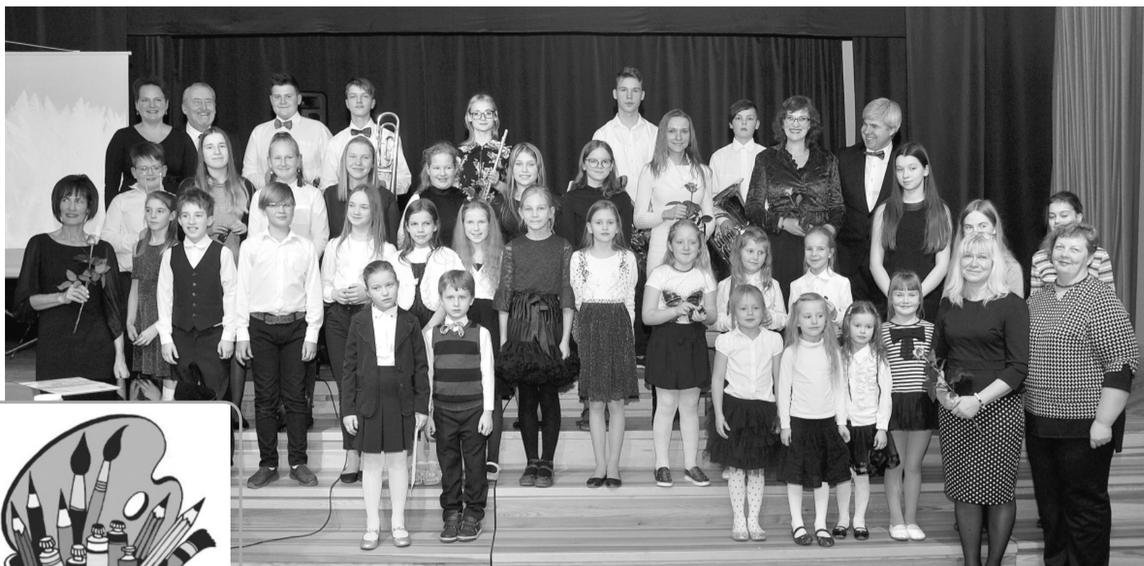
Līgatnes Mūzikas un mākslas skolas kolektīvs.

Gluzi kā dabā, tā arī Līgatnes Mūzikas un mākslas skolā ikdienas dzīve turpinās, tikai nu jau attālināta un vērsta uz sociālo distancēšanos, lai mēs visi jau pavisam drīz atkal varētu nākt kopā un klātienē muzicēt, gleznot, zīmēt un veidot. Bet šim valsts ārkārtējās situācijas laika posmam esam izstrādājuši attālinātā mācību procesa organizācijas plānu. To esam veidojuši kopīgi ar Līgatnes Mūzikas un mākslas skolas metodisko komisiju vadītājiem, pedagogiem un administrāciju. Ar šo plānu esam iepazīstinājuši mūsu skolas audzēkņu vecākus un, protams, pašus audzēkņus. Mēs turpinām mācīšanās un mācīšanās procesu mūsu īstenotajās profesionālās ievirzes izglītības programmās. Katrā mācību priekšmetā esam centušies atrast veiksmīgāko attālinātā mācību procesa organizācijas saziņas, darba metodes un atgriezeniskās saites veidošanu starp mūsu skolas audzēkņiem un skolotājiem. Tāpat ik mirkli turpinām uz-