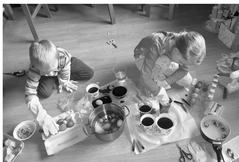
Bērnu radošās aktivitātes.

dēt labas sadarbības piemērus, praktiskas lietas no ikdienas pieredzes. Gaisotne kursos bija brīva, atraisīta, bija iespēja radoši darboties. Skolotāju palīgiem veidojās izpratne, kas ir mainījies apmācības procesā, kādēļ ir būtiski nedarīt bērnu vietā to, ko viņi spēj paveikt paši, kā iesaistīt bērnus vides kopšanā, kādēļ tik nepieciešama pieaugušā pacietība? Ir svarīgi bērnam atvēlēt laiku, lai uzdevumu paveiktu līdz galam. Tas nostiprina bērnam apziņu, ka viņš pats spēj tikt galā ar lietām, un nākošajā reizē viņš