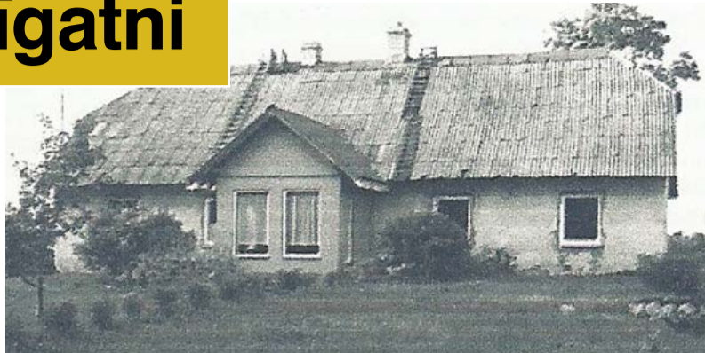
Paltmales pamatskola "Skudrukalnā" (1863. – 1875.). Foto: Sigurds Rusmanis 2010. gadā.

Skolotājs Bormanis blakus skolas darbam nodarbojās arī ar rakstniecību, mācību grāmatu sastādīša-